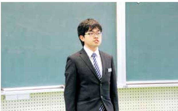
▲先輩からのお祝いのことば