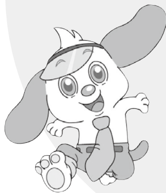
日章学園マスコットキャラクター 愛称「ニッシー」くん