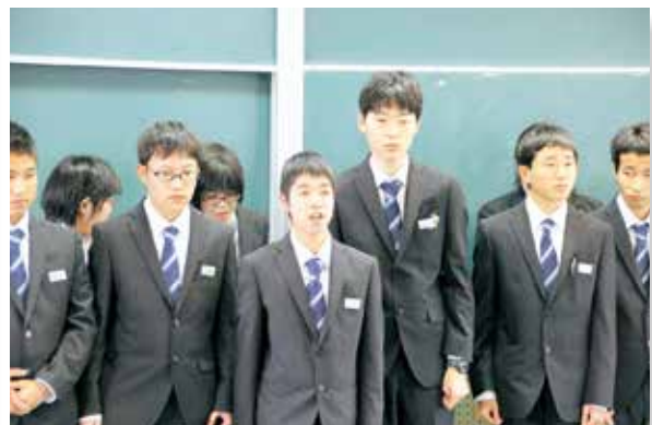
▲専攻科新入生の自己紹介