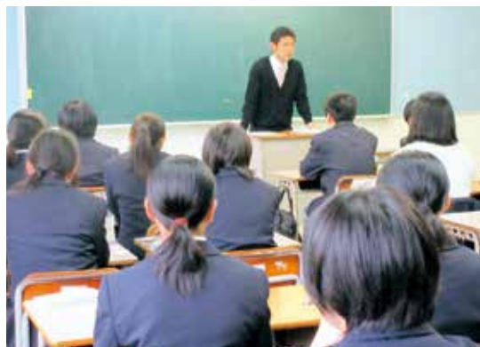
▲調理科1年A組のHR活動の様子

親元を離れ寮生活をする私は、実習で学んだ料理を自分の食生活にとり入れ、自分自身をライバルと思いながら辛いことがあっても負けずに何事にも一生懸命取り組みたいと考えています。特色のある鹿児島城西高等学校の調理科で3年間楽しく、大好きな料理を学び、「父の味を越える」を一番の目標にして、卒業後は自分のお店を持てるような一流のシェフになりたいと思います。そして、私が作った料理で人を笑顔にし、たくさんの人に幸せを届けたいと思います。