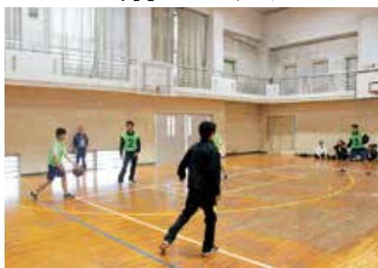
▲男子バスケットボール