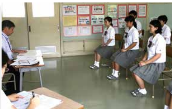
▲昨年度の外部講師による面接指導の様子