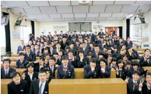
▲集合写真を撮りました。

4月10日(月)には、共生コース・福祉共生専攻科の対面式を実施しました。みんなで楽しく昼食をとり、新入生から一人ずつ自己紹介をしてもらいました。特別支援教育部の生徒は、137名となり、これまで以上に賑やかな雰囲気になりそうです。少しでも早くお互いの顔と名前を覚え、充実した学校生活を送ってほしいものです。