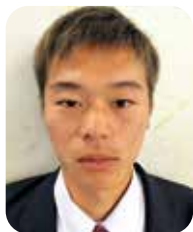
普通科進学体育コース 3年A組

以上の目標、努力事項を掲げ鹿児島城西高等学校の名を全国に鳴り響かそうと取り組んでいます。今回は目標を立て学校生活に熱く燃えている生徒を紹介したいと思います。