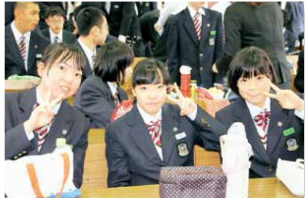
▲みんなで弁当を食べました。