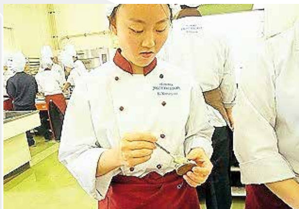
▲クリームをサンドする様子