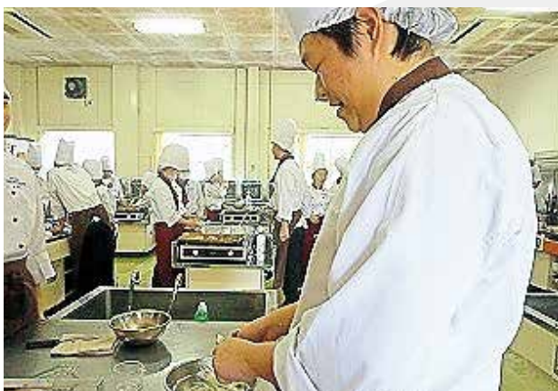
▲クリームを作る様子

グループのメンバーと協力しながら、1，2年生で学んできたことを活かして、手際よく作業に打ち込んでいました。また、これから様々なイベントや学校行事もありますので率先して取り組めるように頑張ってください。