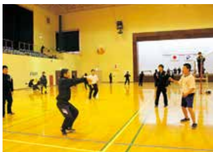
▲男子バレーボール