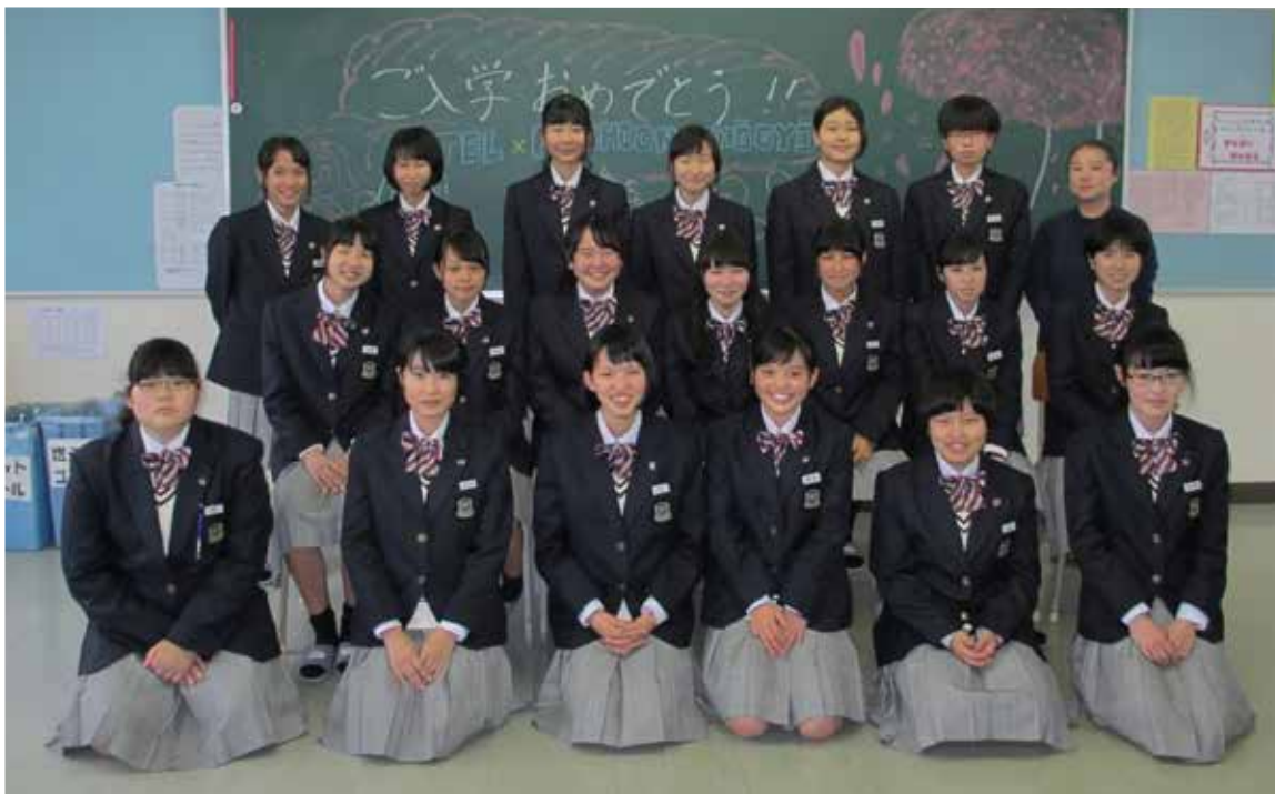
▲1年生19名、よろしくお願いします。

4月8日(土)に入学式が行われ、ファッションデザイン科にも19名の新入生が仲間入りしました。大きな夢や希望とともに多少の不安も抱えながら入学された皆さんが、19名それぞれの個性を認め合い、切磋琢磨しながら目標達成に向けて努力し、充実した高校生活を送ることができるよう、2・3年生や職員でサポートしていきます。