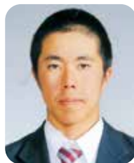
普通科進学体育コース 3年B組

その目標を達成するために、日々の練習から自分の課題に取り組み、試合ではしっかりと結果を残せるように頑張っていきたいです。そして、たくさんの人に応援されるチームになりたいです。