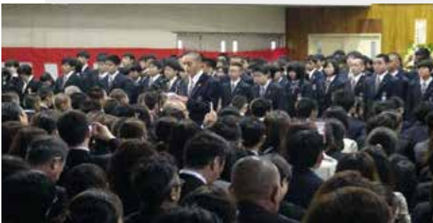
▲新入生保護者への感謝のことは