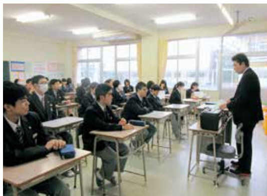
▲調理科1年B組のHR活動の様子