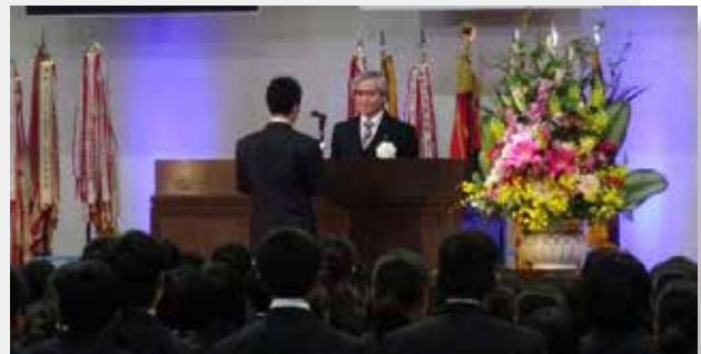
▲新入生誓いのことは