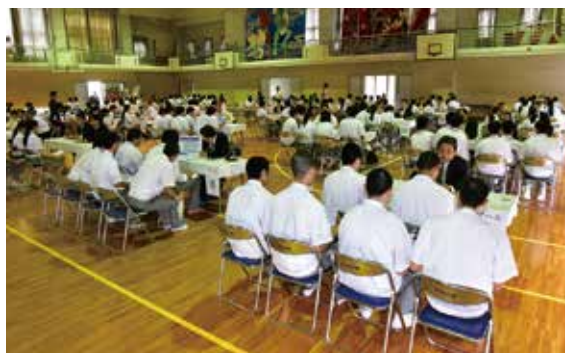
▲昨年度の進路ガイダンスの風景

卒業後のよりよい進路決定に向けて，保護者の皆様もぜひご理解とご協力をお願いします。