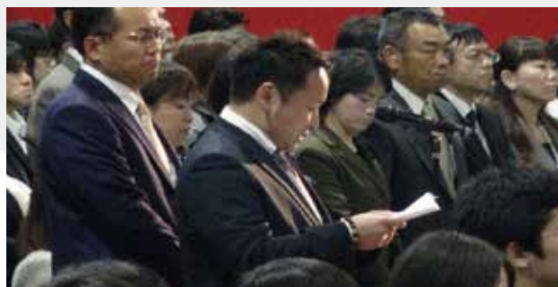
▲新入生保護者代表あいさつ