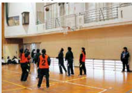
▲女子バスケットボール