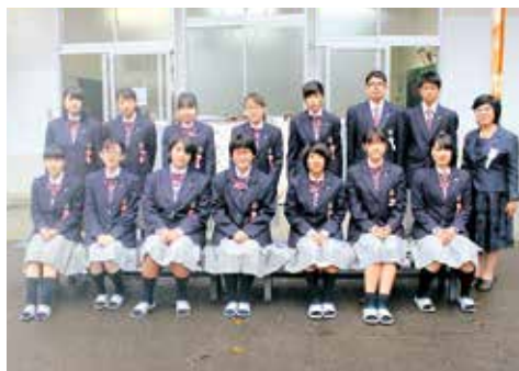
▲新入生のみなさん

そして、最終的には介護福祉士国家試験の合格に向けて精一杯頑張り、鹿児島城西高等学校で夢を掴んで卒業したいと思っています。