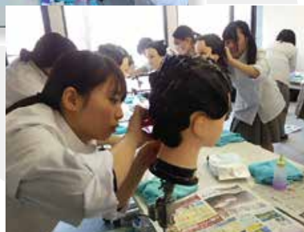
▲国家試験課題を練習中