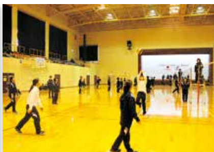
▲女子バレーボール