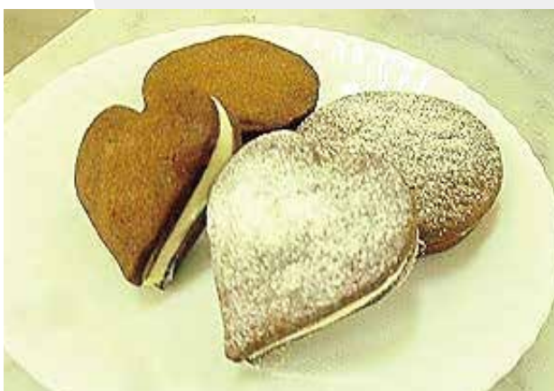
▲ラムレーズンクリームサンド