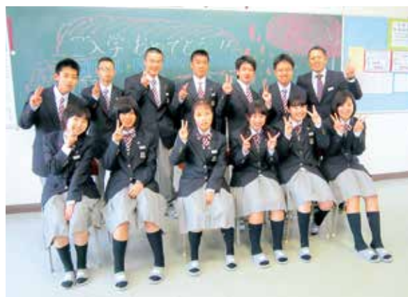
▲全員で頑張ります。