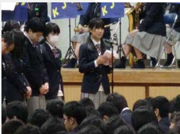
▲生徒会長あいさつ