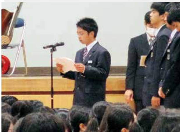
▲新入生代表あいさつ