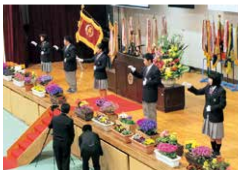
▲2・3年生による学園歌・校歌手話