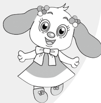
鹿児島城西高等学校 マスコットキャラクター 愛称「ジョディ」さん