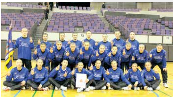
▲男子バレー部、九州大会頑張ります！