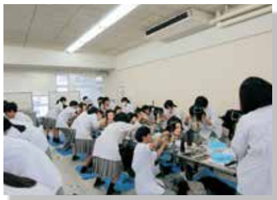
▲国家試験対策の様子

3月末には全員が合格し，入学時の目標である美容師の夢を実現できるよう願っています。