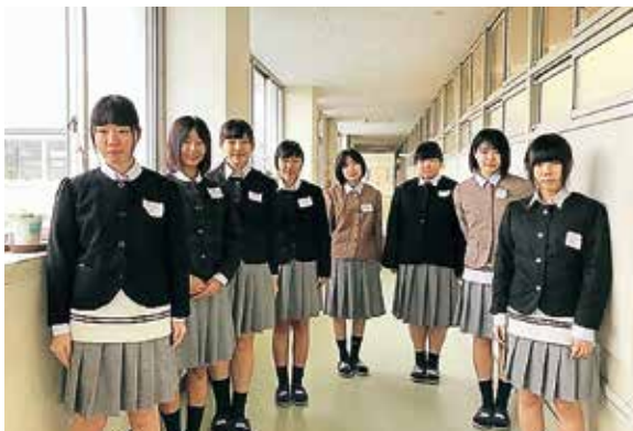
▲着装審査を前に緊張した様子の3年生

1月に被服製作技術検定が実施され、3年生は、最後の検定となる洋服1級に挑戦しました。洋服1級の実技課題は総裏付きジャケットを4時間で仕上げるものです。事前準備にも時間をかけて取り組み、全員が作品を完成させました。筆記試験・実技試験に加え、着装審査も実施され、3年間技術検定を通して学び、技術の向上を実感しました。