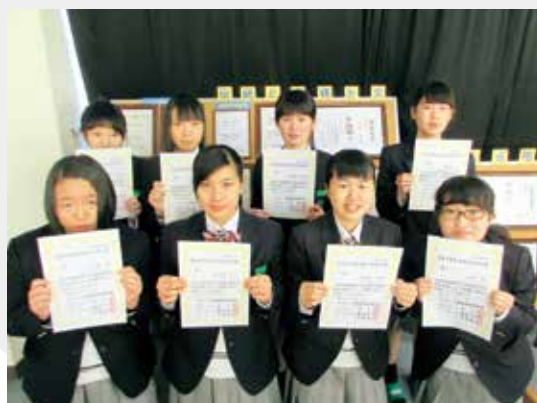
▲電卓検定1級合格生徒