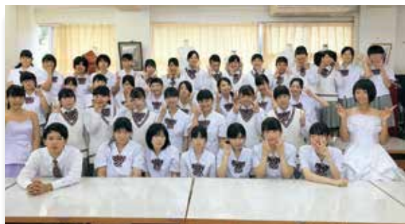
▲実習室に全員集合！

ファッションデザイン科3年生の皆さん、ご卒業おめでとうございます。3年間ファッションに関する専門教科の知識や技術を磨き、かけがえのない仲間と友情を育んで来ました。4月から新しい目標に向かう皆さんを、在校生、学科職員一同心から応援しています。