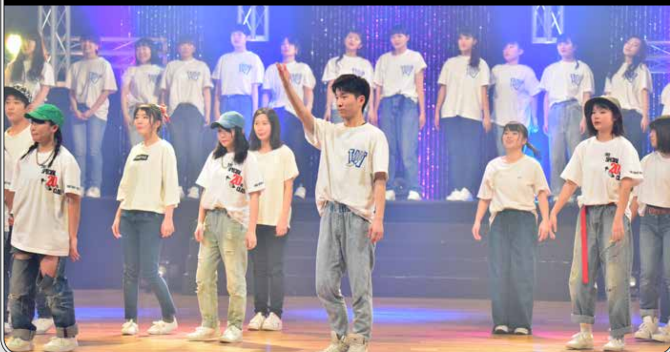
普通科 芸術文化コース公演フィナーレ