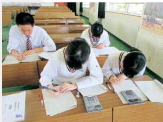
検定合格に向けて取り組む姿