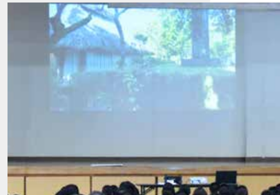
▲奄美の文化や観光資源についてのビデオを観賞しました。