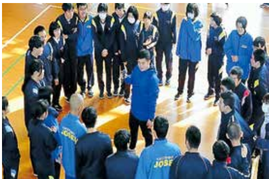
▲先生を囲んでドッジボールの作戦会議

当日は、午前中はレクリエーションを実施し、午後はロードレース大会・ボウリング大会の表彰式、これまでの教育活動を振り返るVTRの鑑賞、卒業生、在校生からのお別れの言葉、記念品贈呈等を行い、楽しく思い出深いお別れの会を実施することができました。