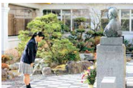
▲聖域での合格祈願の様子

鹿児島城西高等学校の社会福祉科で学んだ3年間に自信と誇りを持って今後の人生を歩んで行ってみたいです。皆さんが，これからの超高齢社会の日本を支える素晴らしい人材になってくれることを期待します。