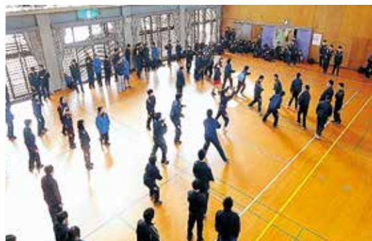
▲レクリエーションドッジボール