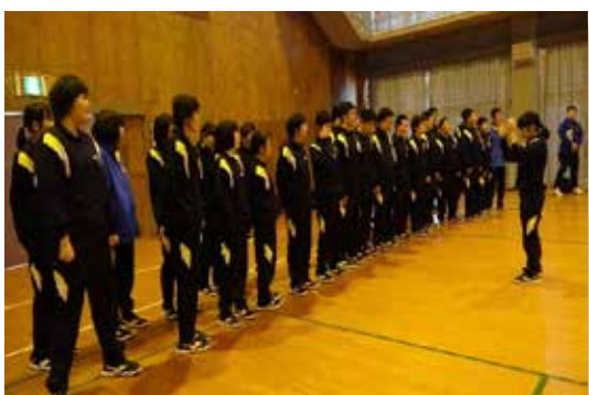
▲2年生による歌の出し物