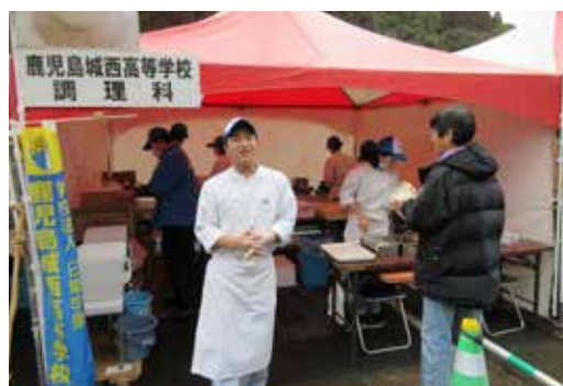
来て下さったお客様に感謝の一日になりました。