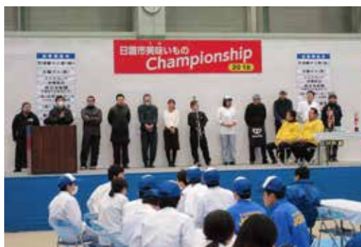
天候の悪いなか、多くの方々が来場してくれました。

私は今回初めて美味しいものチャンピオンシップ2018に参加してとても良い経験が出来ました。私は元々人見知りです話すのがあまり得意ではなかったのですが、今回販売をすることになり接客としてお客様と直接話すことが出来、少しですが自分に自信ができました。今回のこの経験で多くのことを学ぶことが出来て本当に良い一日になりました。