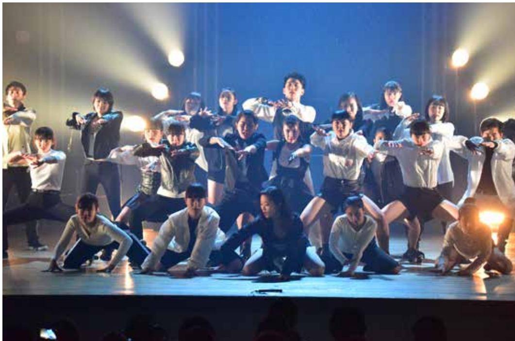
▲第3学年ダンス作品

平成30年2月17日（土）伊集院文化会館にて普通科芸術文化コースによるコース公演が行われました。たくさんのお客様に、ご来場頂きスタッフ一同本当に感謝しております。出演した生徒は専門教科の学習を通して習得した成果を披露し、とても貴重な経験が出来たとともに成長出来たと思います。また、卒業生のステージなどもあり、学校創立90周年にふさわしい公演になりました。