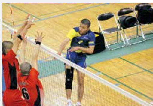
▲力強いスパイクを決める