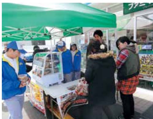
▲ファミリーマート店頭販売

2月7日（水）、ファミリーマート伊集院猪鹿倉店にて店頭販売会が行われました。当日は天気にも恵まれ、多くのお客様にお買い上げいただきました。同日、放課後の校内でも販売が行われました。「おいしそう!」という声と共に、多くの生徒が集まりました。