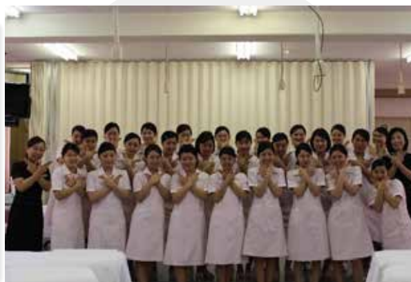
▲認定試験に向けてのエステポーズ