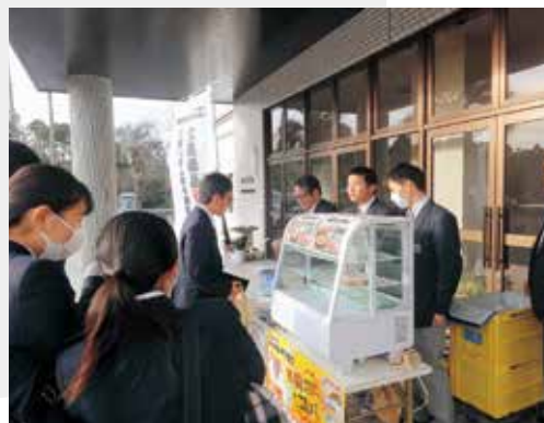
▲下校前の生徒が集まりました。