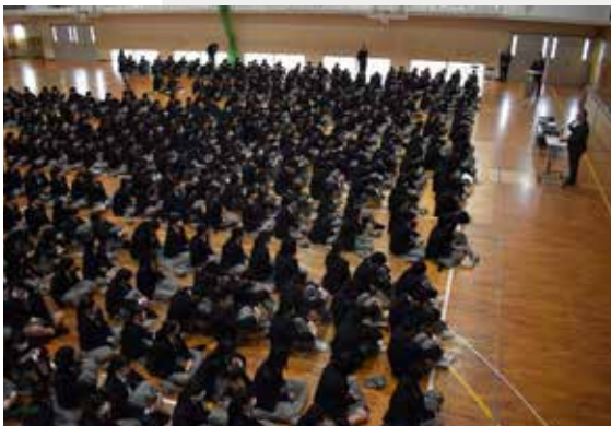
▲今回参加した2年生の皆さん