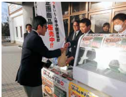
▲体育館前にて販売