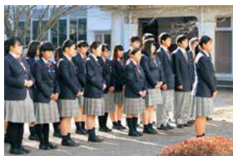
▲下さんによる決意のことば