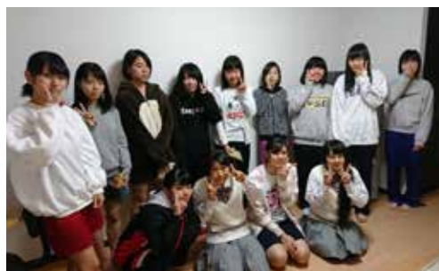
☆クリスマスの様子。皆でケーキを食べました☆