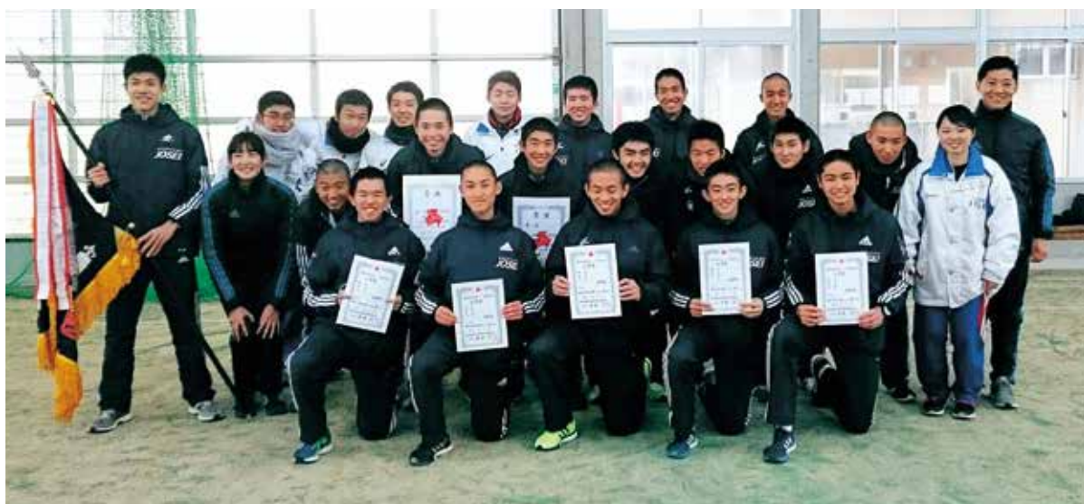
▲優勝旗を手に優勝スマイル