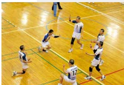
▲チーム一丸となって戦う