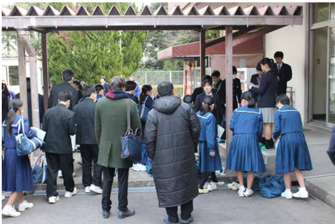
▲緊張の面持ちで受験会場に入っていく中学生と引率の先生方

また、入学試験には在校生も補助員として参加し活躍してくれました。特に調理科のクッキング部の生徒は中学校引率の先生方に美味しい料理を提供し感謝されました。