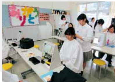
▲12月 サンクスプロジェクト