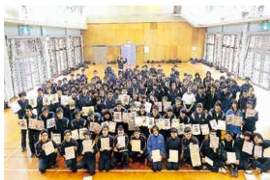
▲色紙をもらって感激ー全員集合