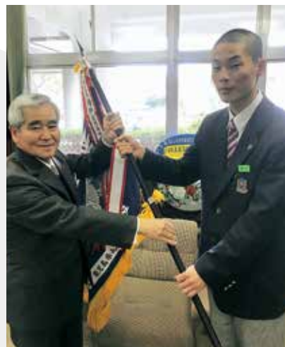
▲秋武校長へ優勝旗の授与