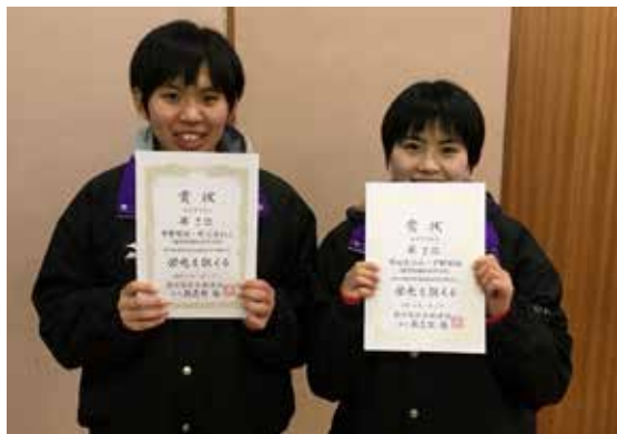
▲同じく2位の平野・中元組