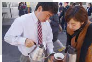
▲ 3年生の「Days Last Show ～デイズ ラスト ショー～」