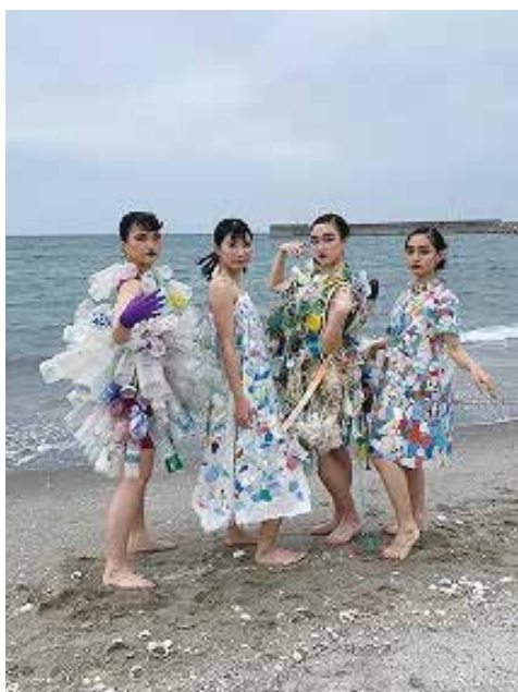
▲ 入来浜で衣装を披露しました