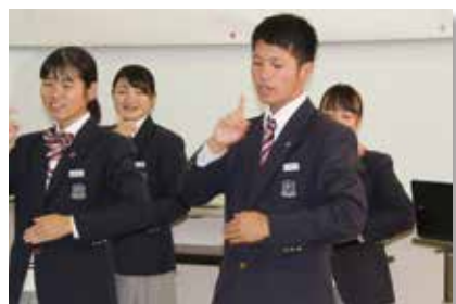
▲ 手話歌を披露しました