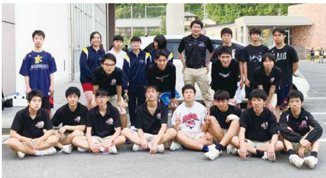
▲ 高校総体後の集合写真

今後もバスケットボールのスキル向上及び人としての成長，大会での目標達成をできるように頑張っていきたいと思います。