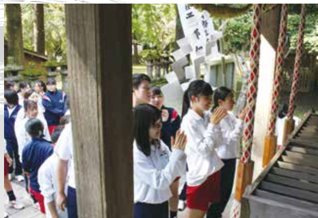
▲ クラスごとにお参りをしました