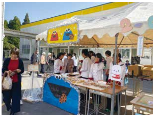
▲ 1年生「Splendid our Stage」

普通科パティシエコースは11月2日(土)に行われた文化祭でお菓子の販売を行いました。今までに授業で学んできたことを生かし、1年生がパウンドケーキ、2年生は焼きたてパン、3年生はチーズケーキなどを販売しました。どのクラスもたくさんの方にご購入していただき特に3年生の「Cordially」は販売開始30分前から行列ができ文化祭は大成功でした。また、生徒会主催のショップデザインコンテストでは2年生は準優勝、3年生は優勝をすることができました。