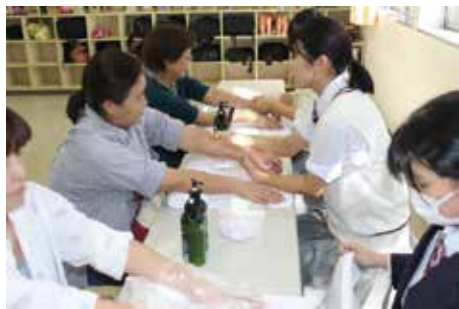
▲ 2年生によるハンドマッサージです。

去る11月2日(土), 2019年文化祭にて, 私たちトータルエステティック科は, 「ワンコインビューティーサロン」を開店し, エステ・ネイル・ボディジュエリーと3種類の「美」を提供しました。3年生は最後の文化祭ということで, 物品販売(チーズボール)も実施。1年生も負けじと「パンケーキ」を販売しました。エステも物品販売もたくさんのお客様がお越しになり, 大盛況でした。