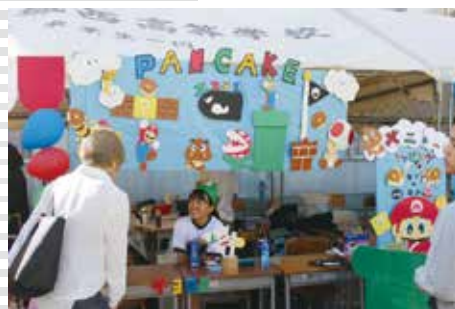
▲ 1年生, 笑顔が弾けています。