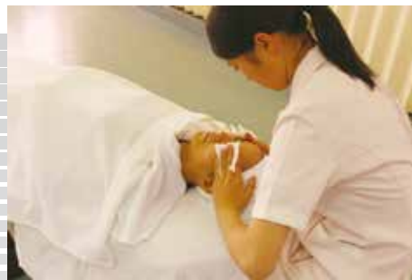
▲ 3年生によるエステ(フェイシャル)です。