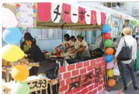
▲ 3年生, 一生懸命作っています。