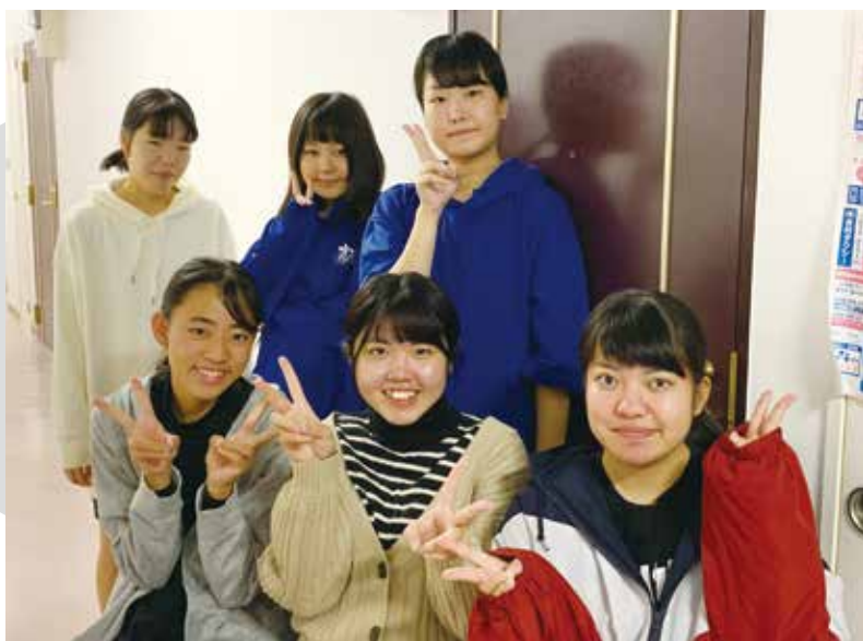
▲ サンライズマンションで過ごした3年生の仲間です。

いよいよ12月。まもなく2学期も終了します。サンライズマンションで生活する3年生にも退寮が近づいてきました。親元を離れて、学校生活はもちろん自炊など身の回りのことまでも自分自身でやってきた3年間、仲間との楽しい思い出もたくさんできたことでしょう。