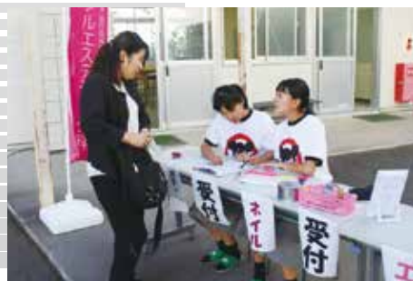
▲ 1年生, 受付頑張っています。