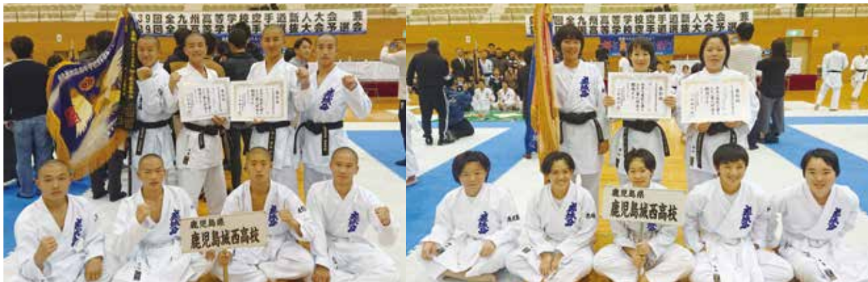
男女団体組手優勝

11月15日(金)～17日(日)、熊本県菊地市総合体育館にて、全九州高等学校空手道新人大会が行われました。本校空手道部は南九州ブロックに出場し、男女ともに団体組手、個人組手において優秀な成績を残しました。特に南九州ブロック男女団体組手優勝は平成12年以来19年ぶりの快挙となりました。