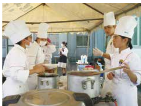
▲ カレーやチキンバーガーも販売!! たくさんの方が購入してくださいました。