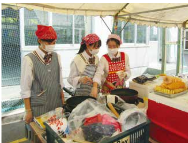
▲ フライドポテト販売 (1年生)