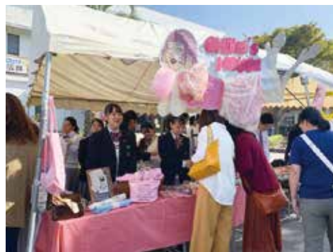
▲ 小物バザーの様子