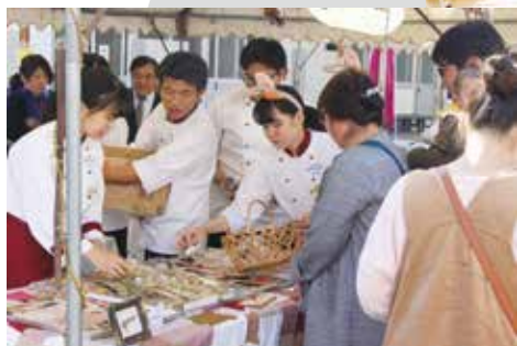
バザー・展示の様子