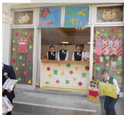
▲ ドリンクコーナーの様子