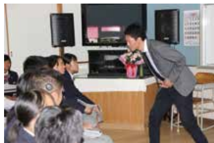
▲ 池田先生による講演