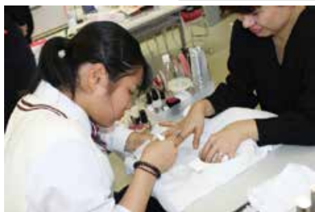
▲ 2年生によるネイルです。