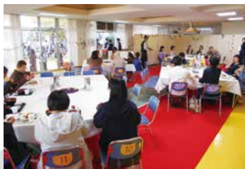
▲ 大繁盛のレストラン店内