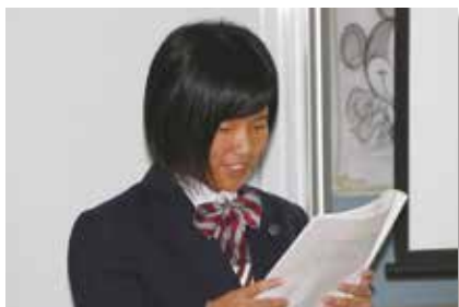
▲ パワーポイントを活用した発表

保護者は我が子の成長を実感する機会となり、生徒は自信に繋げることができました。この気持ちを大事に、今後も進路決定や国家試験受験に向かって取り組むことを期待したいです。