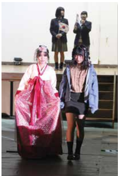
▲ ヘアメイクショー (3年生)

また,ヘアードザイン部では昨年同様,手作りのヘアアクセサリを販売しました。レースやリボン,ボタンなどを組み合わせ,おしゃれに作りました。慣れない作業でしたが,生徒たちは心を込めて一生懸命作っていました。