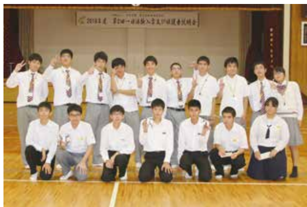
▲ 第2回体験入学 それぞれ熱心に取り組んだ中学生たち