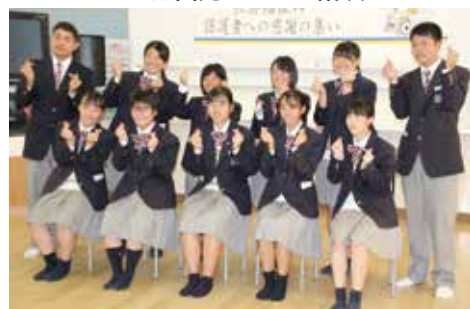
▲ 感謝の涙、でも最後はみんな笑顔でした