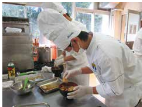
▲ 段取り良く作業し100食あっという間に完売しました。