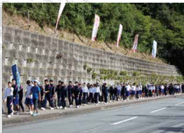
▲ 徳重神社にむけて行進中