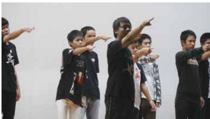
▲ 2年生によるダンス披露

また，ご来場いただいた保護者の皆様や地域の方々に，「上手だったね!」，「ごちそう様でした，おいしかったです。」など感謝の言葉やお褒めの言葉をいただいて，生徒たちもますますやる気に満ち溢れたことと思います。お忙しい中，ご来場いただいたたくさんの方々に対し，厚くお礼申し上げます。