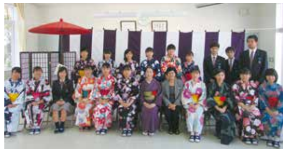
▲ 1・2年生の「さつま茶屋」