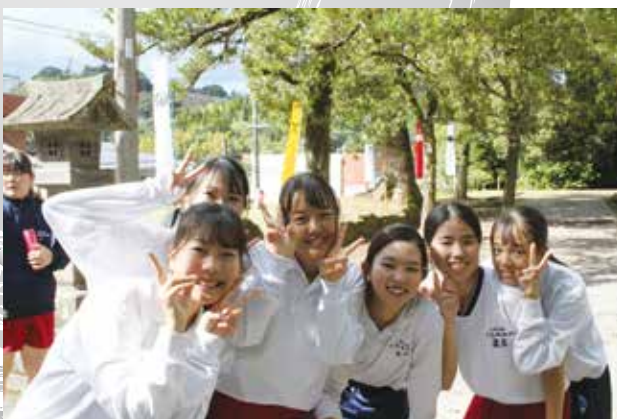
▲ 徳重神社に到着しました