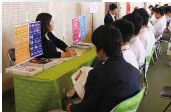
▲ 各校の説明を聞く生徒たち