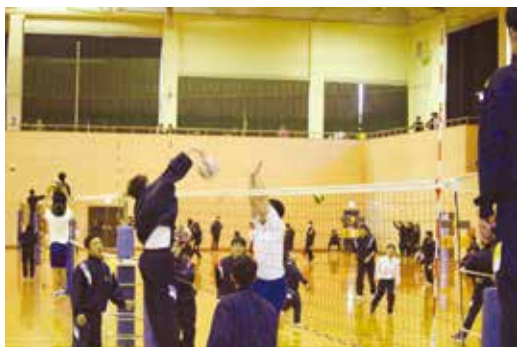
バレーボールの様子