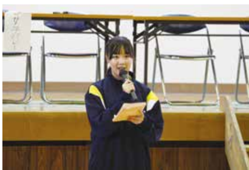
新生徒会役員としての初めての仕事です！

この経験をこれからの学校行事に生かし、学校全体がより一層盛り上がるように力を尽くしていきたいと思います。