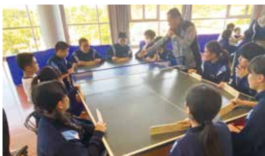
卓球バレーを初体験しました