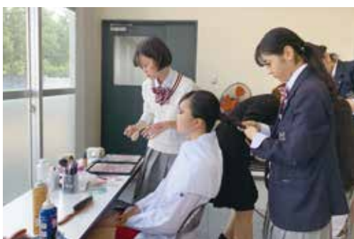
ファッションショーのお手伝い