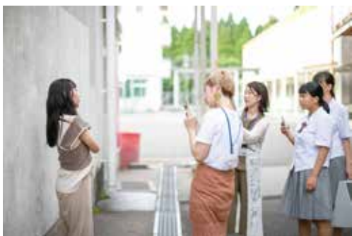
プロの美容師による撮影指導