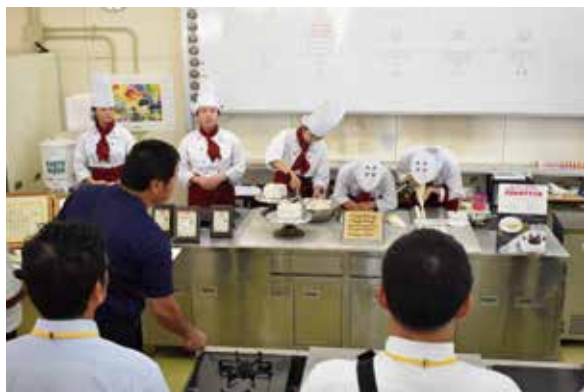
パティシエコース：実習実演

本校ではより多くの方々に本校の魅力を知ってもらうために、中学校の生徒やPTAの方々を対象に視察受け入れを行っております。校内を視察するときは、各学科の説明をすべて生徒が行い、日頃学んでいる専門技術を披露する学科・コースもあります。その案内説明の様子を一部ご紹介いたします。これからもより多くの方々のご来校を心から歓迎いたします。