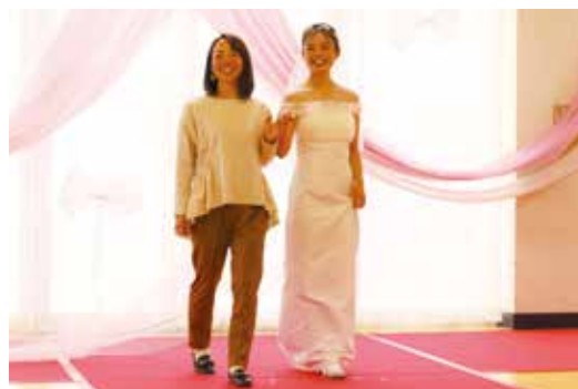
お母さんにエスコートしてもらいました