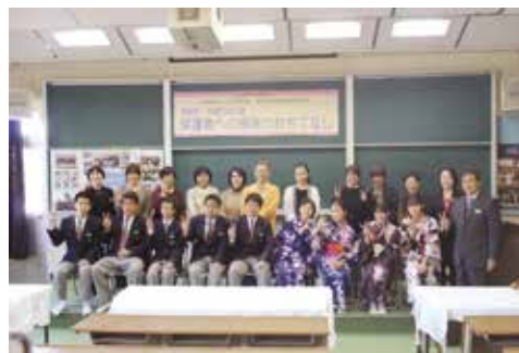
皆で一緒にピース