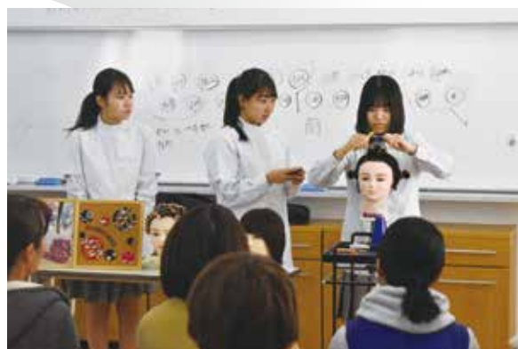
ヘアデザイン科：ワインディング