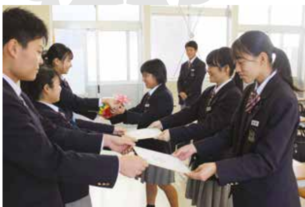
後輩から心を込めて思いを伝えました