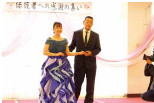
お父さんにエスコートしてもらいました

12月12日(木)、多目的集会室で保護者への感謝の集いを実施しました。これまでお世話になった感謝の気持ちを込めて、身近で卒業作品のファッションショーを見ていただき、保護者にエスコートをしていただく場面もありました。3年生は、感謝の気持ちを込めた保護者への手紙と手作りのウェディングベアを贈り、とても喜んでいただきました。また、1・2年生もそれぞれの役割を果たし3年生を盛り上げ、感動あふれる集いとなりました。