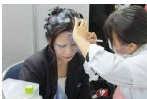
文化公演での様子