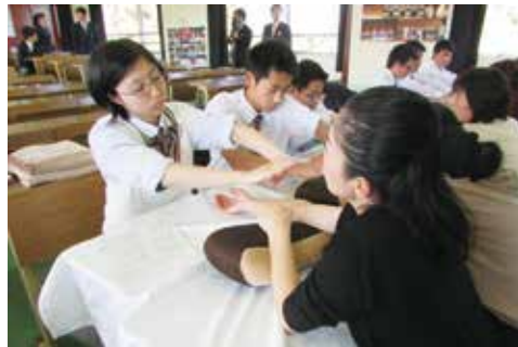
保護者へリラクゼーションの実演