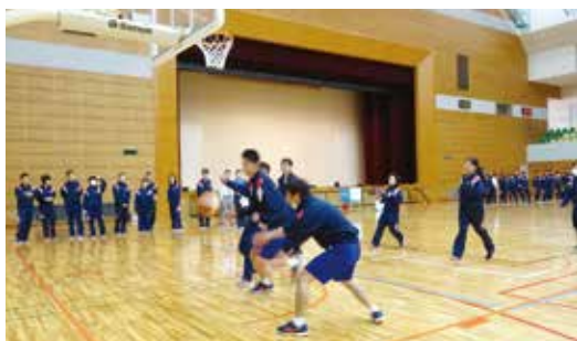
バスケット、激しく動きました