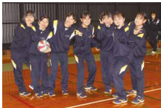
1年生は初めてのクラスマッチでした☆