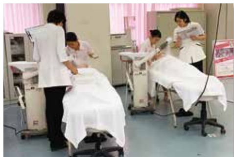
手を止めずに口頭試問に答えます！