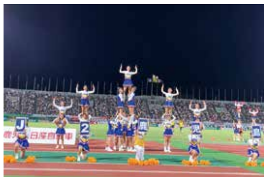
▲鹿児島ユナイテッドFCホームゲーム出演