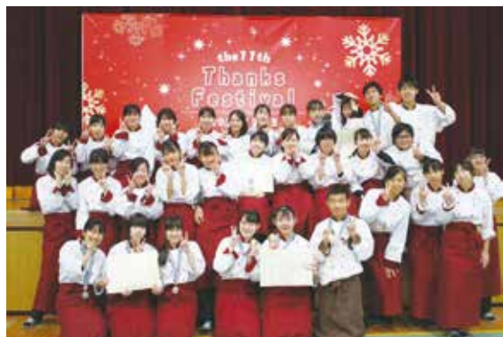
パティシエコース 行事を終えての集合写真

卒業を迎える3年生にとって、学習成果の発表を通して、保護者への感謝の気持ちを伝え、卒業後の飛躍を誓う素晴らしい行事となりました。当日は、お忙しい中ご出席いただき、ありがとうございました。