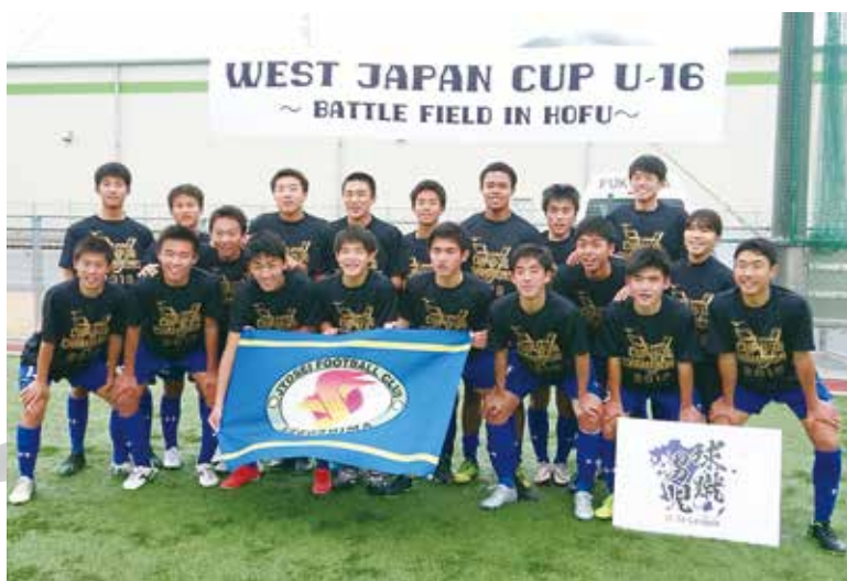
チャンピオンTシャツを身に付けて記念撮影