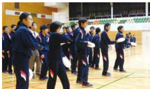
フライングディスク、上手く飛ばせました