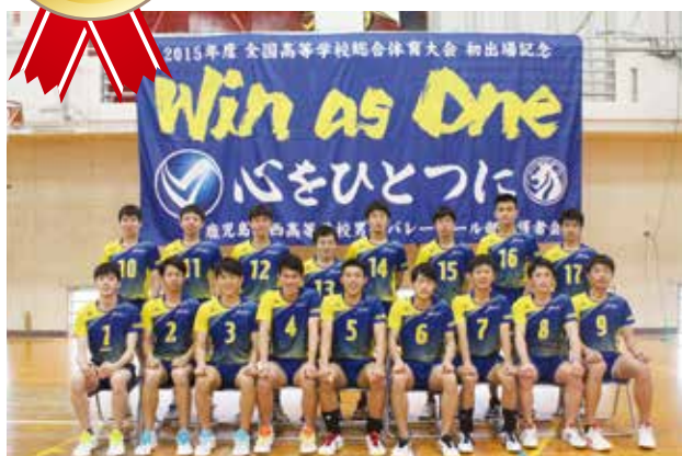
最高のプレーで頑張ってきます