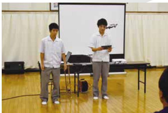
アプリケーションコース：ドローン飛行実演