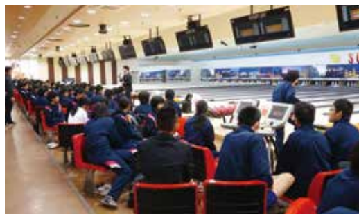
ルールを守って楽しめました