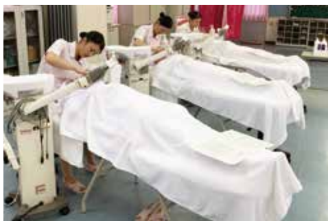
フェイシャル実技試験の様子です☆

実技試験を終えた3年生の感想を紹介します。16期生の全員合格！応援よろしくお願いいたします。