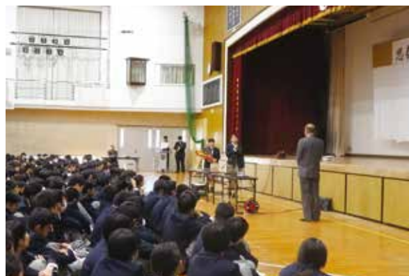
生徒会お礼の言葉