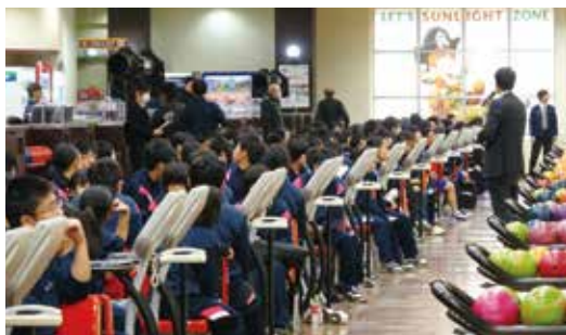
事前指導をしっかりと聞く生徒たち

普通科共生コース・福祉共生専攻科では、2019年12月19日(木)、20日(金)に、社会見学・スポーツ教室を実施しました。これは、校外活動や施設利用を通して、余暇活動に対する興味・関心を高めること、また、集団行動のなかでのルールやマナーの向上と、レクリエーションを通じた体力向上をねらいとしたものです。1日目は、科学館見学やボーリングを楽しみ、2日目は吉田文化体育センターにてニュースポーツ・レクリエーションを行い、有意義な時間を過ごすことができました。