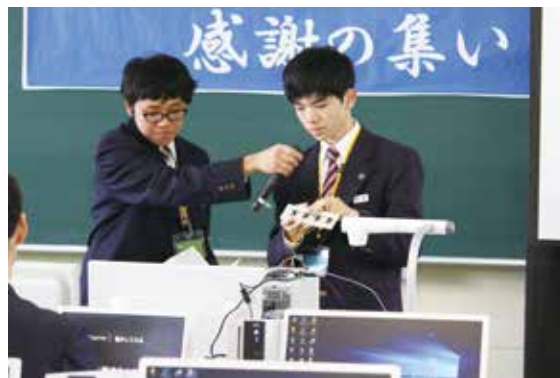
アプリケーションコース生徒による プレゼンテーションの様子