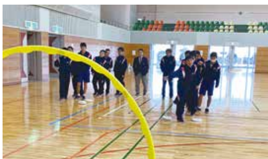
ディスク投げ、間を通すのは難しかったです