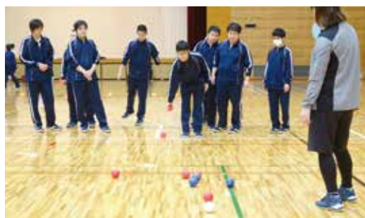
ポッチャも楽しめました