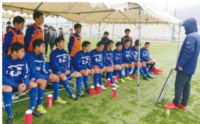
ベンチで指示を受ける選手たち