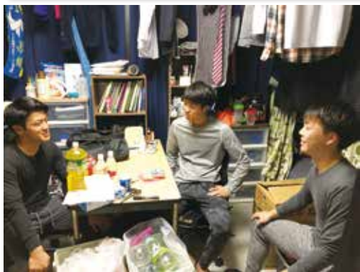
ビクトリー寮での様子