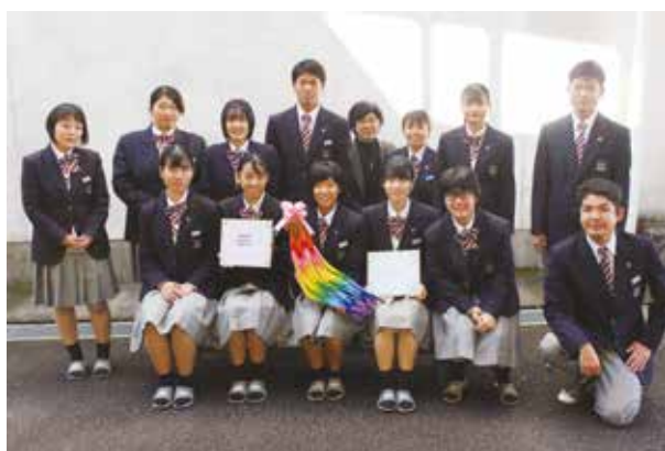
悔いの無い結果を祈ります