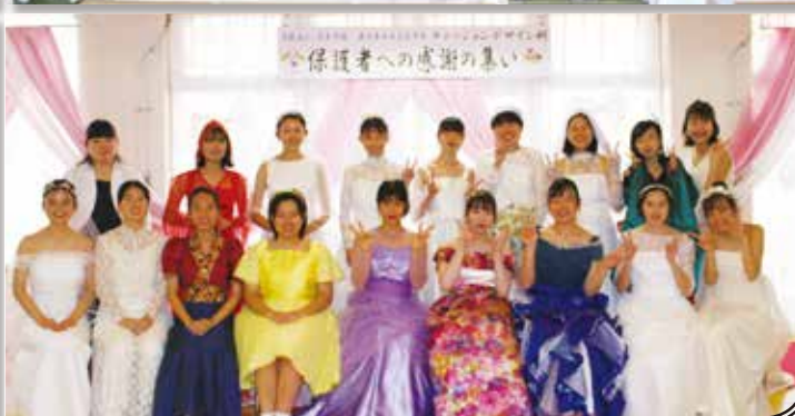
保護者への感謝の集い