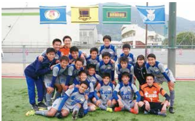
一丸となって、優勝を目指します！