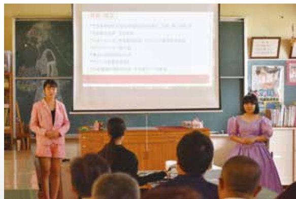
ファッションデザイン科：学科説明