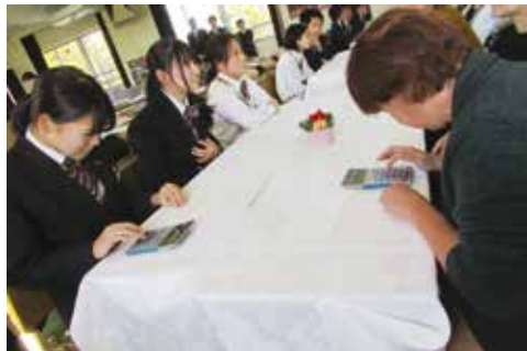
電卓早打ちリレー

12月12日(木)、3年生の保護者をお招きし、「感謝のおもてなし」と題して卒業記念行事を行いました。3年間の授業で学んだ「ワープロ」「電卓」「情報処理」「茶道」「リラクゼーション」「マジック」などの技術を披露し、これまで支えてくださった保護者へ感謝の気持ちを表しました。親子での電卓早打ちリレーや、茶道・マジック・パソコンの実演を行う子どもたちの成長した姿を見て、保護者の方々はとても嬉しそうでした。