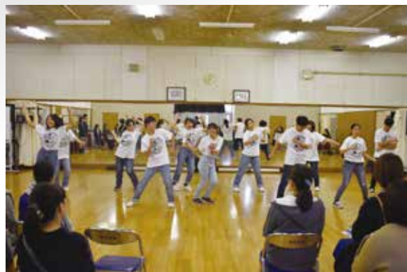
芸術文化コース：ダンスパフォーマンス披露