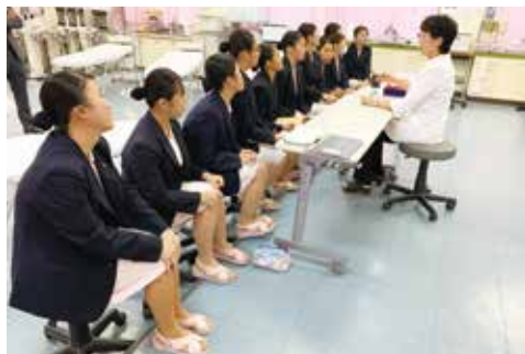
合格発表の様子です☆緊張しています！