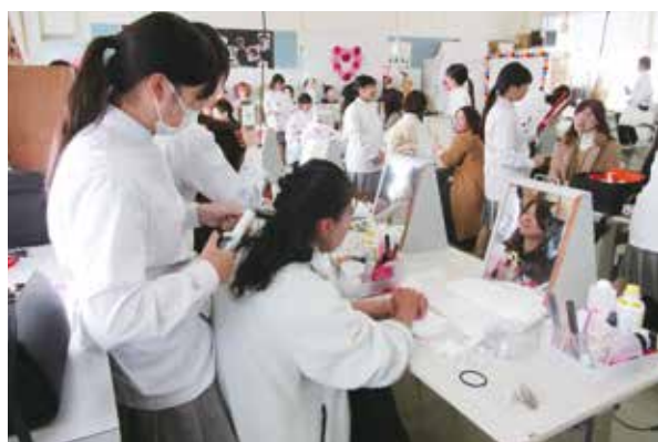
たくさんの保護者がお越しくださいました

3年生は2月初めに美容師国家試験の実技試験を、3月1日(日)に筆記試験を受験します。感謝の気持ちを忘れずに、合格に向けて頑張ってください。