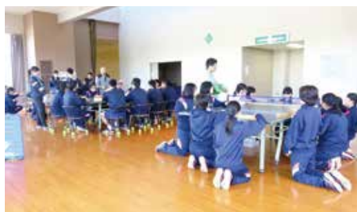
チームワークが深まりました