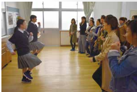
社会福祉科：介護体験運動