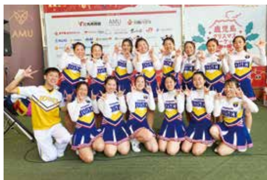
▲アミュプラザのクリスマスマーケット出演