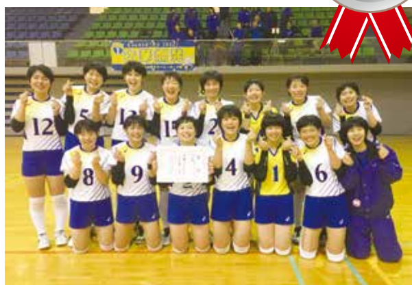
新人戦に向けて頑張ります