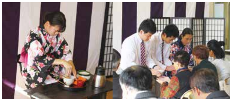
茶道のお点前披露