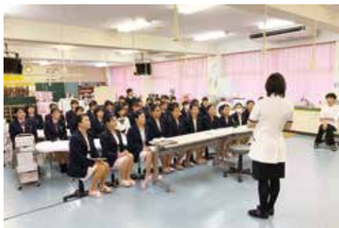
試験後、試験官からレクチャーを受けました！