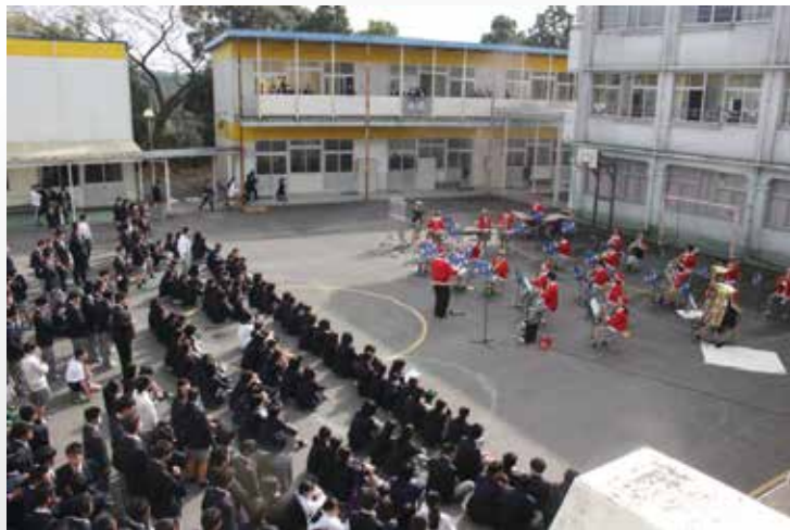
クリスマスコンサートの様子

12月17日(火), 吹奏楽部の皆さんがスリーオンコートでクリスマスコンサートを開催しました。曲目は、「ロマンスの神様」・「もろびとこぞりて」などのクリスマスソングメドレーを奏でました。中盤は先生方もサプライズで参加し, 全校生徒が盛り上がりました。