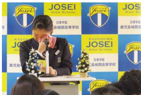
感極まり涙ぐむ生徒