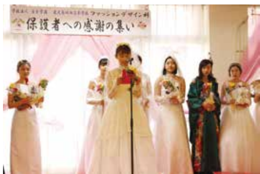
保護者へ感謝の手紙