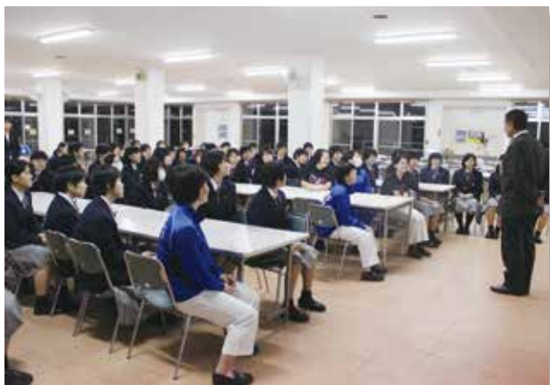
3年前の女子寮入寮式

この3年間，鹿児島城西高等学校や寮生活を通して学んだことをそれぞれの進路先で生かし，夢実現に向けて頑張ってください。ご卒業おめでとうございます。