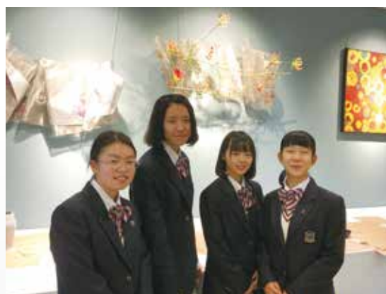
素敵な作品が展示できました