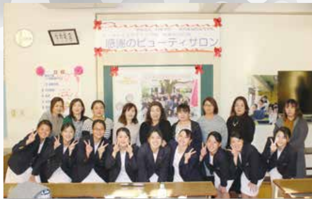
感謝のビューティーサロン