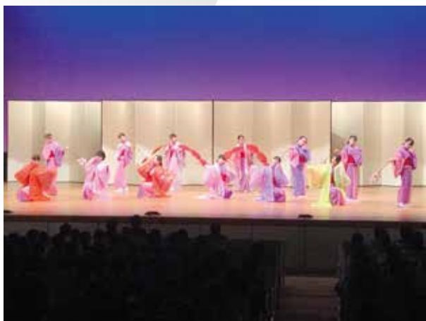
3年生女子日本舞踊