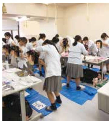
補習授業に取り組む生徒