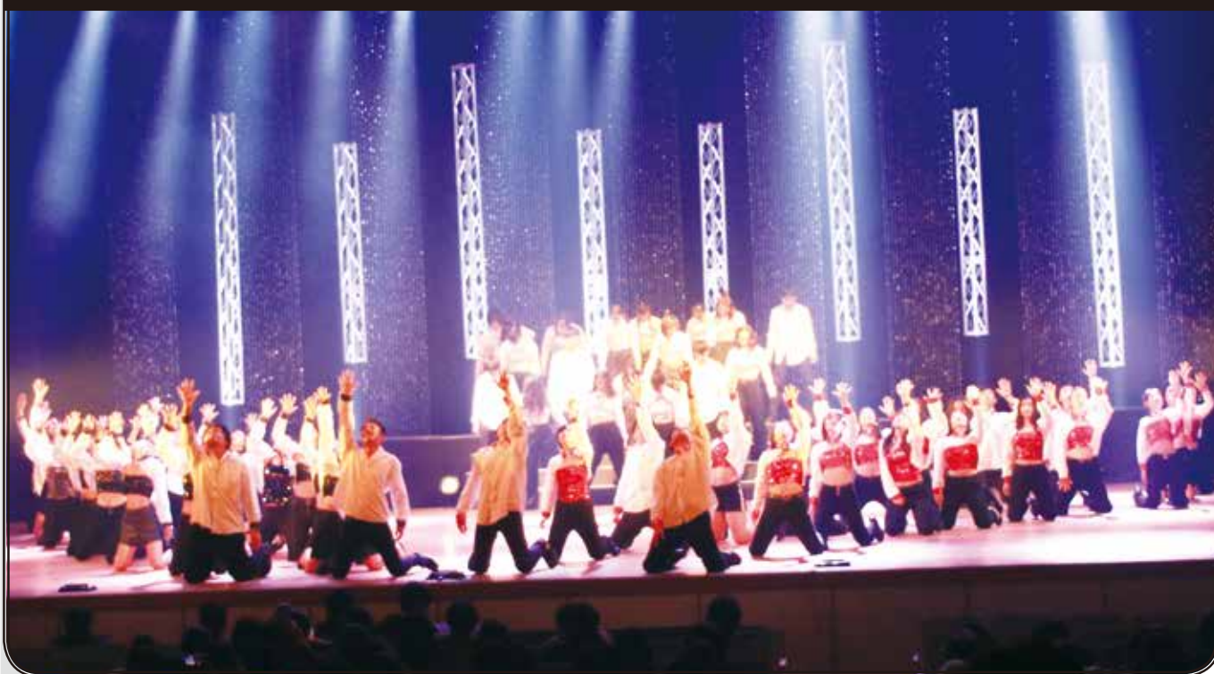
第21回芸術文化コース公演