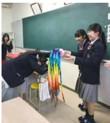
合格祈願で千羽鶴をもらう3年生

3月31日(火)の合格発表では全員が合格し、入学時の目標である美容師免許が取得できることを願っています。