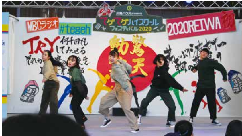
ステージでのダンスパフォーマンス（ハウスパート）

私たちダンス部は、全国大会入賞を目指して日々練習に取り組んでいます。大会出場以外にも学校で行われる行事や各地のイベントに参加するなどの活動をしています。部員の半数が高校からダンスを始めていますが、顧問の先生やコーチのご指導のもと、楽しくダンスをして、成長しています。今回は2月23日(日)アミュプラザ鹿児島島のAMU広場で行われた、「てげてげハイスクールフェスティバル2020」に参加した様子と部員の感想を紹介したいと思います。