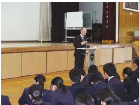
宮下進路指導部長からの話がありました