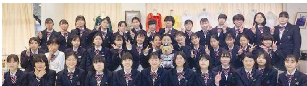
思い出の多い実習室で記念撮影

3年間学んだファッションに関する専門の知識や技術を今後も活かしてほしいと思います。一緒に過ごした仲間との友情をこれからも大切に、またお世話になった方々への感謝の気持ちを忘れずに、4月からは新しい目標に向かって頑張ってください。ファッションデザイン科在校生・職員一同、心から応援しています。