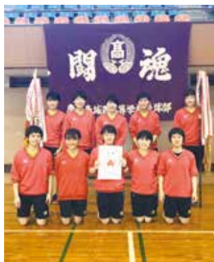
多人数での高校総体出場 卓球部