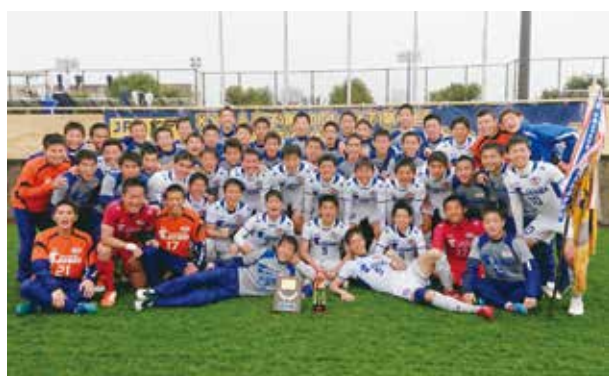
九州新人大会優勝8年ぶり2度目男子サッカー部