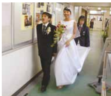
入場前…緊張の一瞬

企画から進行、衣装、内装装飾、席図表など全て生徒が手作りで仕上げ、大成功のイベントとなりました。