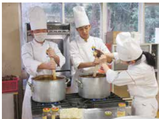
カレーの仕込み中

令和2年度の入学試験が1月25日(土)に実施されました。調理科では引率された中学校の先生方へ昼食提供としてバイキング料理でおもてなしをしました。料理に携わった生徒たちは久しぶりに中学校の先生方とも再会し、成長した姿を見せることができ、また先生方も教え子たちの作った料理で心もお腹も満たされた様子でした。