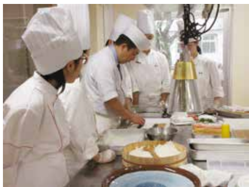
手巻き寿司の巻き方を先生に教わりながら