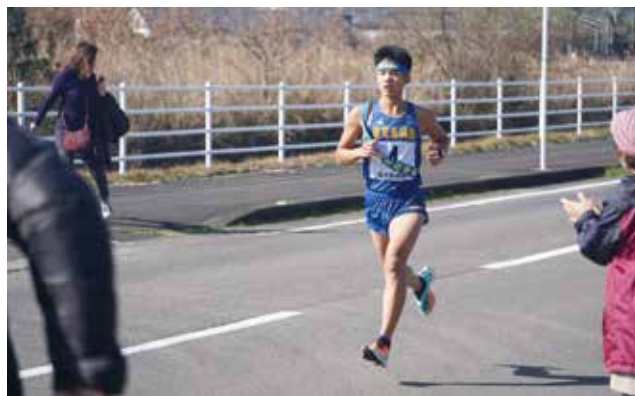
快走する2区の中田くん