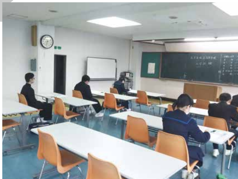
西之表会場では6名が受験しました（於 西之表市産業会館）

本校推薦入試・共生コース・ドリームコースの入学試験が1月17日(金)、一般入学試験は1月25日(土)それぞれ本校を中心に県内の各会場で実施されました。入学試験の実施にあたってはたくさんの本校の生徒たちが補助員として受験生の案内係・誘導係・接待係として手伝いをしてくれました。補助員の素晴らしい活躍により、無事に入学試験を終了することができました。本当にありがとうございました。