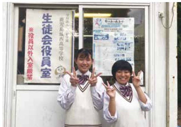
生徒会活動も頑張りました！