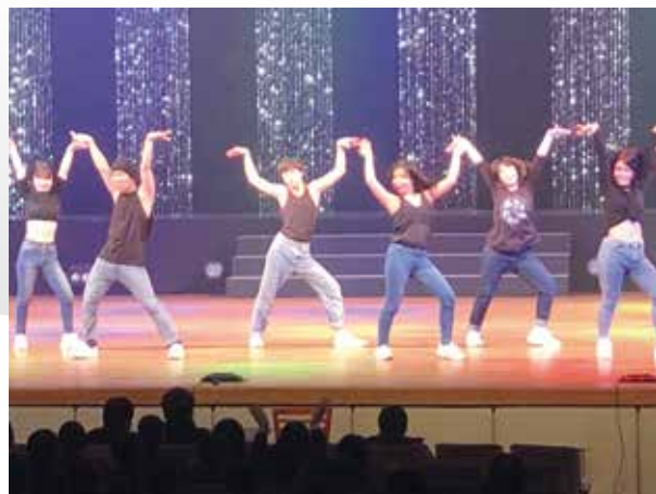
3年生エアロビクス