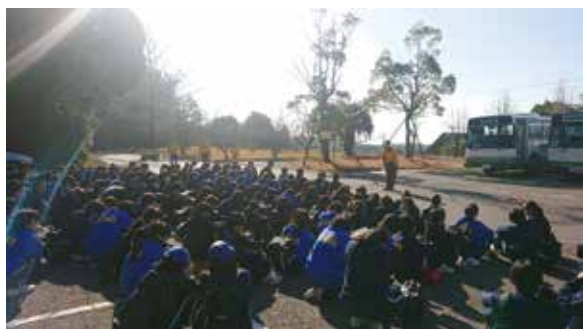
少年自然の家にて