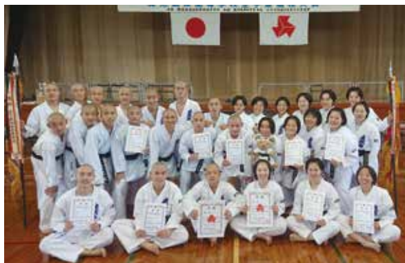
鹿児島県高校総体アベック優勝 男女空手道