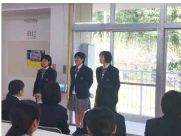
寮長・副寮長として女子寮をまとめました！