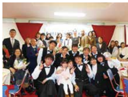
笑顔と感動で大成功!!