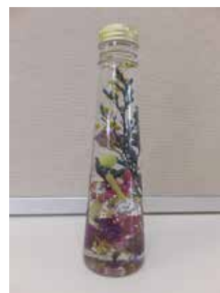
作品（ハーバリウム）