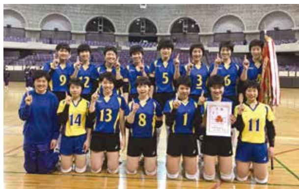
26年ぶり4回目県新人大会優勝 女子バレー部