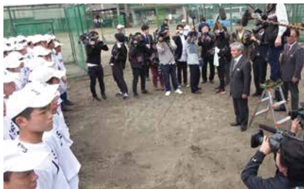
▲グラウンドで待つ選手に吉報を届ける瞬間