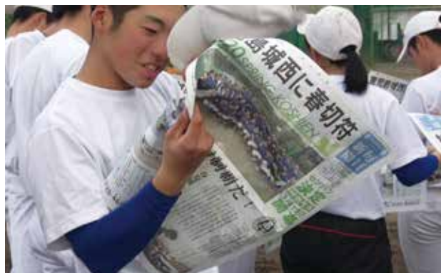
▲号外毎日新聞に目を通す選手たち