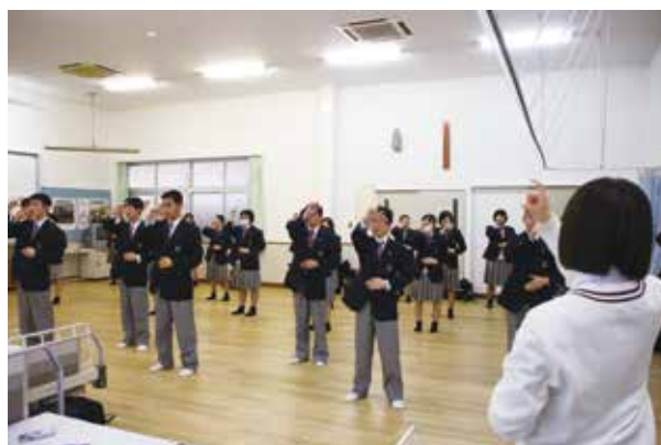
2年生を中心に指導にも熱が入ります