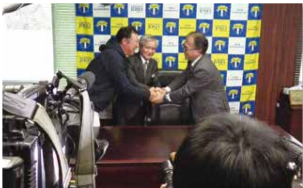
▲吉報に握手を交わす校長，教頭，監督