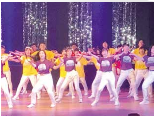
全学年合同エアロビクス