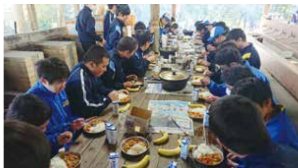
野外炊飯でカレーを作りました