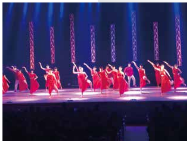
2年生J A Z Z