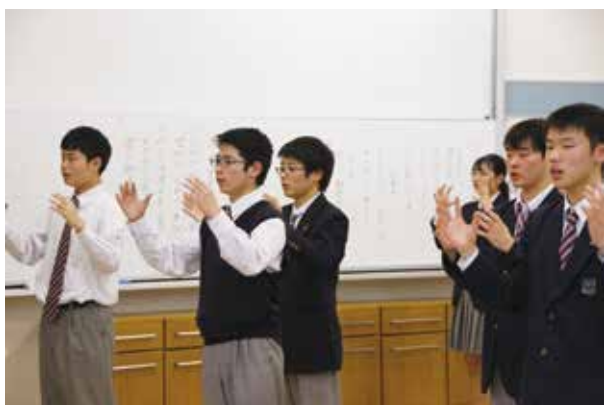
1年生も一生懸命に取り組みました

頼れる3年生が卒業し、大きな支えを失いますが、新年度スタートに向けて生徒一人一人の更なる成長や飛躍に期待を寄せます。