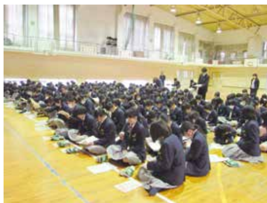
真剣に話を聞いていました