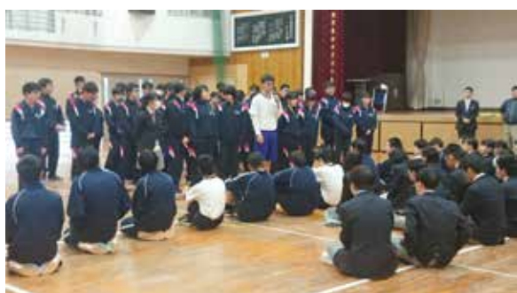
3年生からお別れのことは