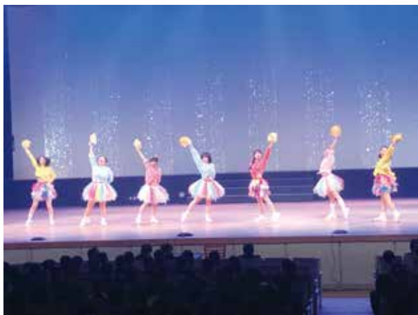
鮮やかな衣装でのダンス

令和2年2月15日(土) 伊集院文化会館にて普通科芸術文化コースによるコース公演が行われました。たくさんのお客様に、ご来場頂きスタッフ一同本当に感謝しております。出演した生徒はこれまでの練習の成果を披露し、公演を通してたくさんの感謝を伝えることができたと思います。