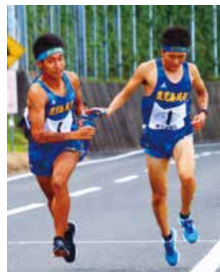
都大路出場 駅伝部