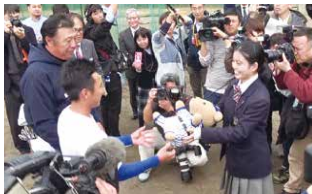
▲サプライズプレゼント 愛ちゃんぬいぐるみ