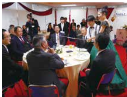
キャンドルサービスの様子