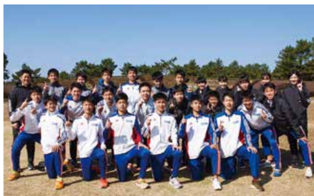
駅伝部の集合写真