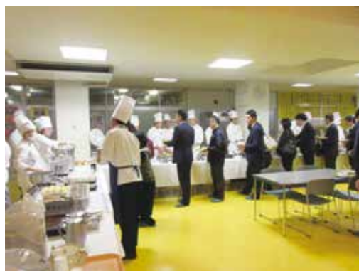
たくさんの中学校の先生方が食べに来てくださいました