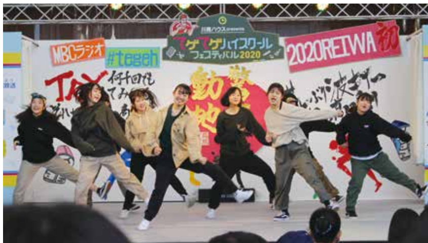
ステージでのダンスパフォーマンス（ヒップホップハウスパート）