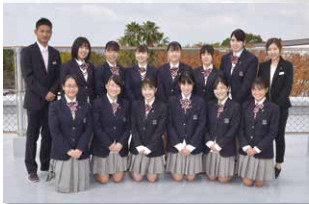
16期生☆これからの活躍が楽しみです