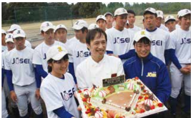
▲サプライズプレゼント 祝ケーキ