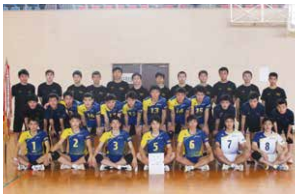
県新人大会 九州総合選手権 優勝男子バレー部