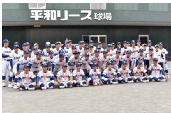
NHK杯51年ぶり2回目優勝 野球部

3年生の活躍は鹿児島城西高等学校スポーツの伝統を守り、新たな歴史を刻んでくれました。3年間本当にありがとうございました。皆さんの今後の活躍を心から楽しみにしています。