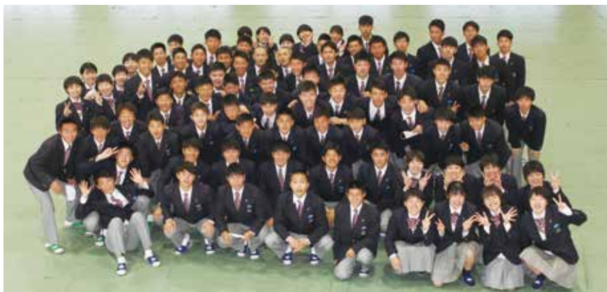
ようこそ、進学体育科へ 皆さんの入学を待っていました

本気で日本一を目指すアスリートの皆さん、ようこそ進学体育科へ。ご入学おめでとうございます。約150名の先輩方が皆さんの入学・入部を楽しみに待っていました。これから三年間を大切に、大きな志を持って高校生活を送ってください。