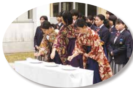
伝統行事の針供養