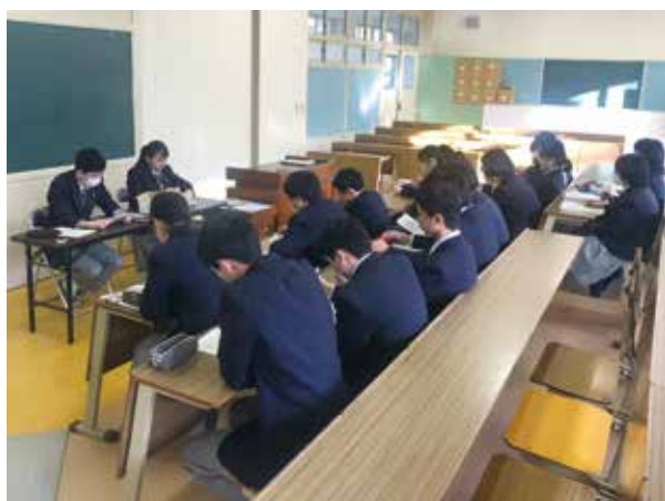
▲ 生徒会リーダー研修会全体の様子

また、これからの行事やボランティア活動等で「生徒会の役員に手伝ってもらってよかった」と思ってもらえるような活動をするにはもちろん、まずは私たち生徒会役員自身が最大限に納得できるような活動内容を展開していけるように、様々な工夫を凝らし、努めていきたいと思います。保護者の方々や地域の皆様にご迷惑をお掛けすることのないように、精一杯頑張りますので何卒よろしくお願いいたします。