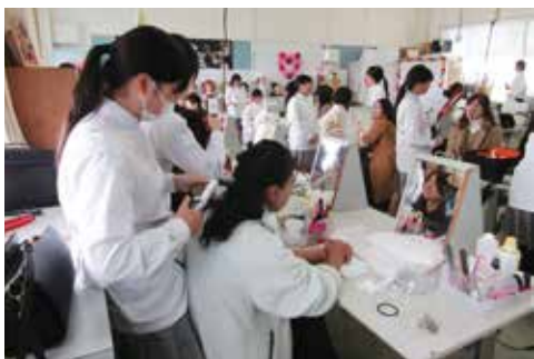
卒業記念行事（感謝のヘアサロン）