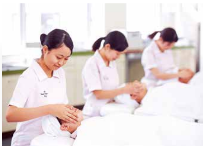
難しい技術も練習を重ねます

その他にもボディジュエリーやネイルチップの作品制作、対外的なボランティア活動にも取り組み、トータルで技術や知識の習得に励んでいます。