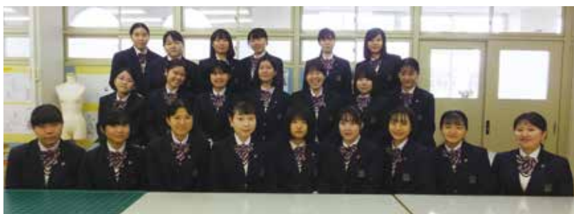
新入生の皆さん、ようこそファッションデザイン科へ（2・3年生の集合写真）