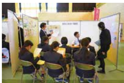
それぞれのブースで企業の説明を熱心に聞いている生徒たち