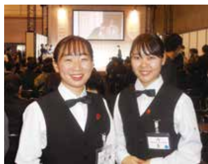
出場を終え、ホッとしました。