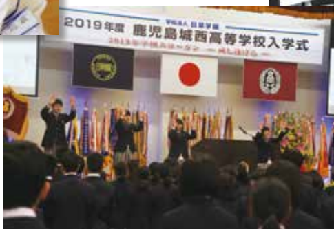
入学式での手話披露