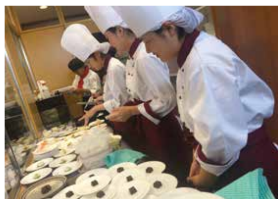
「マグロの料理・スイーツコンテスト」