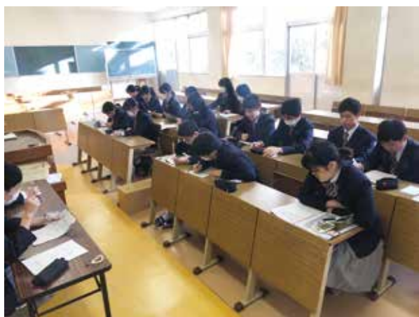
▲ 真剣な表情で取り組んでいます