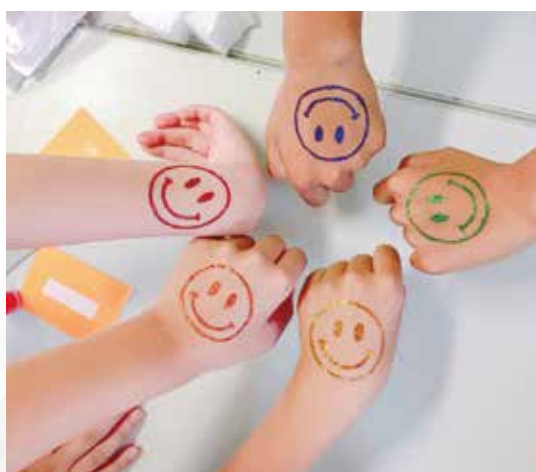
みんなでボディジュエリー