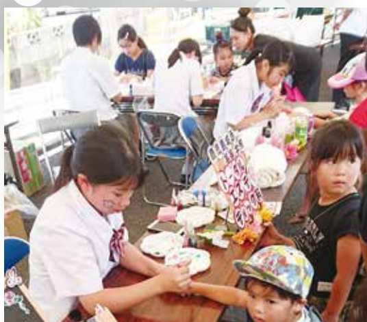
ボランティア活動に参加