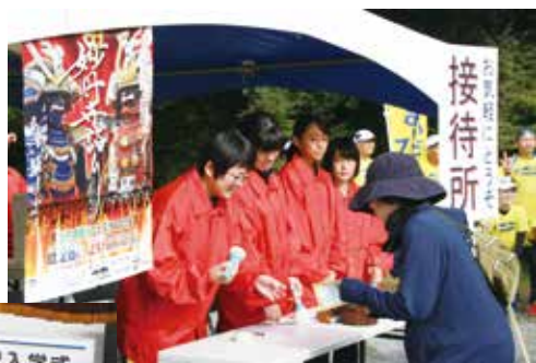
妙円寺詣りボランティア