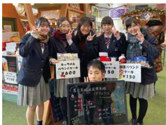
「クリスマスマーケット」