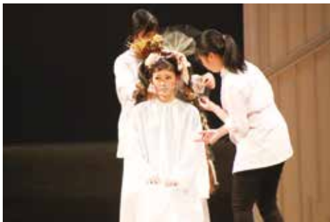
文化公演でのヘアショー

新入生の皆さんは、全員で励まし合い、時には競い合いながら、美容師免許取得という同じ夢に向かって成長してくれることを期待しています。