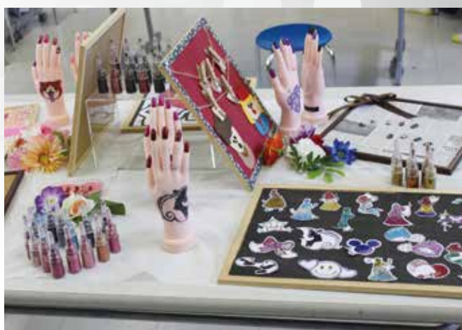
様々な作品を作ります