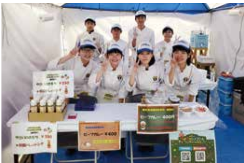
一日お疲れ様でした!!