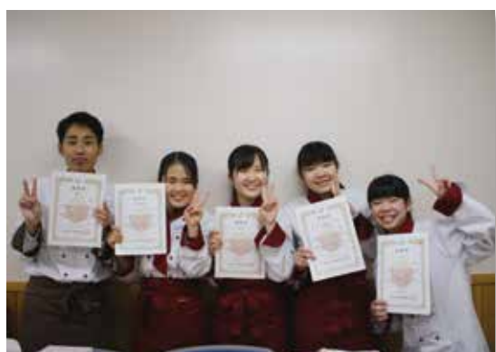
「いちごのスイーツコンテスト」