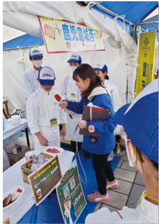
ラジオのインタビューの様子