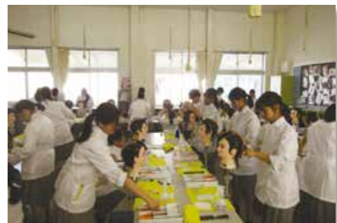
授業風景（ワインディング）