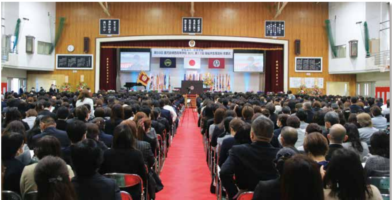
多くの保護者の方々に参加いただきました