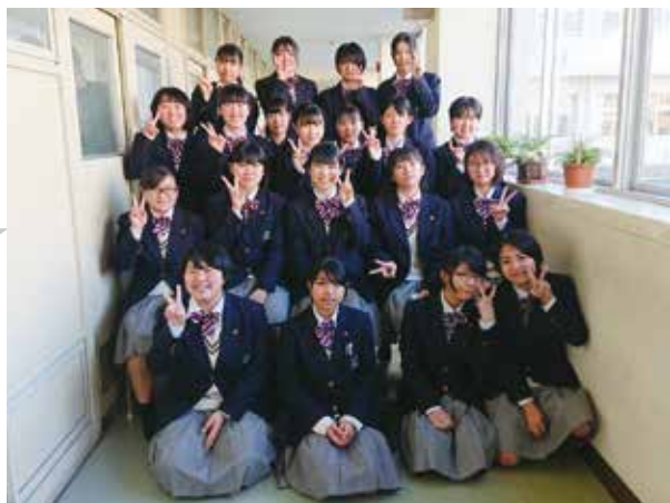
ようこそ、サンライズ寮へ 私たちが待ってます

3月に先輩方が退寮され、寂しく感じていたサンライズ寮にもいよいよ新入生が入寮してきます。個々の空間を大切にしながらも同じ寮に住む仲間として、楽しく支え合っていける関係を作り上げたいと思います。