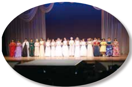
感動いっぱいのファッションショー