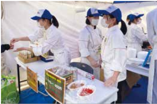
オリジナルビーフカレー販売

調理科クッキング部は「オリジナルビーフカレー」を販売しました。多くの方々が買いに来てくださり、「美味しかったよ」「頑張ってたね」などの優しい声かけで部員の生徒たちも笑顔で楽しく販売することができました。