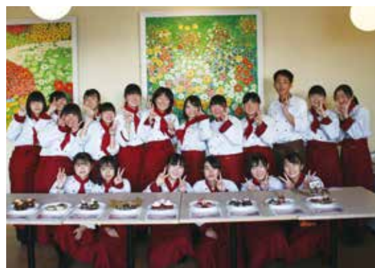
「バレンタインスイーツコンテスト」