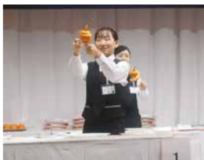
笑顔で頑張りました。

予選は20問の筆記試験とオレンジのカット(6分以内)。準決勝(6位まで)は、白ワインのサービスと、シーザーサラダのサービス。決勝(上位3名)は、シャンパンのサービスとローストチキンのサービスで競われました。結果は、残念ながら6位入賞に届かず予選敗退でしたが、高校生が出場していることが話題となり、観客に印象を残すことができました。以下に出場した生徒の感想を紹介します。