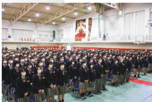
学園歌・校歌斉唱