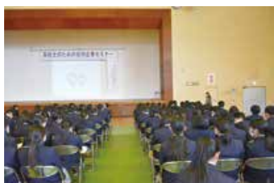
就職についての講話

9月16日(水)に高校生の就職試験が開始されます。早めにしっかりと進路について考え、志望先決定に向けて取り組んでほしいものです。