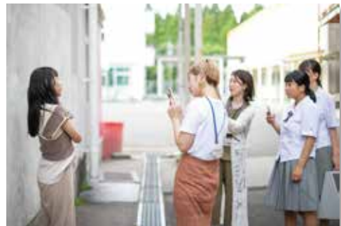
プロの美容師による撮影指導