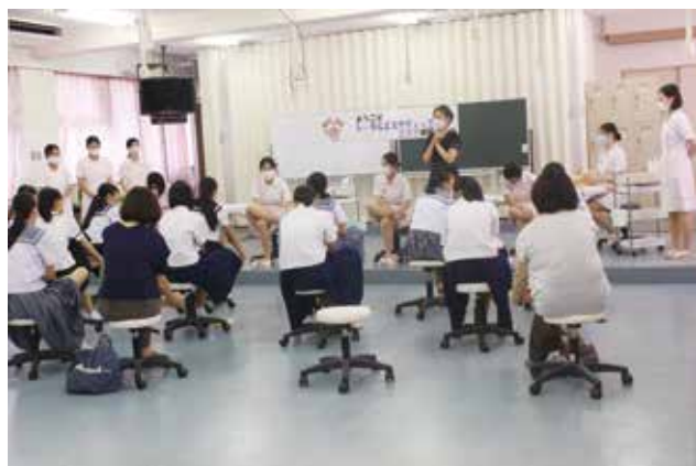
自宅でできるフットマッサージを伝授♪