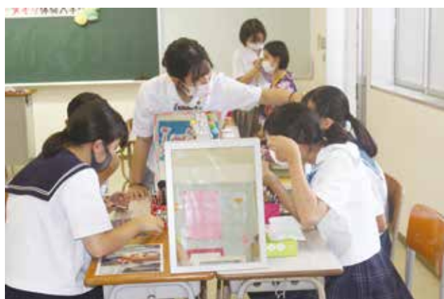
アイメイクの実践！上手にできました♪