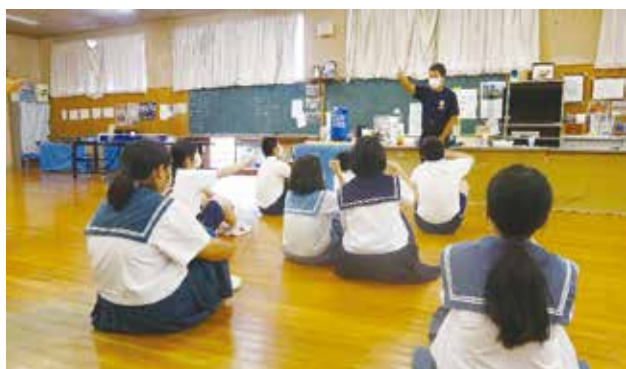
アイスブレーキング中（後出しじゃんけん大会）