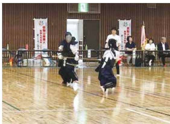
激しいせめぎ合い