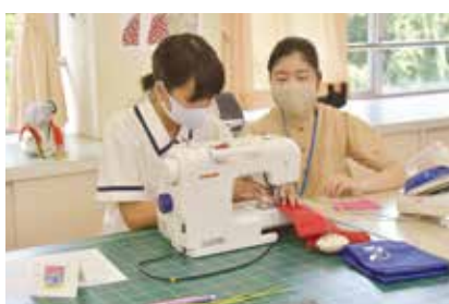
▲ファッションデザイン科