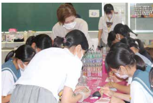
手鏡にボディジュエリーを施しています☆