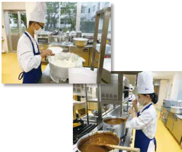
～大きな釜と、鍋で調理をしています～

本校の一日体験入学では、調理科とパティシエコースがおいしい軽食を提供しました。調理科ではクッキング部の生徒がフランクフルト・焼きそば・カレーを作りました。たくさんの中学生や保護者の方に喜んでいただけて、本校生徒も良い経験ができました！以下に、作っている様子と生徒の感想を紹介します。