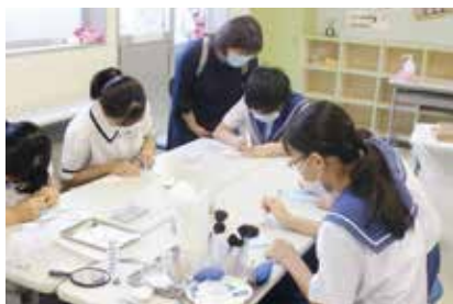
▲トータルエステティック科