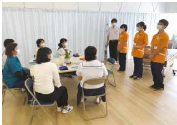
学科の説明と補助生徒の紹介

夏季休業中の貴重な時間のなか、大切な進路選択の判断をするため参加した中学生の皆さんに心からエールを送るとともに、是非社会福祉科に入学していただき、未来の社会福祉のプロフェッショナルを目指してほしいと思うことでした。