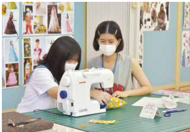
ミシンの操作をいちから丁寧に教えました

今回の体験学習を通して、ファッションデザイン科は“自分で考えたデザインを形にする楽しさや喜びを味わえる学科”だということを知っていただけたのではないかと思います。