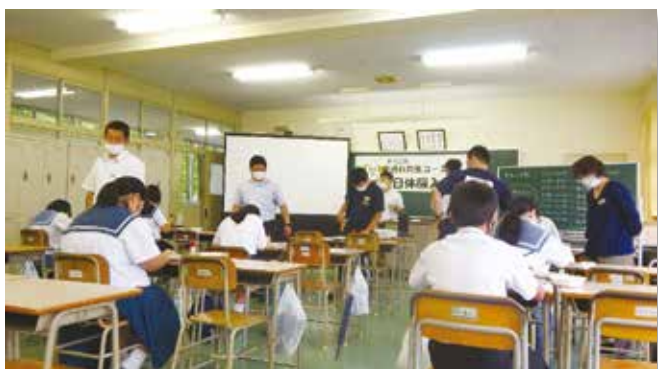
職員と補助生徒が一人一人丁寧に教えました！

中学生の皆様・保護者の皆様におかれましては、新型コロナウイルス感染拡大防止策としての分散による体験入学の実施でしたが、大勢の参加をしていただきました。また、手指消毒や手洗いうがいのご協力をいただきまして、誠にありがとうございました。