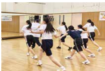
▲普通科 芸術文化コース