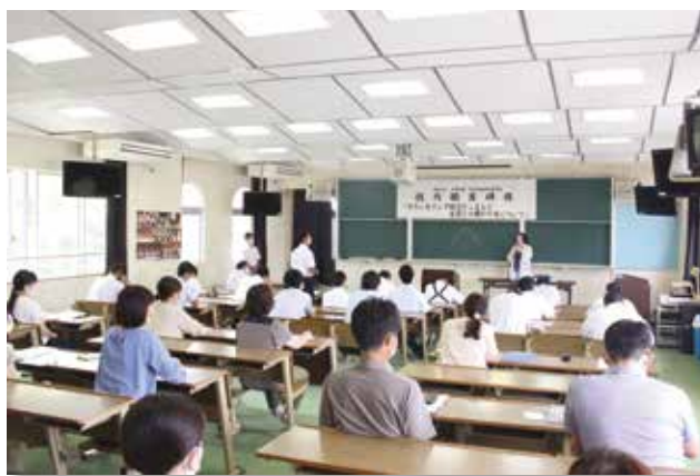
熱心に耳を傾ける先生方