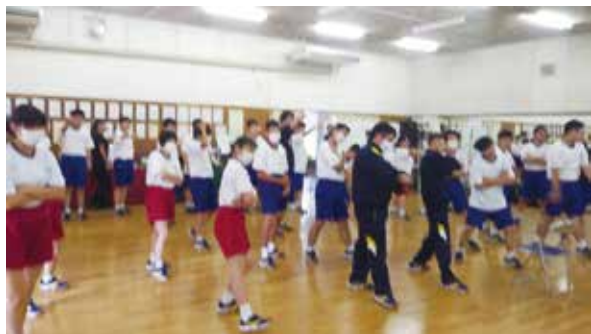
最後は決めポーズで！