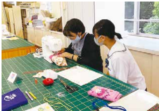
手伝いをする中で、自分自身も学びました