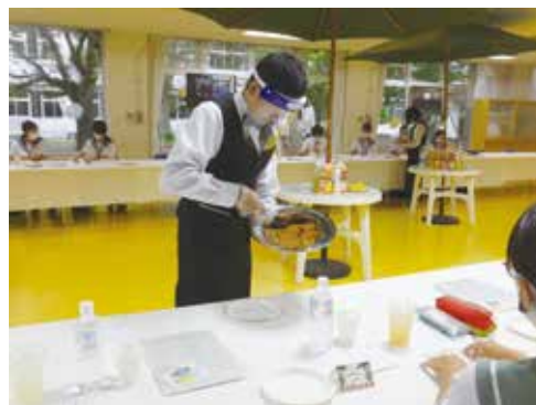
「新しいサービス様式」でのサービス風景