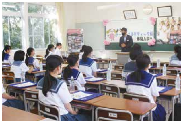
学科長による学科説明の様子です！

8月5日(水)から8月7日(金), 8月25日(火)から8月27日(木)の計6日間, 本年度1回目の一日体験入学が実施されました。トータルエステティック科では県内各地から200名近くの中学生在が参加してくださいました。授業で行うエステ・メイク・ネイル・ボディジュエリーを, 現役のプロから学び, 普段できない美の体験をしました。フットマッサージや韓国メイク・浴衣メイク, 手鏡作製など, 短い時間の中で盛りだくさんの体験をし, 参加した中学生は充実した楽しい時間を過ごせたとても喜んでいました。