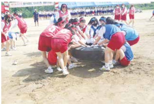
2年 マッスルウーマン