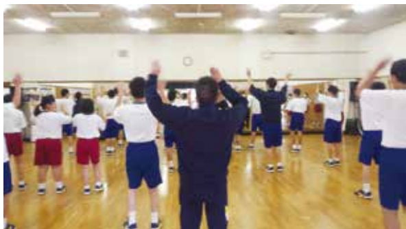
振付を覚えている最中です！

11月の文化祭で発表されますので、私たち職員も楽しみにしています。また、本校特設Instagramなどでも、ダンス映像などお届けできたらと考えておりますので、そちらの方もチェックいただけると幸いです。