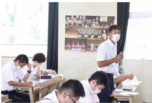
カウンセリングについて質問も多数ありました