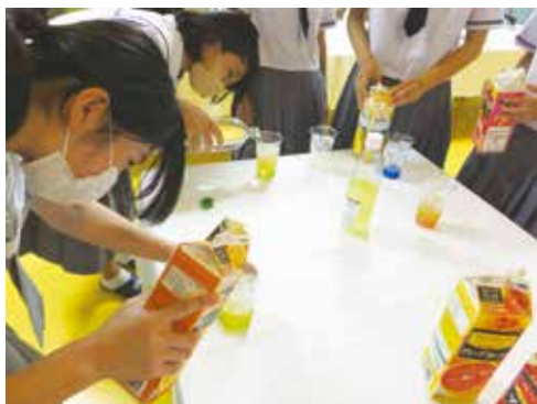
オリジナルカクテルの作製体験