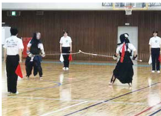
相手の隙をうかがいます