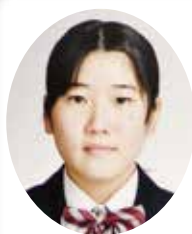
普通科2年A組 進学・公務員コース