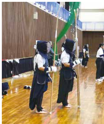
試合の順番を待ちます