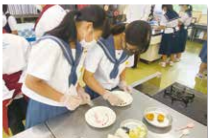
▲普通科 パティシエコース