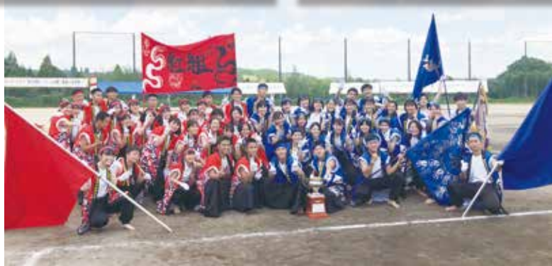
最後は、仲間とともに