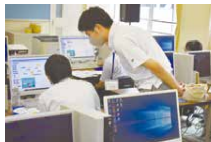
▲普通科 アプリケーションコース