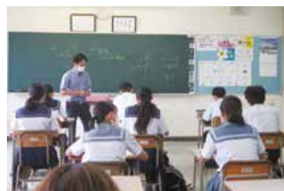
▲普通科 進学・公務員コース