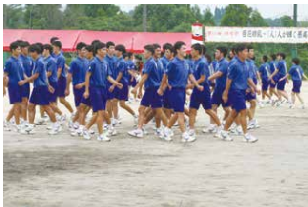
3年 進学体育科による集団行動