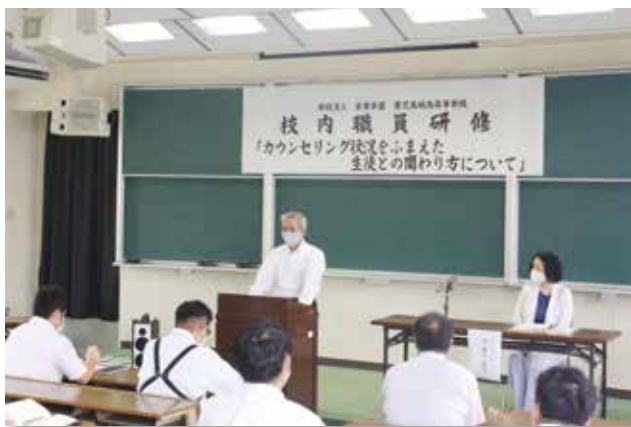
校長先生によるあいさつ及び講師の紹介

今回の研修を活かし、全職員が生徒一人一人に寄り添いより良い指導ができるよう努めていきたいと思います。