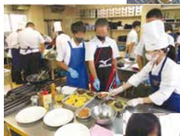
中学生に教える クッキング部