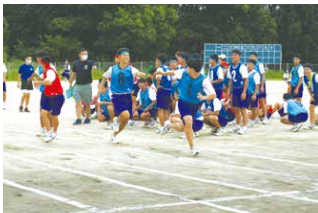
3年 アスリートリレー