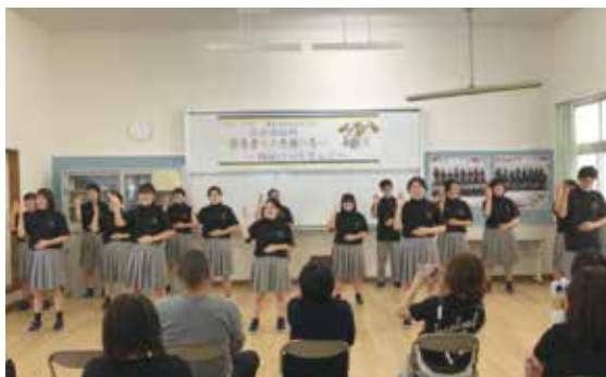
wacciの大丈夫を手話歌で披露