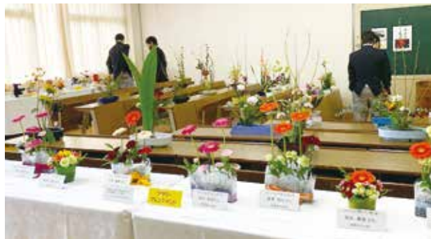
生け花やフラワーアレンジメントを展示