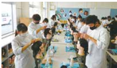
本番さながらの実習

生徒、職員が心を一つにして取り組み、全員合格できるように精進してきたいと思います。