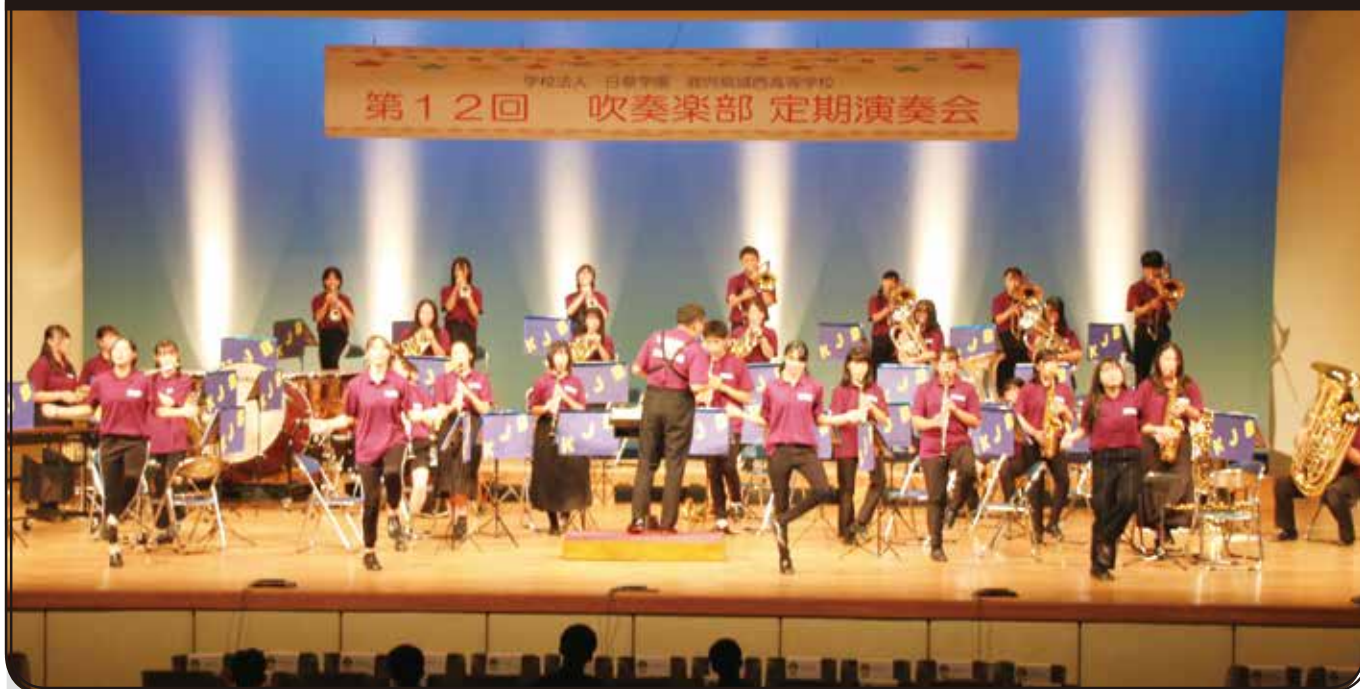
第12回吹奏楽部定期演奏会