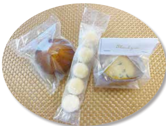
文化祭で製作したスイーツ

高校生で初めての文化祭で文化委員を務めました。初めての体験で不安だったのですが、先輩方が優しく教えてくださり無事成功することができました。今年は、コロナウィルスの影響で販売ではなく、予約制だったので忙しいことはあまりありませんでしたが、来年販売になったときに慌ててしまわないよう今回の経験と先輩方から教わったことをしっかりと活かして来年も最高の文化祭にしたいです。