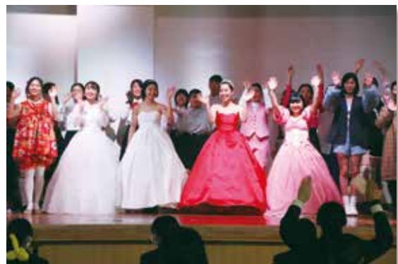
ファッションデザインコースの発表