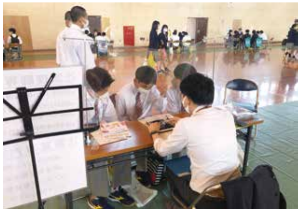
自分の進路に向けて真剣です

各ブースに分かれて、興味のある大学、専門学校のお話を聞くことによって、自分の将来やりたいことや、様々な職種があることを生徒一人一人が理解でき、とても充実した時間となりました。