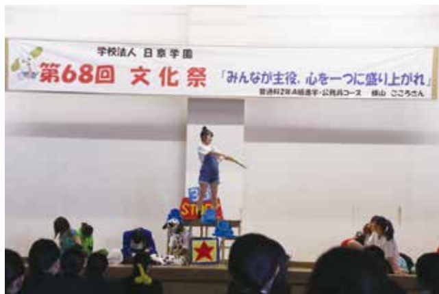
自分達で考えて発表しました