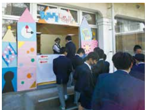
行列ができたドリンク販売