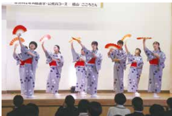
芸術文化コースによる「日本舞踊」