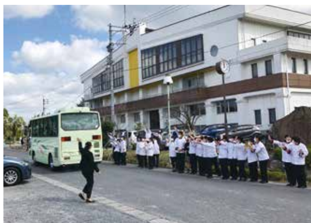
最後は皆でおみおくり