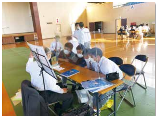
充実した時間でした