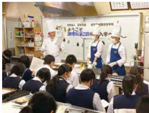
～第二調理室での示範～