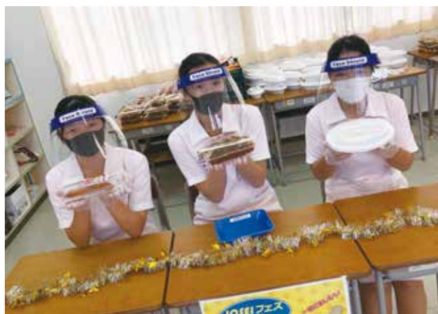
昼食はいかがですか？