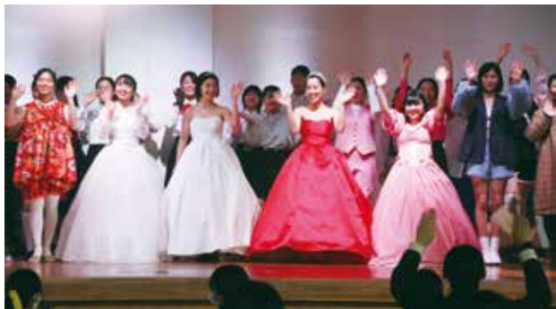
楽しくファッションショーをしました

11月3日(火)に文化祭が実施され、学科展示とファッションショーを発表しました。展示会場では、生け花やぬいぐるみなどを展示、体育館では1年生から3年生まで、自分が制作した作品を着装してファッションショーをしました。以下に、文化祭の様子と生徒のコメントを紹介します。