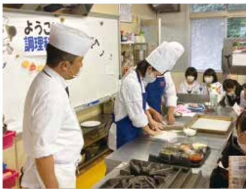
～第一調理実習での示範～

しかし、笑顔で真剣な中学生を見て不安もなくなり、来年一緒に学校生活を送るかもしれない後輩になるのだと思うと今から楽しみになりました。今回も、貴重な経験ができてよかったです。