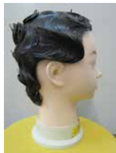
オールウェーブセッティング