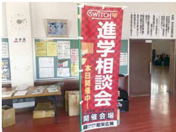
進路相談会が実施