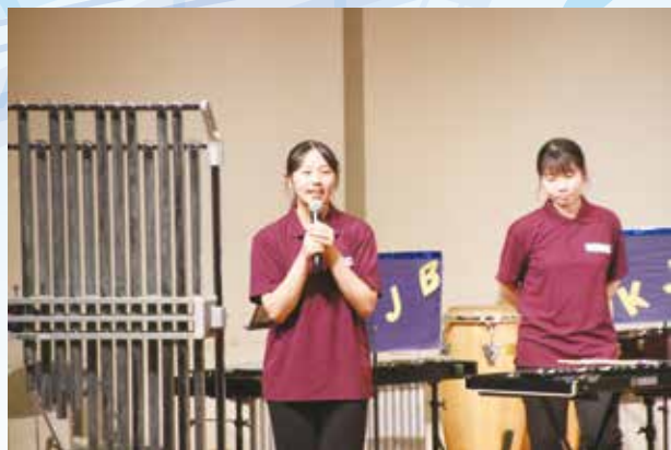
新キャプテンのあいさつ