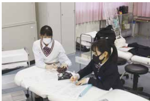
実技に向けて頑張っています