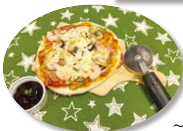
～チーズがとろーりピザ～