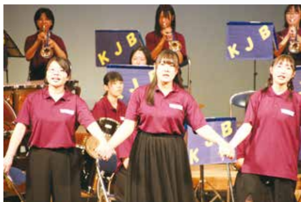
全員で盛り上げています