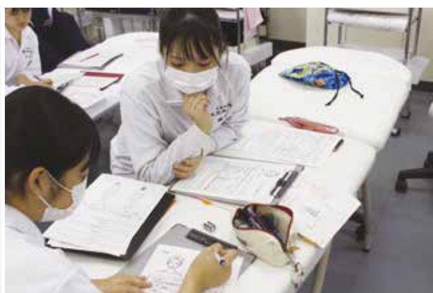
筆記も仲間と共に切磋琢磨しています