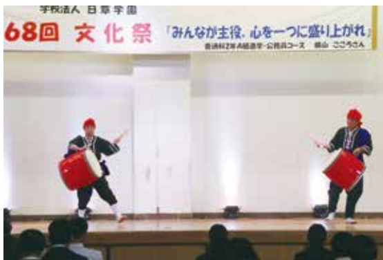
エイサー部の演舞

当日は、校舎内での体験・展示、スリーオンコートでの各種発表、体育館内での発表と三部構成を各学年ごとにローテーションで見ていく形になりましたが、天気にも恵まれ、生徒たちはそれぞれのアトラクションに楽しんで参加しておりました。この日のために一生懸命練習を重ねてきた生徒も「晴れの舞台」を特別な形で披露できたことは、一生の思い出になったことと思います。