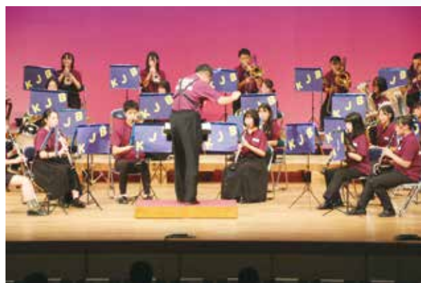
思い思いの気持ちをこのステージで