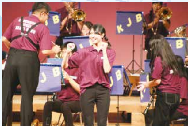
精一杯の演奏を聴いて下さい