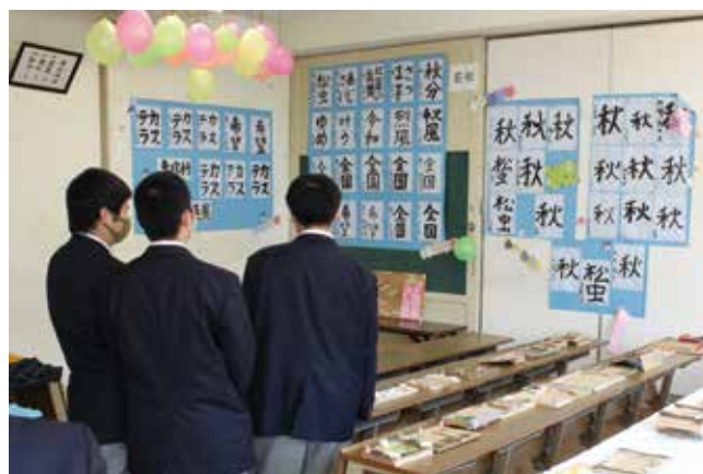
福祉共生専攻科の習字の展示