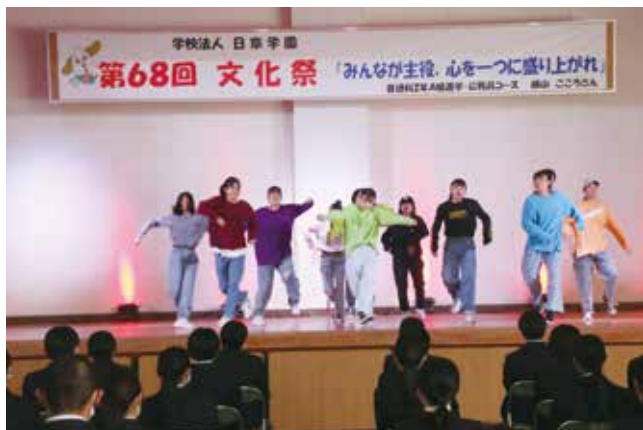
日々の練習の成果を