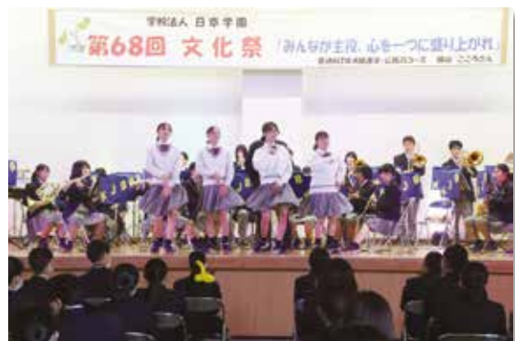
吹奏楽部によるパフォーマンス