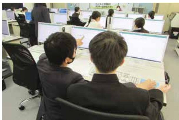
高校生が親切に、丁寧に、優しく教えています