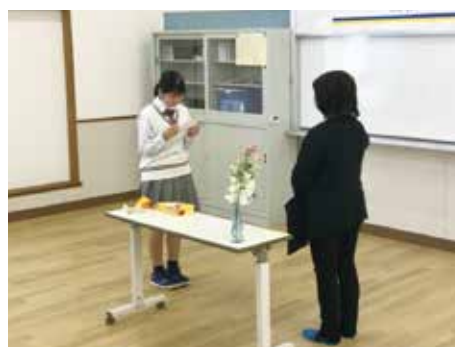
保護者へ感謝の手紙披露