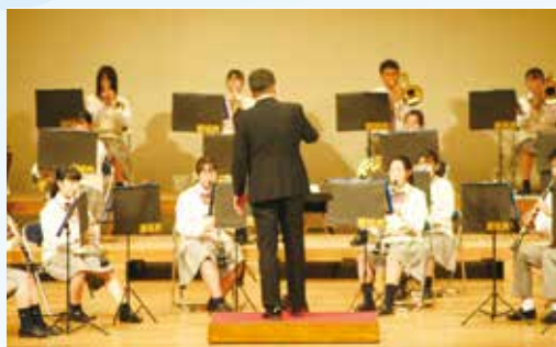
郡山教諭の指揮のもと

本校吹奏楽部は顧問郡山教諭の熱心な指導の下、放課後、土・日曜日も練習を続けてきました。今年度は新型コロナウイルス感染症拡大防止のため、各種大会が中止になり、なかなか日頃の練習の成果を発揮できる機会がありませんでした。吹奏楽部員1年生11人、2年生10人、3年生9人、計30人、3年生にとっては最後の舞台となりましたが、一生懸命演奏しました。応援に来ていただいた皆様、ありがとうございました。