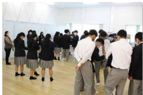
各学科の学習発表展示（社会福祉科）