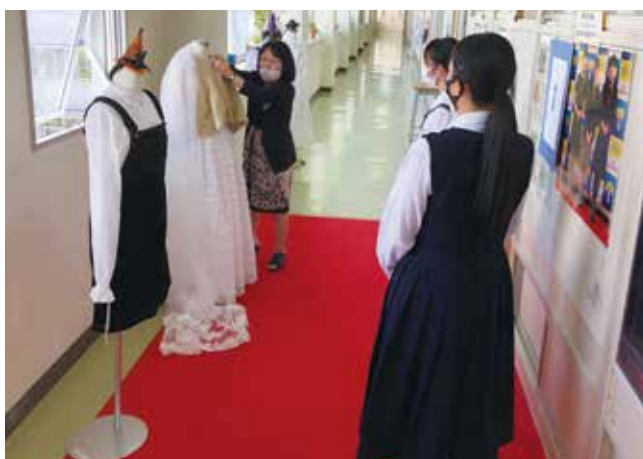
色々な服があります