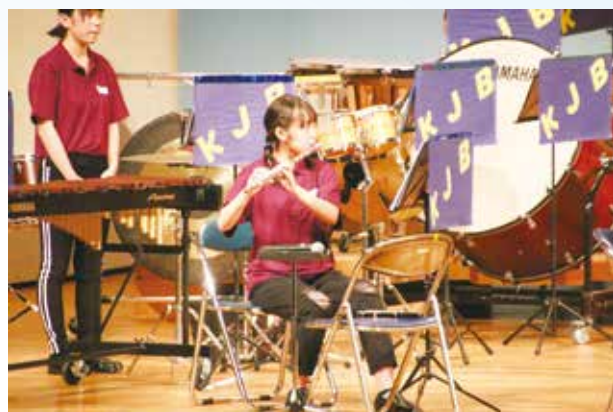
先輩方に思いを伝える表情は真剣です