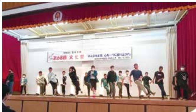
皆で楽しくダンスで盛り上がりました

新型コロナウイルスの影響も危ぶまれましたが、生徒会を始めとする生徒の皆さんや先生方、保護者の皆様の支えのもと文化祭が開催できましたことを心から感謝申し上げます。