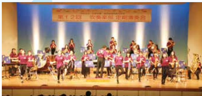
3年生のダンスも交えた演奏