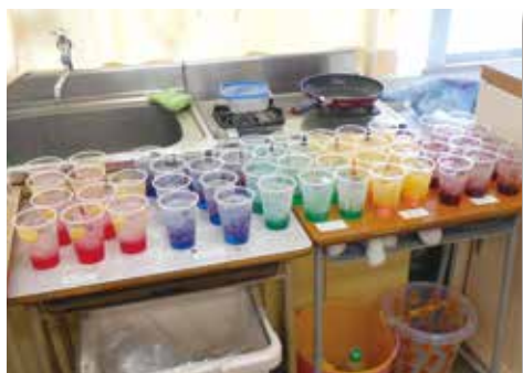
完成したカクテル