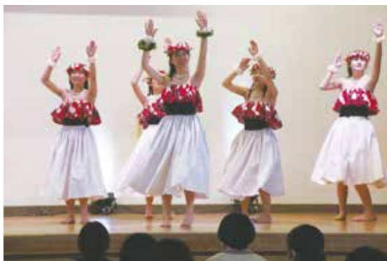
フラダンス部のパフォーマンス