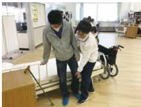
生徒も保護者も緊張気味

1月31日(日)には介護福祉士国家試験を控える生徒にとって、この日は合格への思いをさらに強める節目にもなりました。HR一丸となり「心をついに」達成することを願っています。