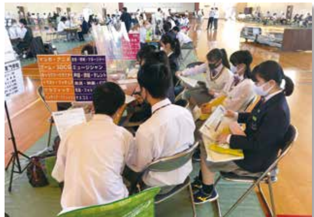
様々な学校の違いがあります