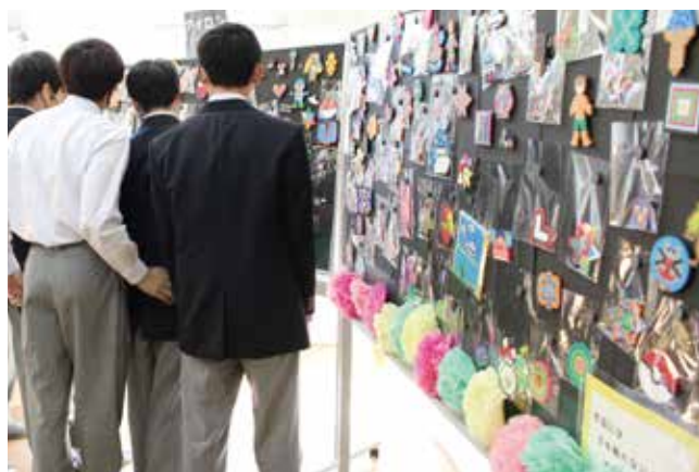
教室には展示物でいっぱい