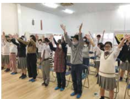
みんなで福祉レクリエーション