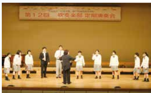
合唱部も応援に駆けつけてくれました