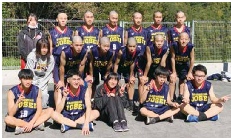
選手権大会後の集合写真

今後もバスケットボールのスキル向上及び人としての成長、大会での目標達成をできるように頑張っていきたいと思います。