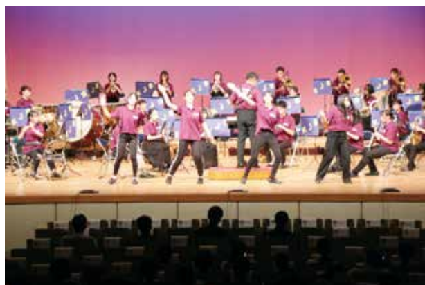
ダンスとのコラボセッション