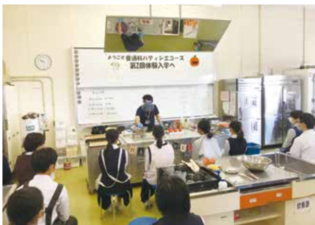
自分達で作ってみよう