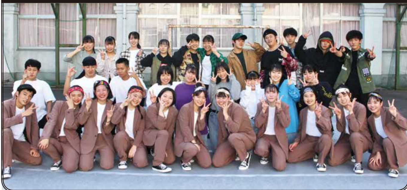
ダンス部 ダンス発表会