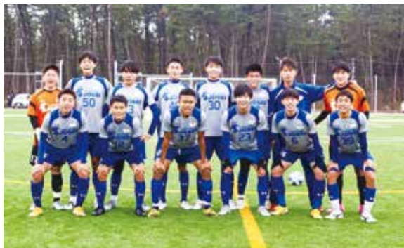
見事優勝したチーム