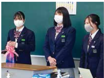
緊張気味の後輩たち

介護福祉士国家試験は1月31日(日)に実施され，今は結果を待つのみです。受験生全員の満面の笑顔が見られることを願っています。