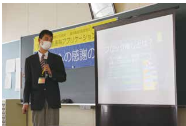
作品を紹介するスライドを作成し、プレゼンを行いました。