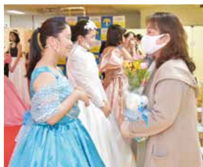
感謝の気持ちを込めて プレゼントを手渡しました