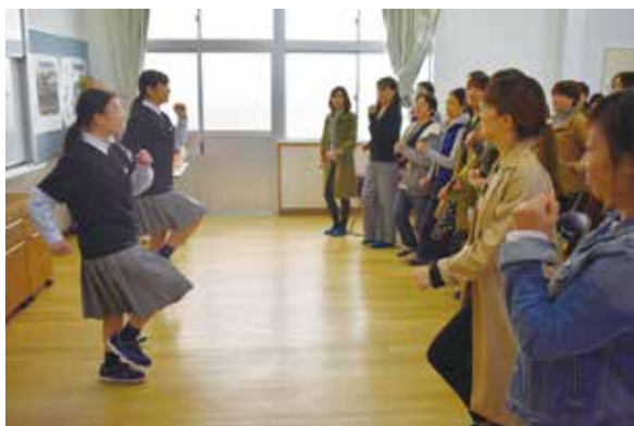
社会福祉科：介護体験運動