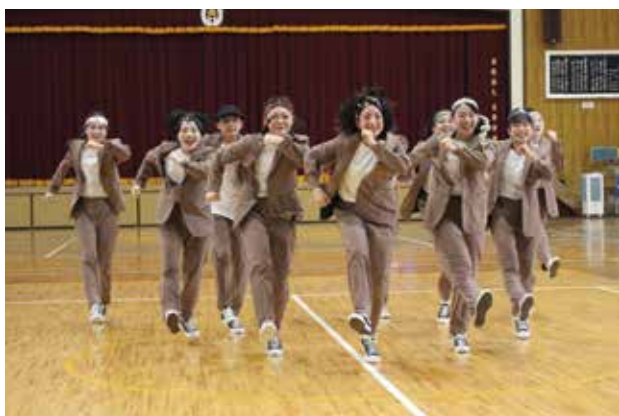
大会の映像審査用の動画撮影