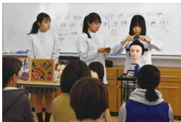
ヘアデザイン科：ワインディング