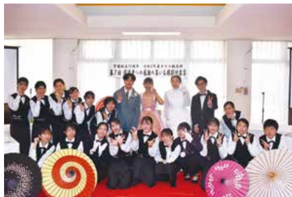
模擬披露宴会場の様子