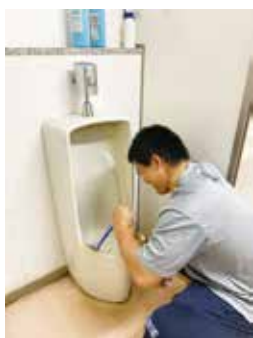
トイレをキレイに！

2021年は、野球・サッカー・駅伝の3部が全国大会で活躍してくれることを期待しています!!