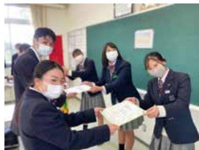
合格願っています