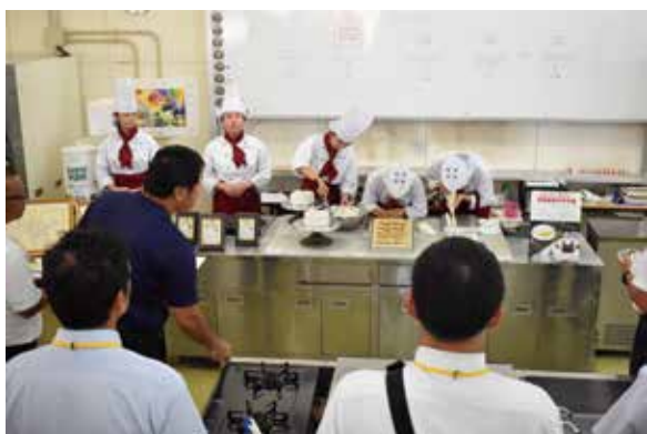
パティシエコース：実習実演