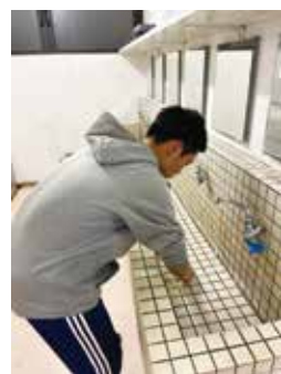
洗面所を磨きます！