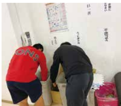
ごみの分別をしっかりと！