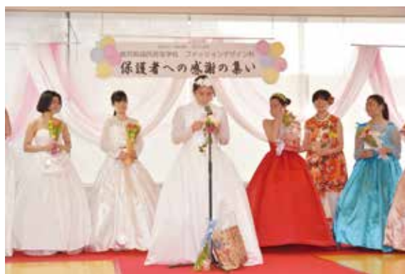
保護者へ感謝の手紙