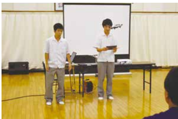
アプリケーションコース：ドローン飛行