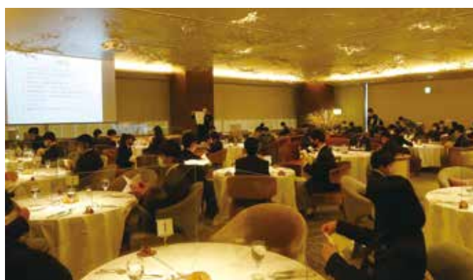
おしゃれなレストランで少し緊張しました