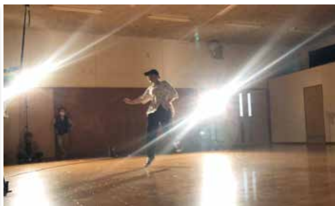
全力で臨むショートムービー撮影