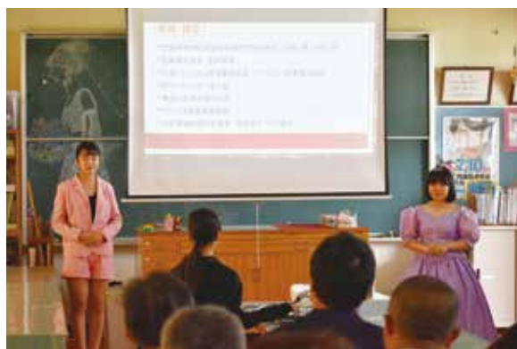
ファッションデザイン科：学科説明