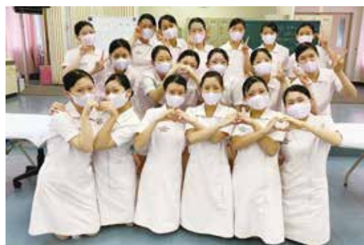
認定試験後の記念写真