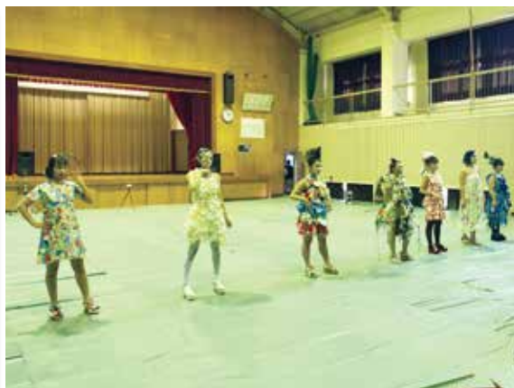
モデル全員でポーズ