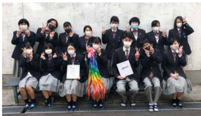
全員が自分を信じて結果を待ちます