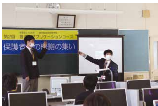
生徒それぞれが実演を交えて作品を発表しました。

3年生は、もうすぐ卒業を迎えます。アプリケーションコースで学んだ技術や知識は、必ず将来役に立つものです。この制作と発表の経験を忘れずに社会でも活躍してくれることを期待しています。