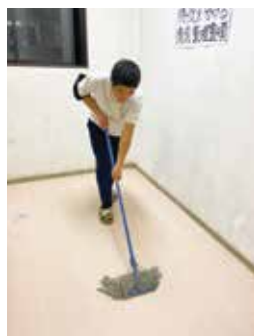
踊り場もキレイに！