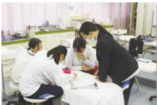
試験対策，放課後も頑張りました

実技試験を終えた3年生の感想を紹介します。17期生の全員合格！応援よろしくお願いいたします。