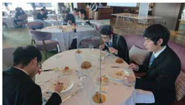
ナイフとフォークを上手に使えるようになりました