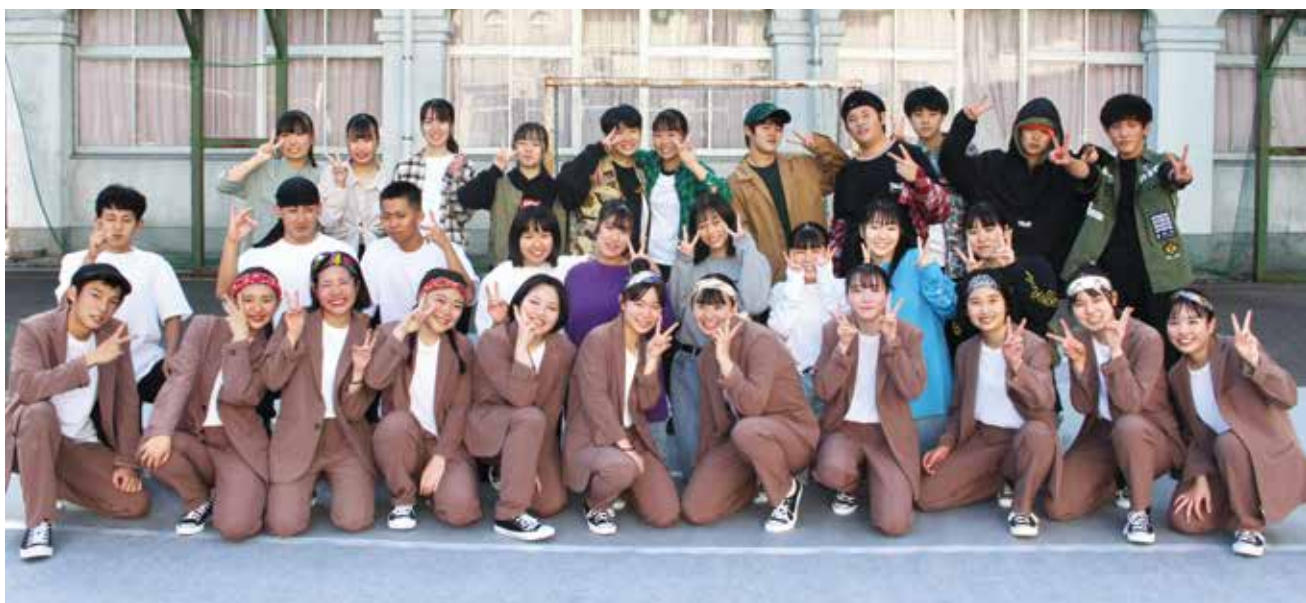
スリーオンコートで初めてのダンス発表会をしました

ダンス部では大会入賞やイベント出演、ダンス技術の向上などを目標に練習に励んでいます。現在2年連続で九州大会上位入賞し、全国大会に出場しています。また、先月は鹿児島県令和2年度文化芸術創造活動支援事業で制作されたショートムービーにも出演しました。