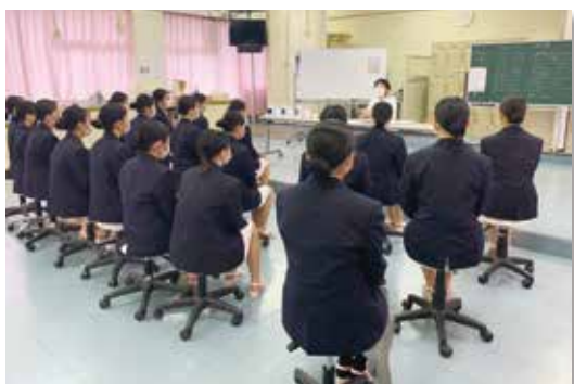
試験後，試験官からレクチャーを受けました