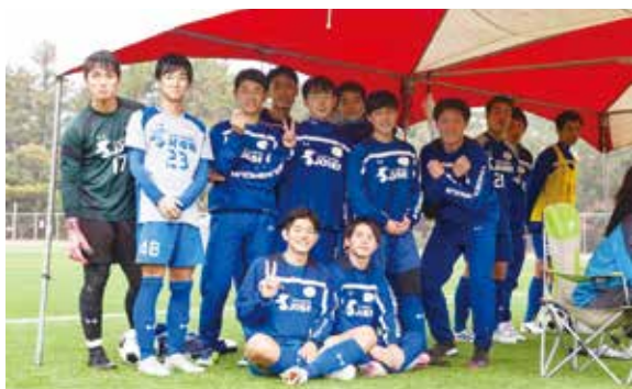
明るく試合を楽しむ選手たち