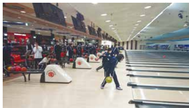
ストライク目指して頑張りました!!