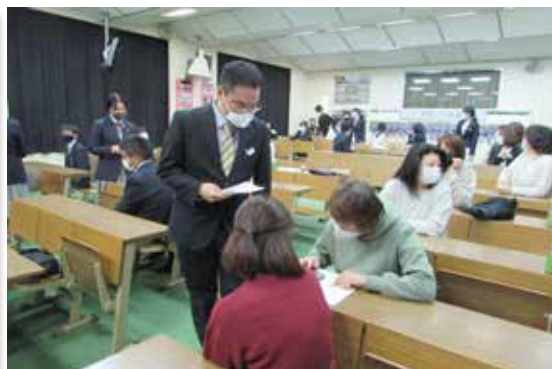
親子で電卓早打ちリレー対決