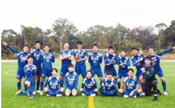
良い思い出ができました