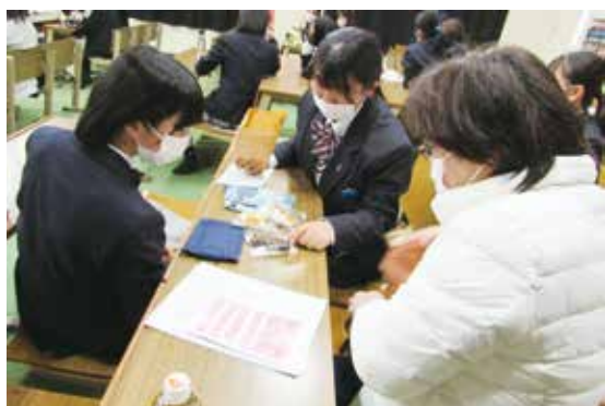
プレゼントの贈呈