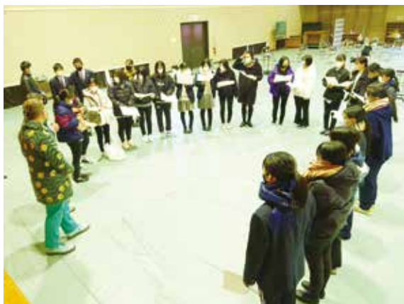
ハカタさんとスタッフ全員打ち合わせ

当日は、基本無観客、ライブ配信という形で行いましたが、会場内は生徒の熱気であふれていました。今後もまたヘアメイクショーなどに挑戦し、生徒の成長に期待したいと思います。