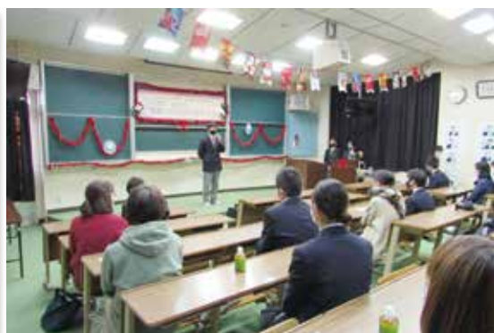
委員長から感謝のことば