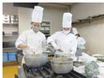
20個分のお弁当の仕込み中

今回は例年と異なる形での料理提供で不安な面もありましたが、無事に完成させ、食事を一緒にとりながら、親への感謝の気持ちを伝えることができました。いろいろありましたが、素晴らしい感謝の集いになったと思っています。