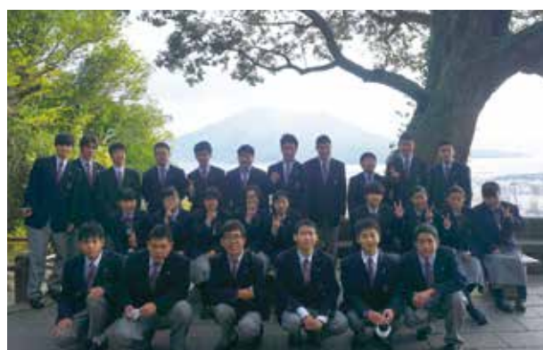
桜島をバックに集合写真!