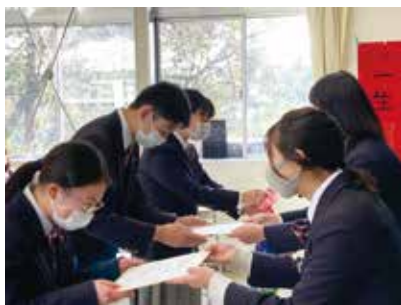
頼れる先輩たちへ