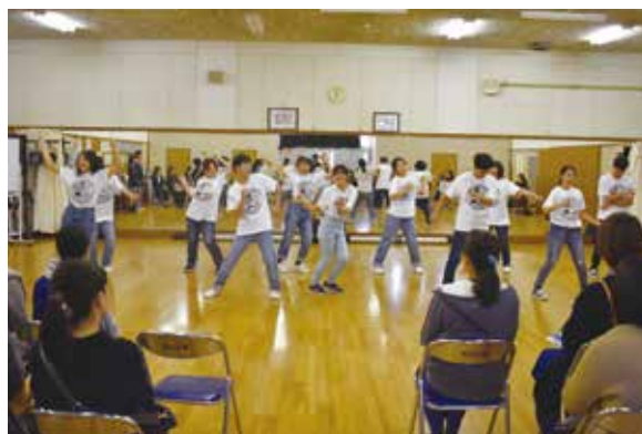
芸術文化コース：ダンスパフォーマンス披露