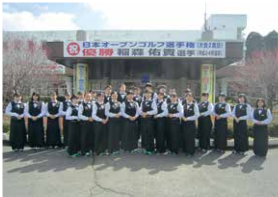
接客のプロフェッショナルたち