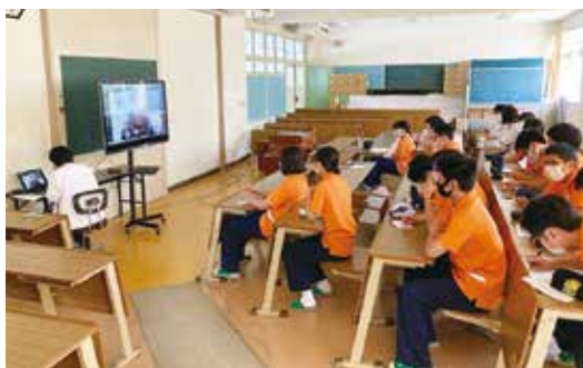
施設とのリモート実習 まだ慣れないなあ

将来、福祉の現場を担う人材として、貴重な高校3年間で人との出会いを大切に、豊かな心と思いやりを養うため、積極的な活動への参加や学習に努めてほしいと思います。