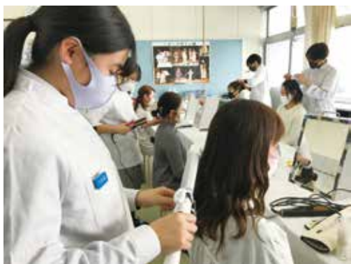
卒業記念行事（感謝のヘアサロン）