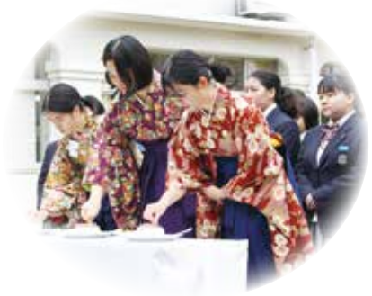
伝統行事の針供養