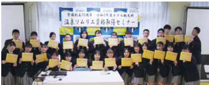
全員資格を取得しました