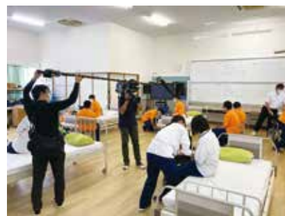
テレビ取材も受けました