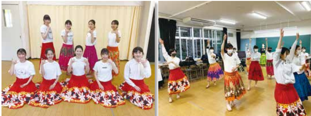
入部をお待ちしています！

初心者大歓迎です！部員募集中ですので、興味がある生徒は是非レッスン室に来てください。