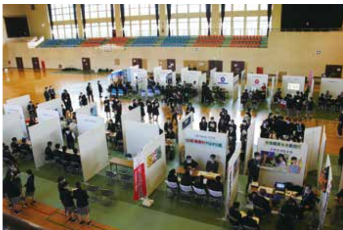
多数のブースが設けられた会場全体

例年9月以降、本格的に就職試験が始まります。生徒それぞれが、将来を見据えて、早めにしっかりと進路を考え、就職活動へ取り組んでほしいものです。