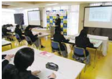
興味津々のセミナー受講