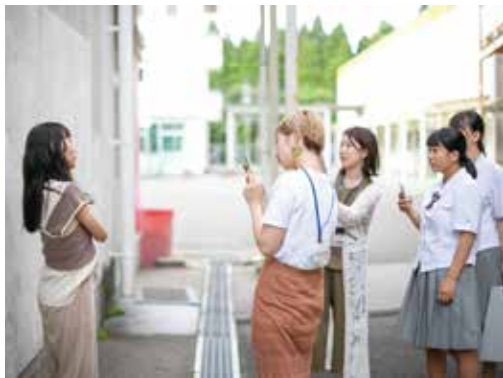
外部講師によるヘアメイク指導

新入生の皆さんは、全員で励まし合い、時には競い合いながら、美容業界に羽ばたくために同じ夢に向かって成長してほしいと思います。