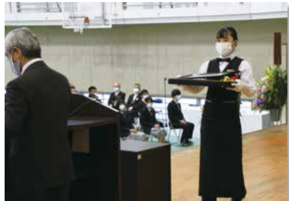
立派に務めた卒業式表彰補助