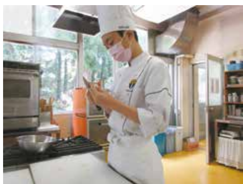
校内技術検定で、個人技術もレベルアップ