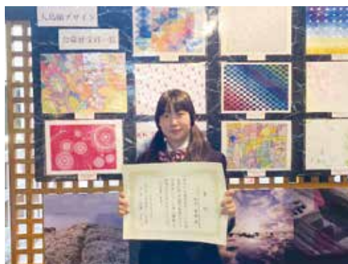
これからもデザインの技術を磨きます