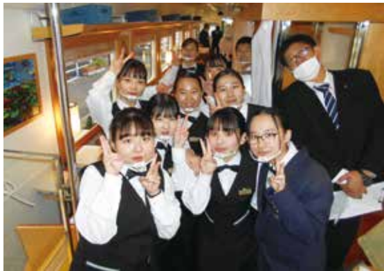
肥薩おれんじ食堂車内にて