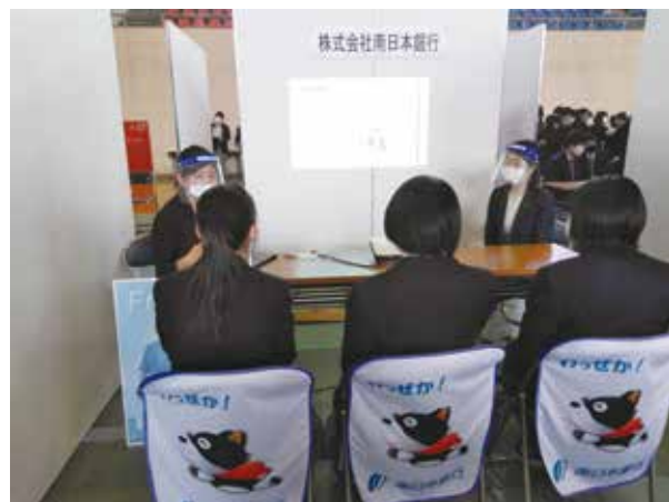
説明を熱心に聞いている生徒たち