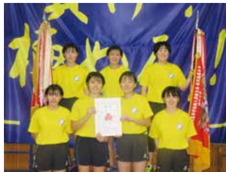
令和2年度 県新人卓球大会優勝