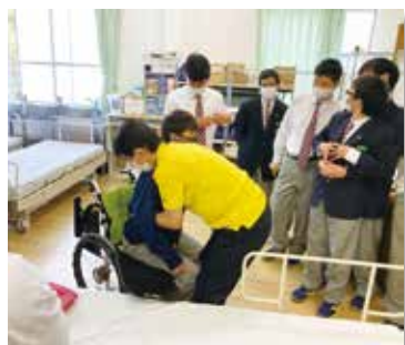
施設職員を招き校内実習を実施しました