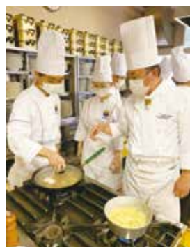
先生の指導を受けながら…