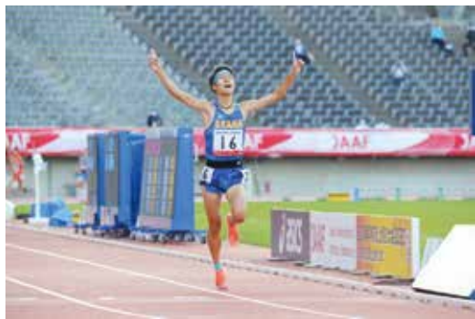
全国高校陸上競技大会2020, 5,000m優勝

令和2年度は、様々なスポーツ活動が制限される中で進学体育科生徒には厳しい一年となりました。しかし、鹿児島城西高等学校の名を全国に鳴り響かせようと、学校生活に、部活動に、明るく・前向きに取り組んでくれました。令和3年度は、目標達成に向けて生徒たちは活気・熱気・勢いを持って生活しています。本年度も進学体育科生徒の活躍に期待してください。