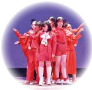
ファッションショー