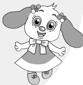
鹿児島城西高等学校 マスコットキャラクター 愛称「ジョディ」さん