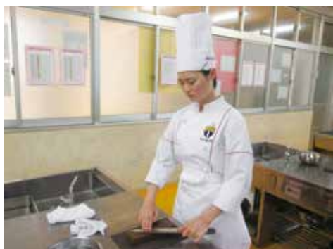
包丁研ぎからスタートします