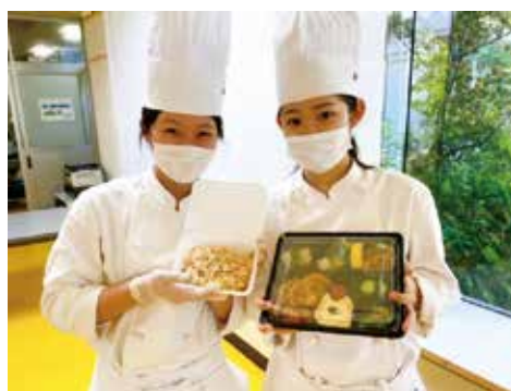
生徒・職員を対象にお弁当を販売