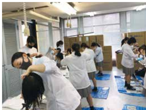
授業風景（ヘアカッティング）