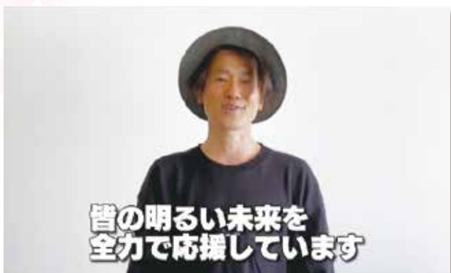
サプライズメッセージ ナオト・インテライミさんからお祝いのメッセージが届きました