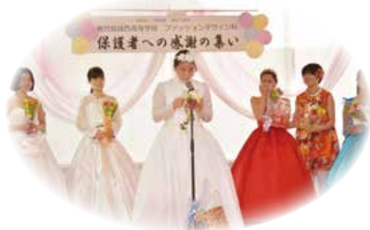
保護者への感謝の集い