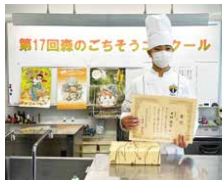
自分の腕を試す料理コンクールにも出場