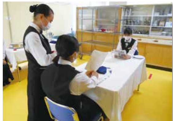
緊張感あふれる国家資格実技試験練習