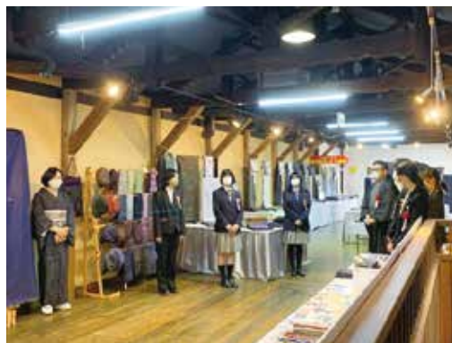
大島紬がいよいよお披露目になります