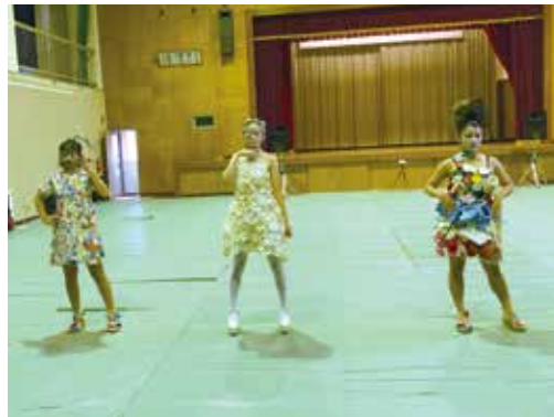
ヘアメイクショー