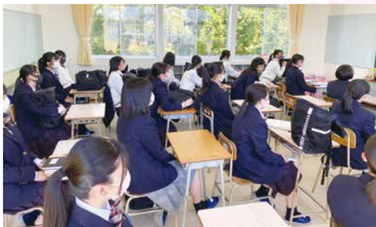
真剣に先生の話聞いています

3年生はいよいよ進路活動が本格的に始まります。入学した時の気持ちを思い出し、それぞれの夢実現へ向けて頑張ってもらいたいと思います。また2年生も1年生で学んだことを活かし、トータルエステティック科を盛り上げてくれると思います。