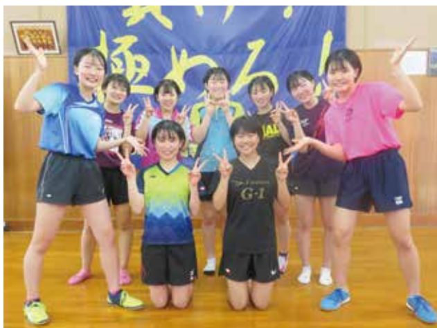
皆で頑張っていきます!!

高校生最大の目標であるインターハイに向けて、今できることを精一杯やり抜きます。鹿児島城西高等学校卓球部の伝統を引き継ぐべく9人全員の心をつにして、今後の大会に向け「優勝」を成し遂げたいと思います。