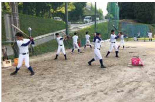
バットを振り込みます！

野球部には1年生26名が入部し、グラウンドにはさらに活気が出てきました。春の県大会では3回戦敗退と悔しい思いをしましたが、この悔しさをバネに5月に行われる鹿児島県NHK選抜高校野球大会の優勝と7月に行われる夏の甲子園予選での優勝を目指して毎日練習を頑張っています。