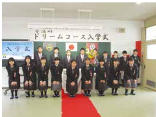
新入生 「よろしくお願いします！」