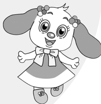
鹿児島城西高等学校 マスコットキャラクター 愛称「ジョディ」さん