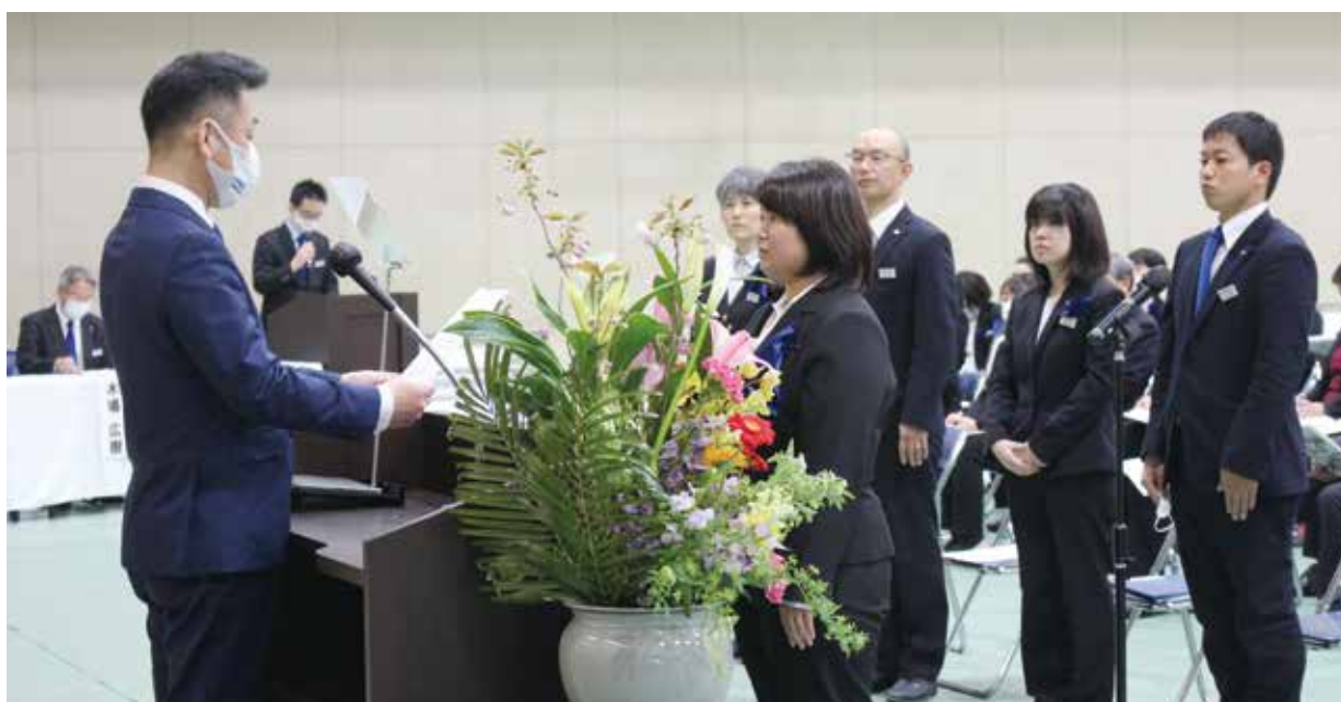
新規採用者辞令交付