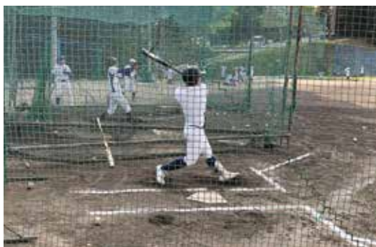
フルスイングを徹底します!!