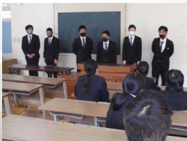
福祉共生専攻科1年生と2年生の対面式 「これからよろしくお願いします！」