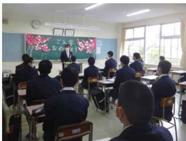
1年E組 HR目標「日進月歩」