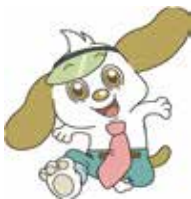
日章学園 マスコットキャラクター 「ニッチーくん」