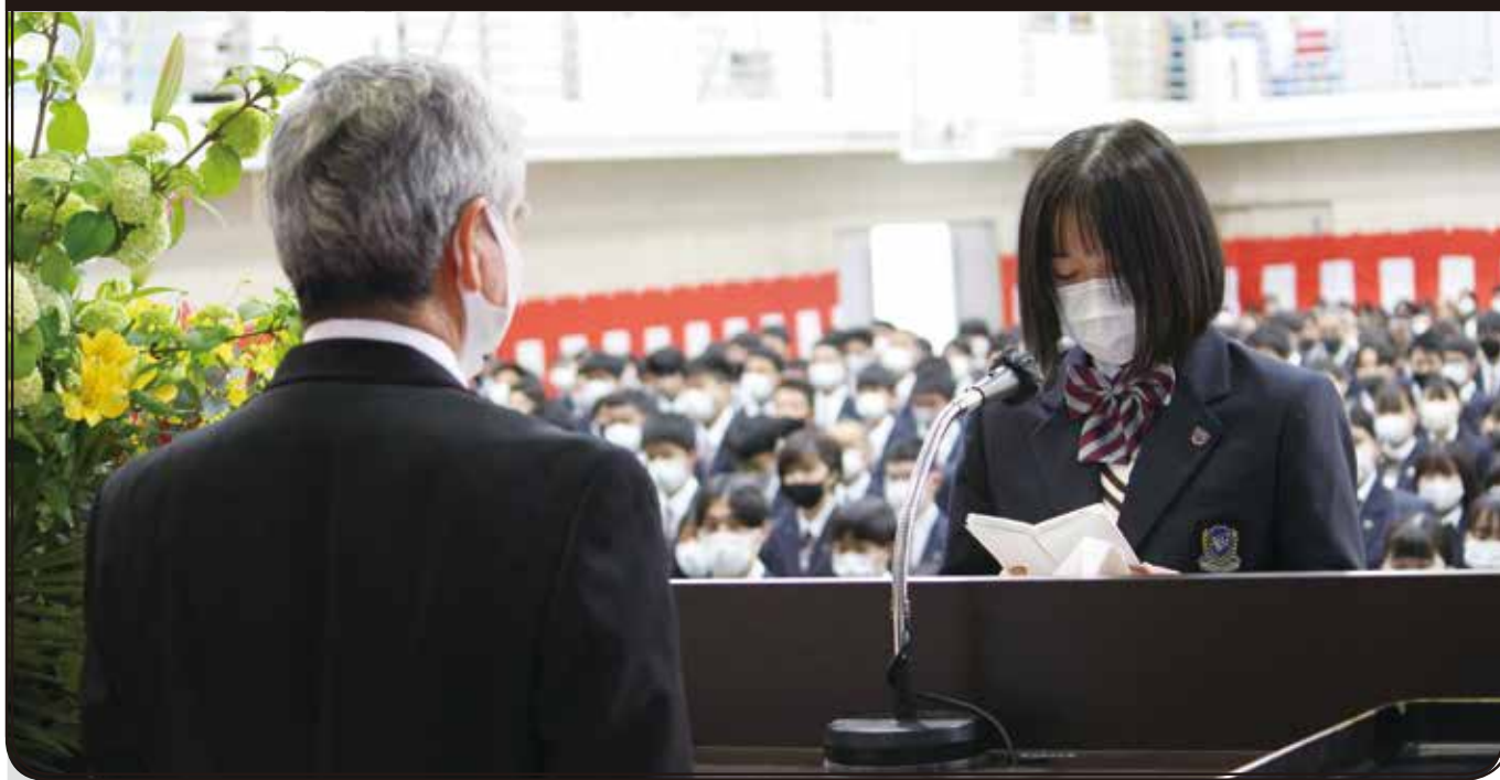
令和3年度入学式「新入生誓いのことば」