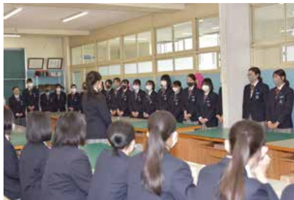
実習室で対面式 一緒に頑張っていきましょう