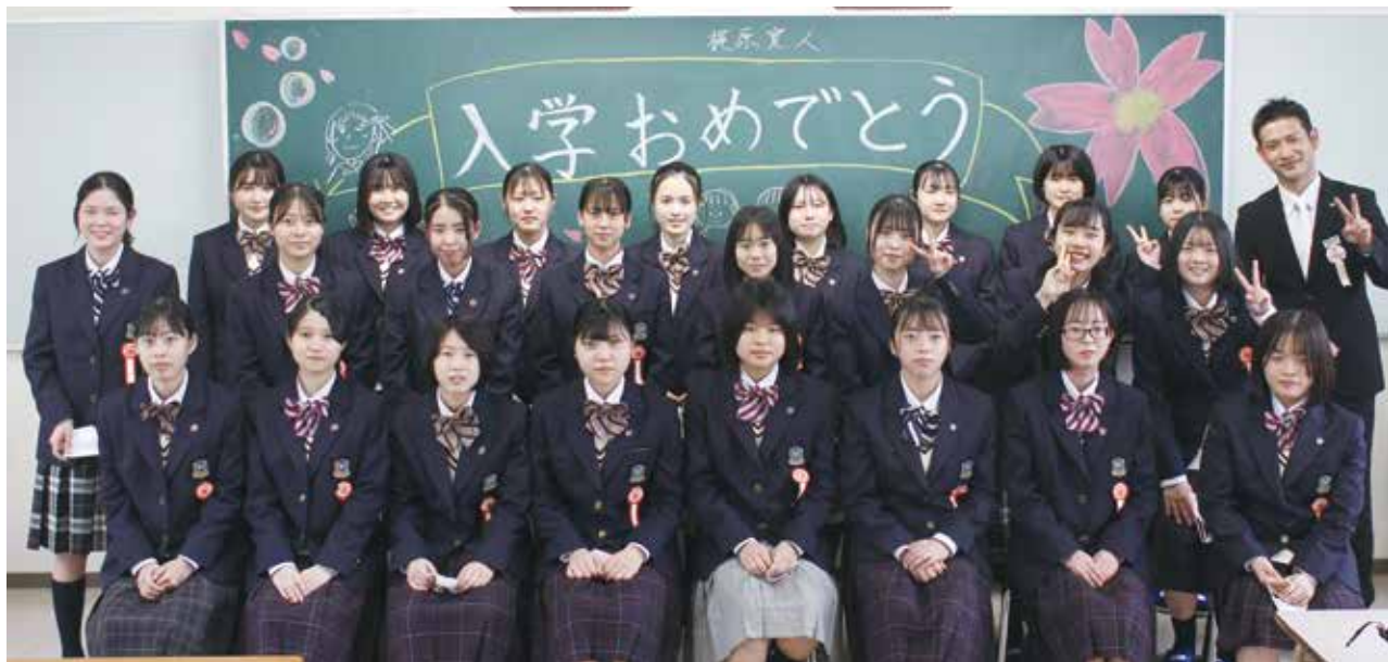
入学式後の集合写真

SHRの時間の様子です。最初は不安なことが沢山あると思いますが、24名の仲間との和を広げて、充実した学校生活を過ごしてほしいと思います。