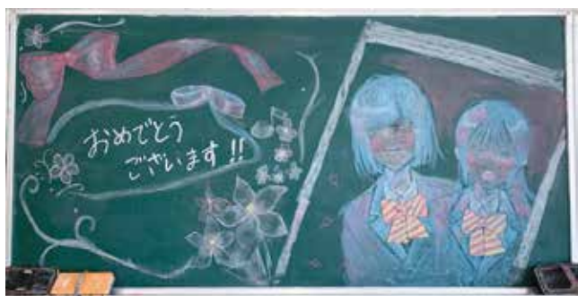
2年生が作成した歓迎の黒板アート