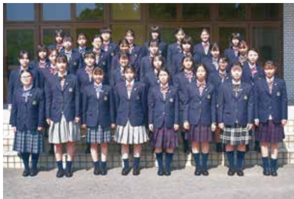
ファッションデザイン科の新しい仲間です

4月8日(木)に入学式が行われ、ファッションデザイン科にも32名の新入生が仲間入りしました。これからファッションデザイン科の一員として、学科の行事やイベントなど一緒に頑張っていきます。最初は慣れないことも多いと思いますが、仲間と励ましあい、それぞれの夢の実現に向けて頑張りたいと思います。2・3年生と学科職員で精一杯サポートしていきたいと思います。