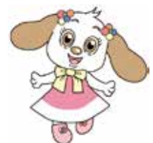
鹿児島城西高等学校 マスコットキャラクター 「ジョディさん」