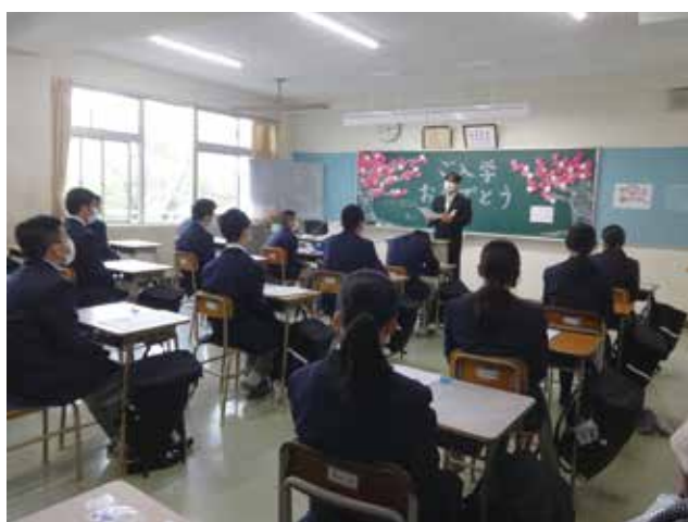
1年D組 HR目標「継続は力なり」

これからの1年間、「なにごとに助け合って精一杯」どんな困難も乗り越えていける集団であってほしいと思います。