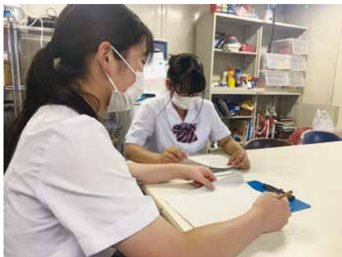
アンケート集計を行っています

7月7日(水)にはHR旗の作成や学級対抗リレーの選手選出、全体練習が行われました。