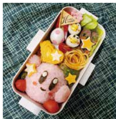
～ある日のお弁当②～ 『力作に遅刻しそうでした』