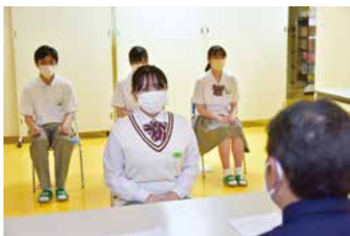
練習の成果を発揮しました

3年生は外部講師による面接指導が始まりました。ファッションデザイン科の3年生も就職試験や入学試験の対策として模擬面接に取り組んでいます。普段接することがない外部の方との面接になり、緊張感のある中で実施できる良い機会です。事前の準備・練習をしっかりと行い、進路実現に向けて歩んでほしいと思います。