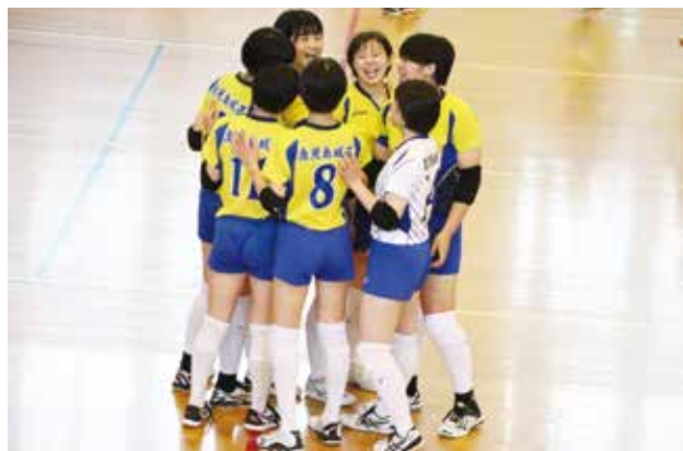
全員バレー、笑顔で頑張ります！