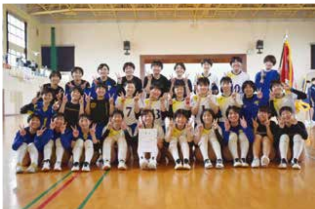
日置地区大会、優勝しました！

11月の春の高校バレー県予選で、鹿児島城西高等学校女子バレー部らしさを最大限に展開し、優勝できるように頑張りますので、応援よろしくお願いいたします。