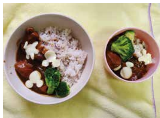
～ある日の夕食～ 『友達と二人で作りました』