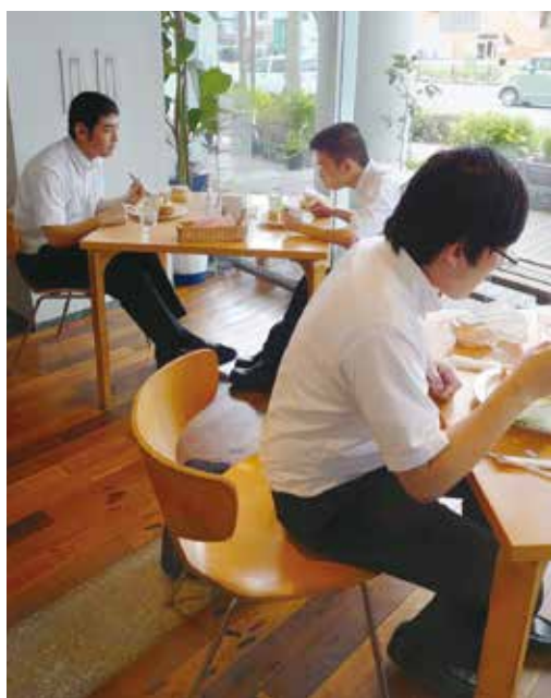
自分の好きなメニューを注文!!