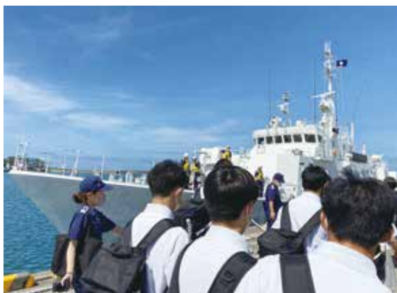
僕もPM21巡視船「とから」にのってみたいなあ