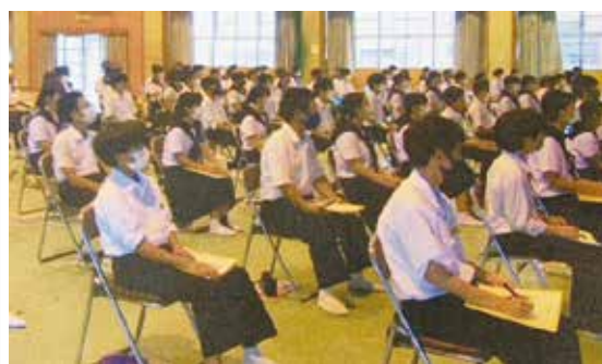
熱心に説明を聞く中学校の生徒さん