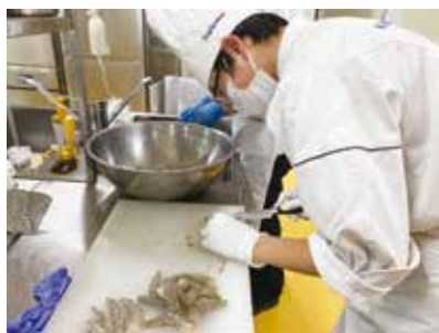
海老のムニエルを準備中