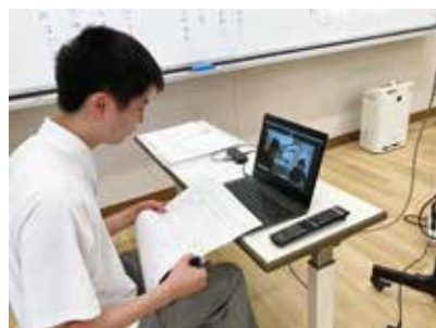
施設とリモートでの介護過程の実習（3年）