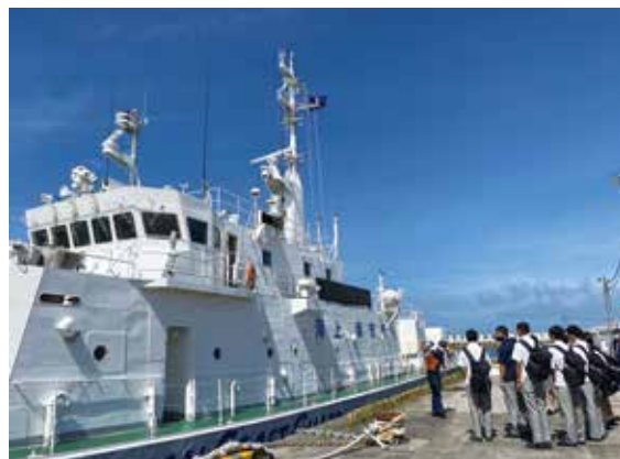
PM21「とから」の説明を受けています