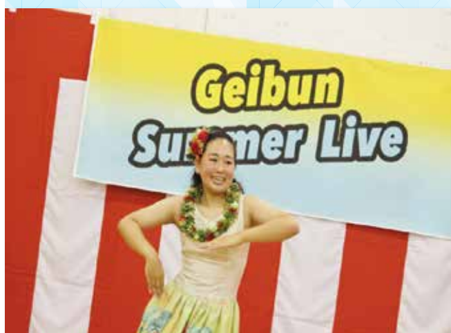
夏を感じるフラダンス