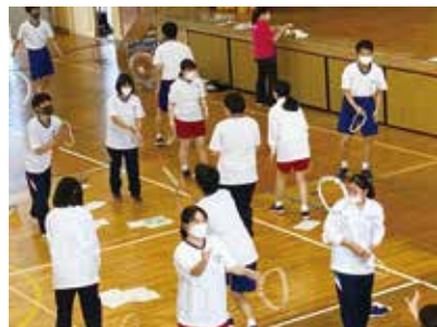
鹿児島県レクリエーション協会の方から指導を受けました（全学年）