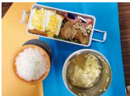
～ある日のお弁当①～ 『唐揚げの下味にこだわりました』