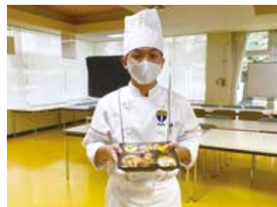
一生懸命作りました(*^_^*)