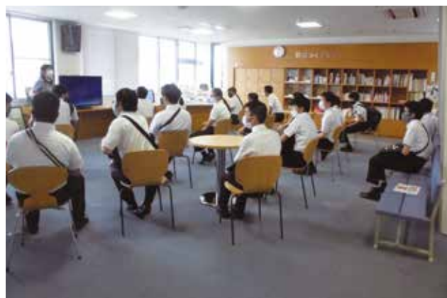
防災研修センターにて