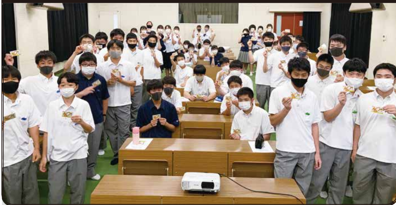
認知症サポーターの講習を受講