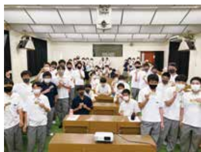
認知症サポーターの講習を受講（全学年）