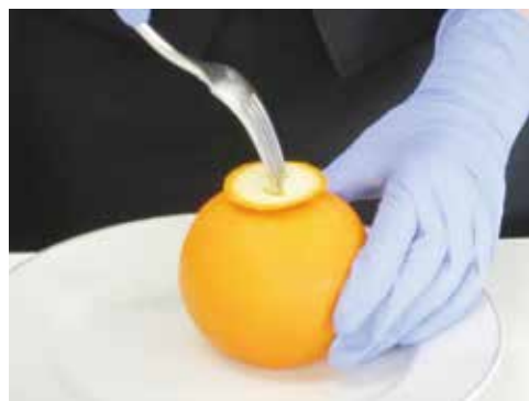
2) 上部に切り落とした下部をフォークで刺す