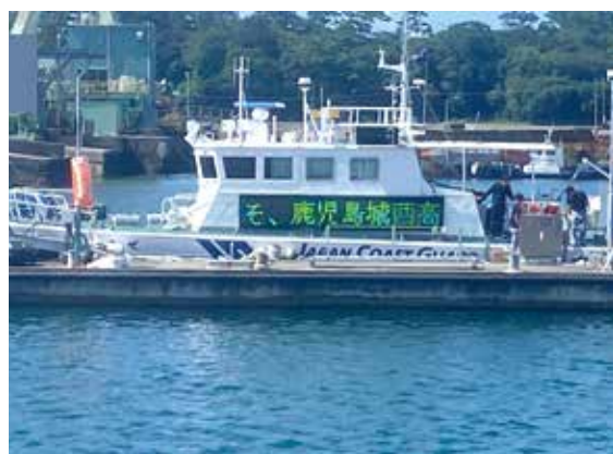
巡視艇「るりかぜ」のライトメールに『ようこそ、鹿児島城西高校のみなさん』と書いてありました。感激しました