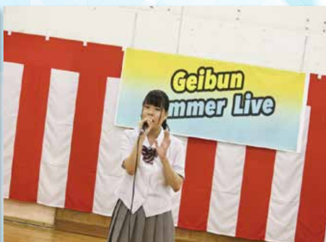
歌詞に自分の思いを込めて