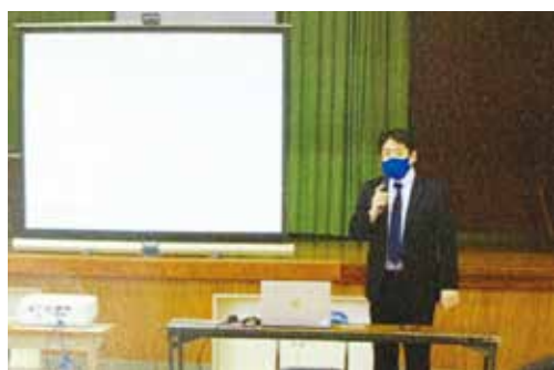
鹿児島城西高等学校の魅力をPRしました

本校では、生徒募集担当の職員が各中学校で開催される高校説明会に参加しています。今年度は6月末までに120校の説明会に参加しました。説明会では、中学3年生とその保護者に各学科・コースの特色や部活動の活躍の様子、スクールライフ、活躍している卒業生の様子などを紹介し、本校の魅力をPRしています。中学3年生の進路選択や将来の設計に役立てていただくことができましたと思います。次に説明を聞いた中学生の感想を紹介します。