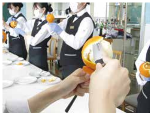
4) 皮を切り落とします