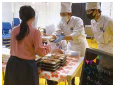
お会計も自分たちで……