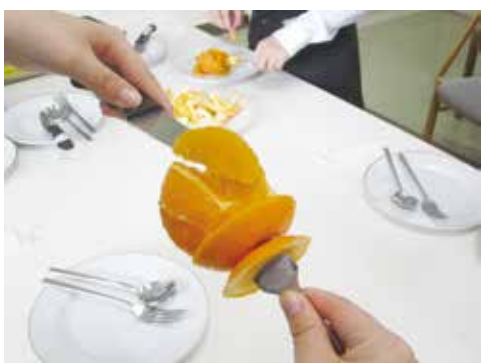
5) 実を1房ずつ外して