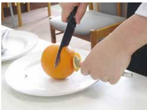
3) 1周浅めに切り込みを入れた後