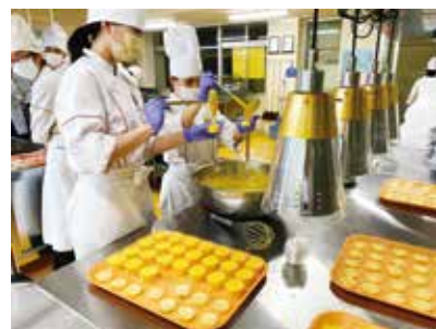
マンゴームース付きのお弁当♪