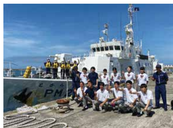
串木野海上保安部の皆様、ありがとうございました