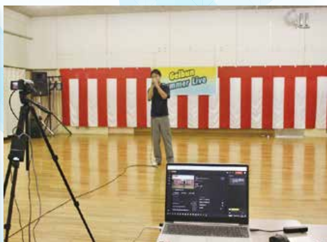
撮影の裏側を少しだけ公開します