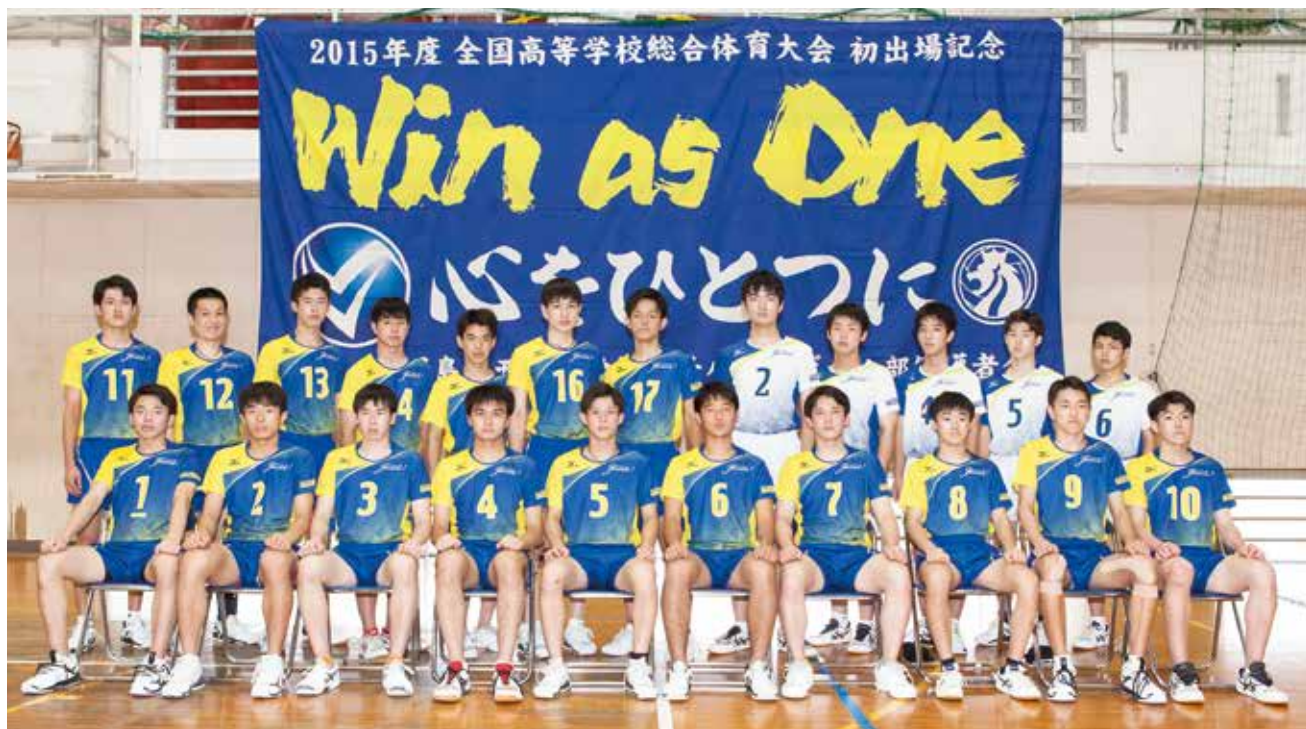
全国大会出場を目指します

男子バレーボール部は、11月に行われる全日本高等学校選手権（春の高校バレー）県予選大会優勝を目標に、練習に励んでいます。高校総体では、納得のいく結果ではありませんでしたが、チームは最後の大会で夢が実現できるように頑張っているところです。これからも、一日一日感謝の気持ちを忘れずに頑張ります。