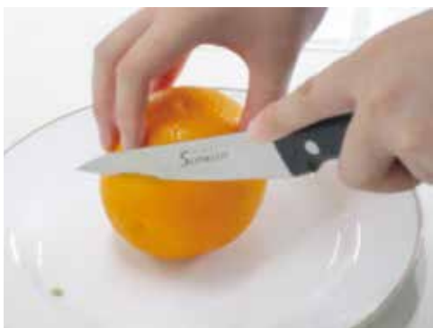
1) オレンジの下部をカットする