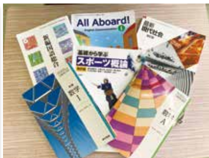
1年生の教科書。専門教科はスポーツ概論