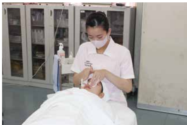
2年生はクレンジングの実技テスト。緊張感漂う中、実力を発揮していました♪