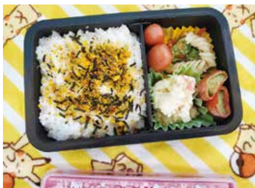
～ある日のお弁当③～ 『バランス良く、サラダは必ず入れます』