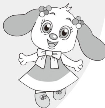
鹿児島城西高等学校 マスコットキャラクター 愛称「ジョディ」さん