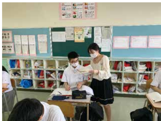
簿記検定に向けて