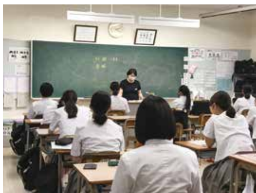
全員真剣に授業を受けていました

授業では資料を用いて, 薬物乱用の危険性や場合によっては死に至ること, 未成年者の喫煙や飲酒も薬物乱用に入り, 一度使っただけでも「乱用」になり犯罪になるということを知りました。自分には関係ないと思わないことや, 家族, 友人などの周囲の人にも不幸になることがあるため, 万が一薬物と関わる機会があった場合は, きっぱりと断ることの大切さも学ぶことができました。今回の指導で改めて薬物の恐ろしさを知り, 関わらないことの大切さを知る貴重な時間になりました。