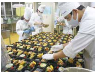
心を込めて盛り付け