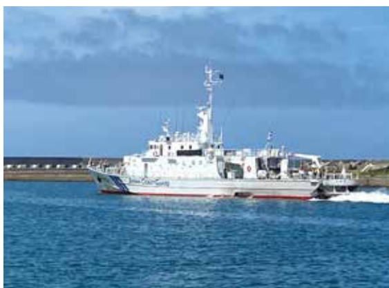
PM21巡視船「とから」が出港しているところです