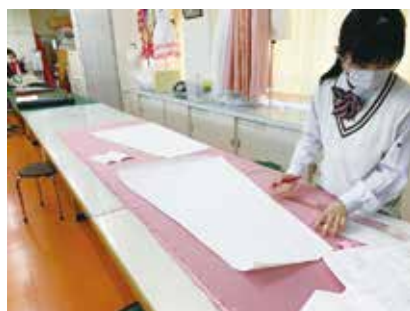
生地のカットは慎重に行います