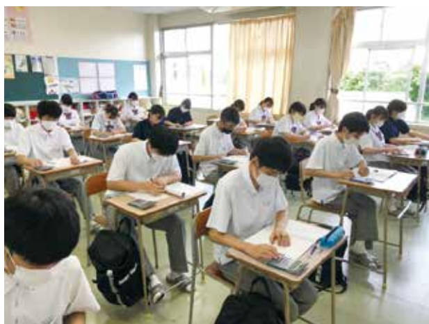
電卓検定に向けての取組

合格通知が届き、さらに上級を目指し始めています。これからも日々の努力を重ね、一人一人が目標達成できるよう頑張ってもらいたいと思います。