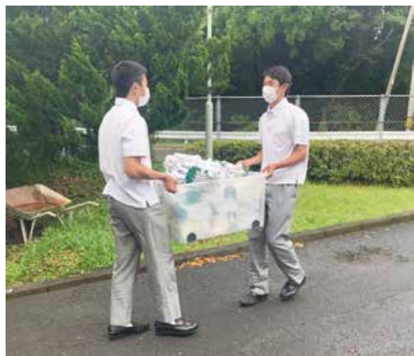
道具類の確認を行っています