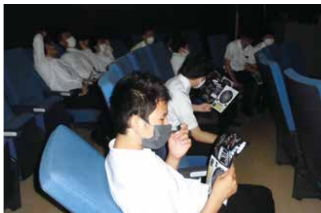
プラネタリウムの体験!!

今後、雨の日の過ごし方の一つとして、療育手帳を活用した余暇を楽しむことにつなげてほしいものです。