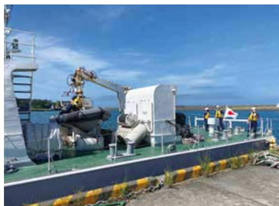
PM21巡視船「とから」にはゴムボードが設置されていました