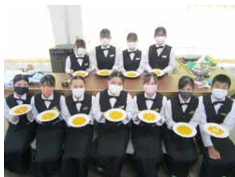
6) 完成です（頑張った3年生たち）

レポートライブで初の試みとして、ホテル観光科で学ぶ、ホテルレストラン技術のほんの一部をご紹介しますがいかがでしたか？