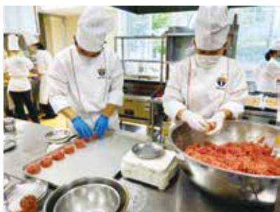
10kgものハンバーグの成形

今回初めて総合調理実習でのお弁当販売が行われ，150食分のお弁当を作ることになりました。前日までに確認作業を完璧にしたつもりでしたが，いざ作るとなると，いつもの何倍もの材料の量に，器材の選別や効率のよいやり方がわからずに苦戦しました。しかし，班の人と最後まで協力して仕上げることができ，多くの先生や同級生のみんなに購入してもらえて本当に嬉しかったです。