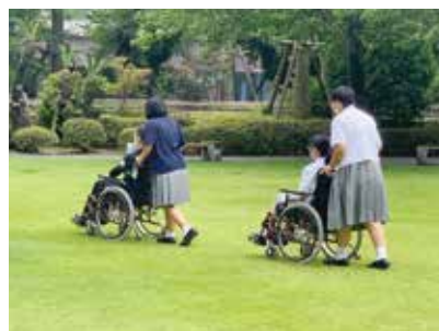
鹿児島県介護実習を普及センターで体験（1・2年）