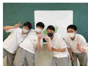
グループ発表その5