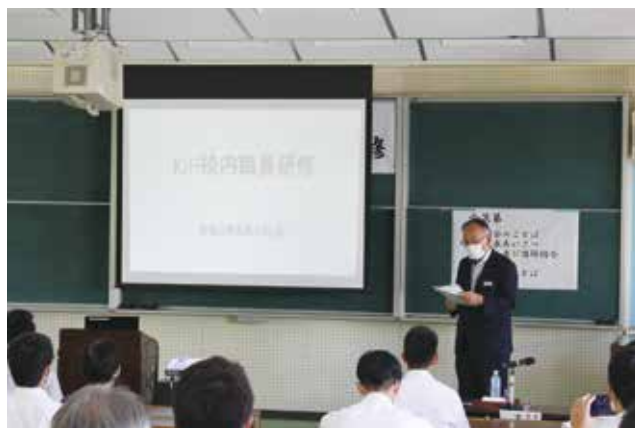
木元所長による講話