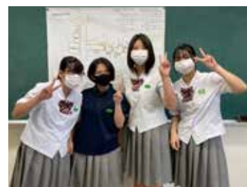
グループ発表その2