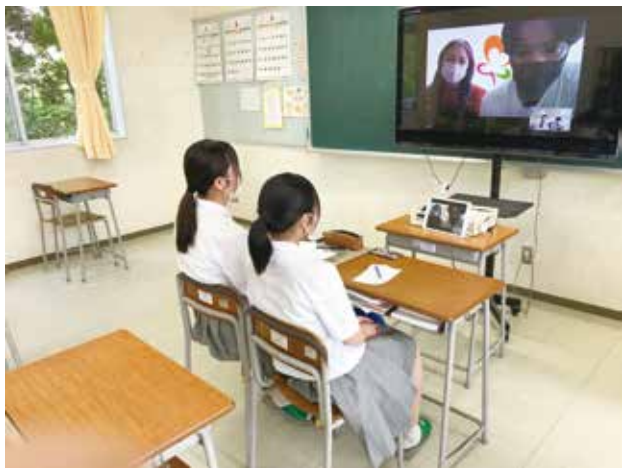
3年生リモート説明会