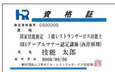
国家資格の資格証

8月18日(水)に国家資格3級レストランサービス技能士1次学科試験を、ホテル観光科2年生16名が受験しました。