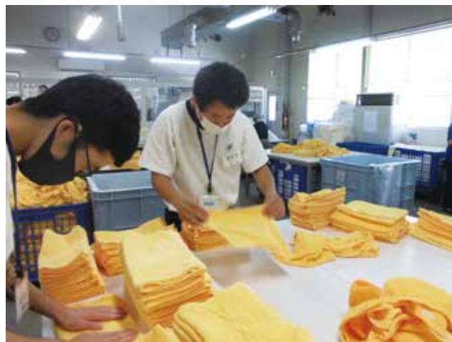
真剣に取り組んでいます!!