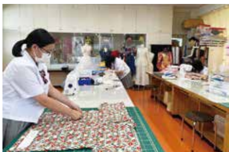
完成したじんべいのチェックをしています

ファッションデザイン科では、夏季休業中も実習室を利用して、制作に励む姿が見られました。被服製作技術検定の事後作業や、ファッションショーの作品制作をしました。日頃の授業では時間が限られていますが、集中して熱心に取り組みました。