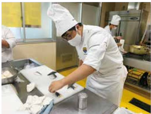
鯖を1人分の切り身の状態に分けています

お弁当を提供するにあたっては、調理してから、喫食するまで時間がかかるため、食中毒等のリスクが高くなります。普段以上に衛生管理に気をつけ、先生の指導を受けながら各班が与えられた料理を時間内に作り、お弁当箱に詰めるという作業を協力しながら一生懸命取り組みました。