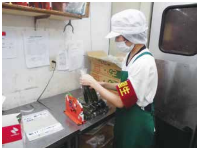
野菜の袋詰め、上手にできました!!

今回の実習で、自分の長所や今後の課題が見えてきました。実習を実習で終わらせるのではなく、いただいた評価を参考にして今後の学校生活や家庭生活、日常に生かし、自分の将来に繋げる糧にしてほしいと思います。そして、希望する進路決定に向けて、充実した支援を行っていききたいと思います。