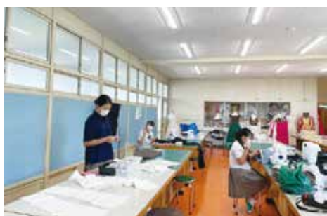
3年生はファッションショーの作品制作中