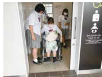
多目的トイレの使用感覚