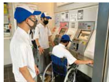
券売機の高さはどうかな？