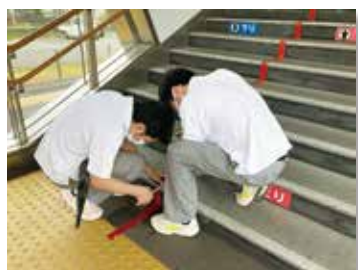
階段の幅を計っています