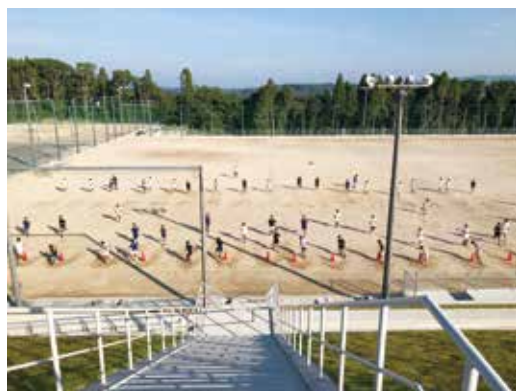
朝練習にも活気があります！