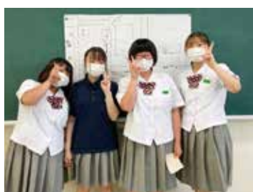
グループ発表その4