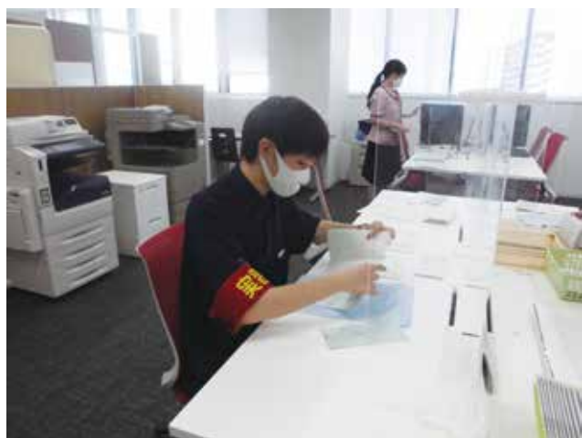
間違いがないように丁寧に!