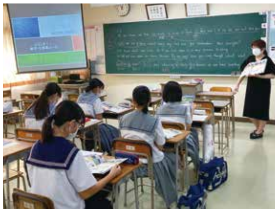
普通科 進学・公務員コース