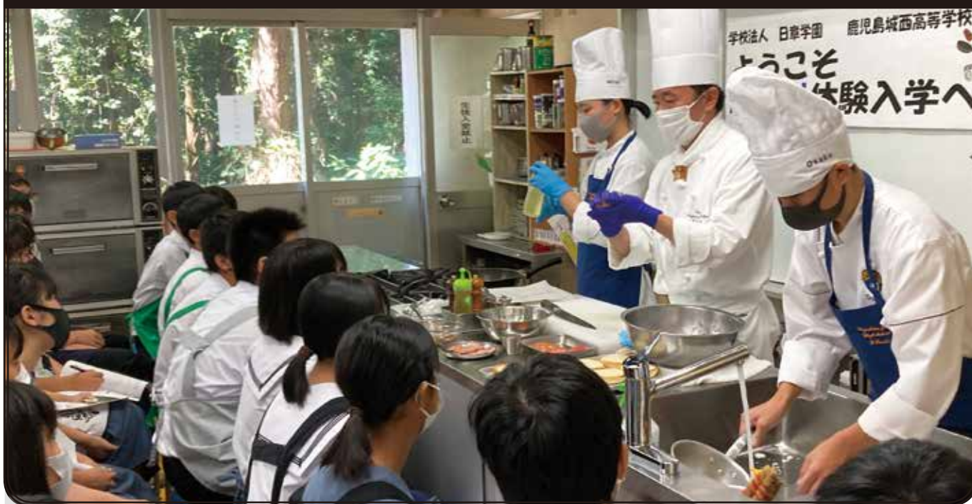
令和3年度 第1回一日体験入学