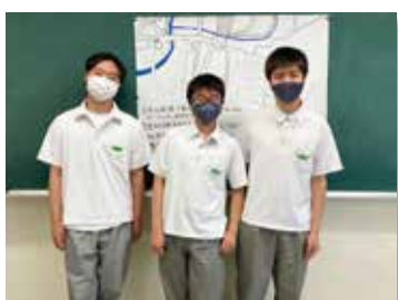
グループ発表その3