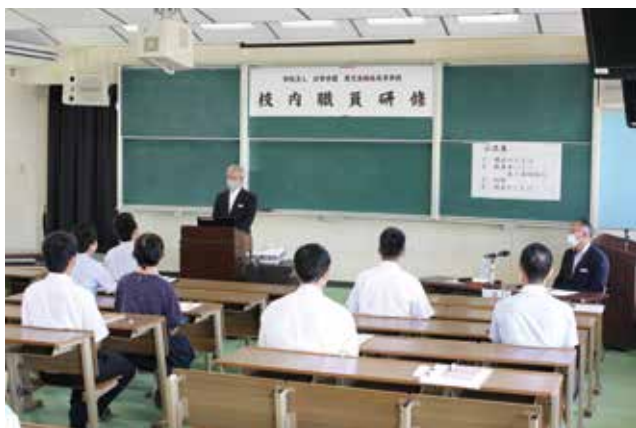
校長あいさつ及び講師紹介

今回の研修を生かし、全職員が生徒一人一人により良い指導ができるよう努めていきたいと思います。