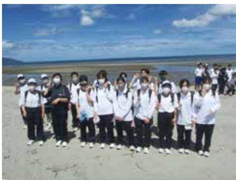
1日目 吹上浜海浜公園