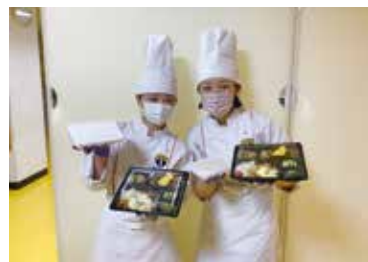
購入していただきありがとうございました