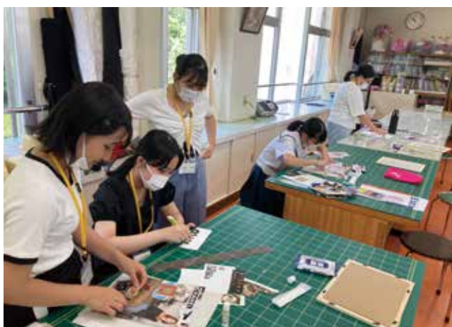
ファッションデザイン科