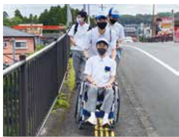
歩道の凸凹が気になりました