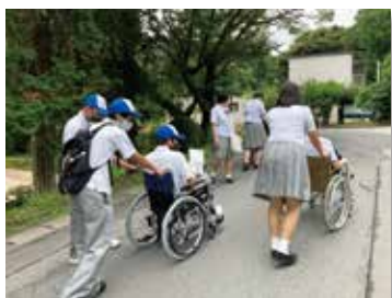
急勾配の下りは慎重に

2学期となり、3年生は進路決定、本格的な国家試験受験対策が始まります。今回の経験から疑問やアイデア等考えたことを、この先何かしら役立てることができれば幸いです。