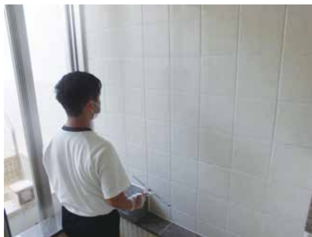
浴槽の壁もきれいにしています!!