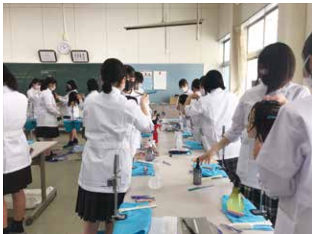
1年生ワインディング実習に挑戦