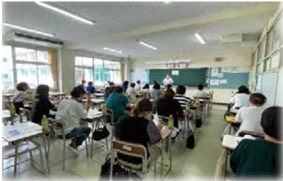
本校会場ホームルーム