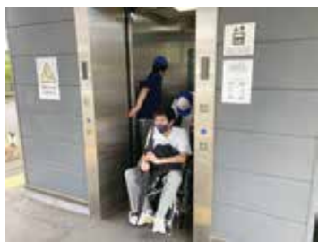
身体障害者用エレベーター