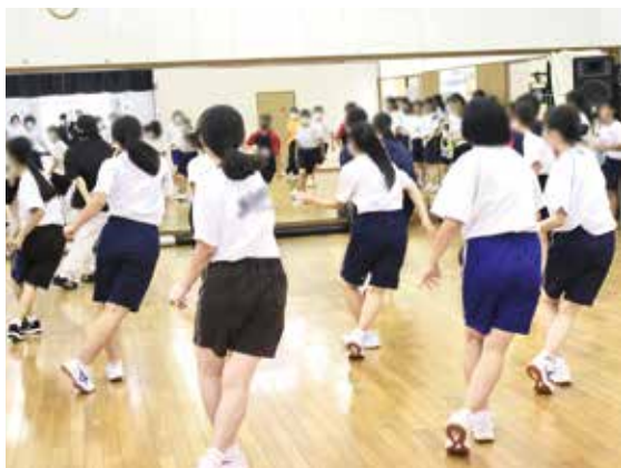
普通科 芸術文化コース