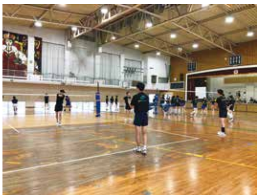
基本練習を徹底します！

まだ新型コロナウイルス感染症拡大の影響もあり、なかなか思うような活動ができない状況でありますが、生徒たちも鹿児島城西高等学校の名を全国に轟かせようと前向きに頑張っています！