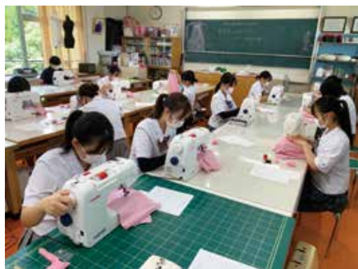
練習の成果を発揮しました

1学期の最後に、1年生が初めて被服製作技術検定4級に挑戦しました。4級検定は、なみ縫いやまつり縫い、ボタン付け、ミシンの直線縫いなど、基礎的な技術の習得が課題です。一生懸命に練習して実技試験に臨みました。2学期からは本格的に作品制作に取り組んでいきます。