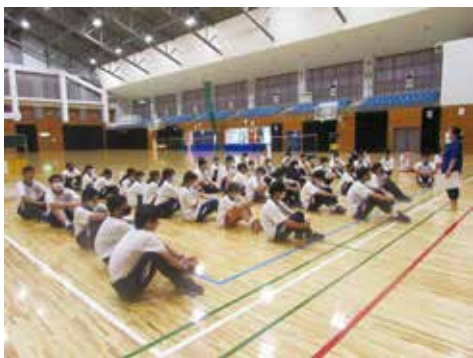
2日目 松元平野岡体育館