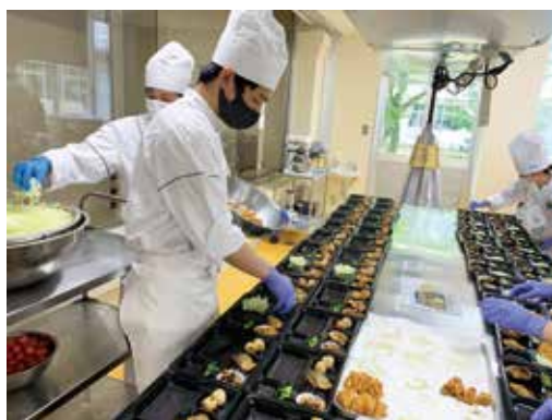
お弁当箱を並べて盛り付け中