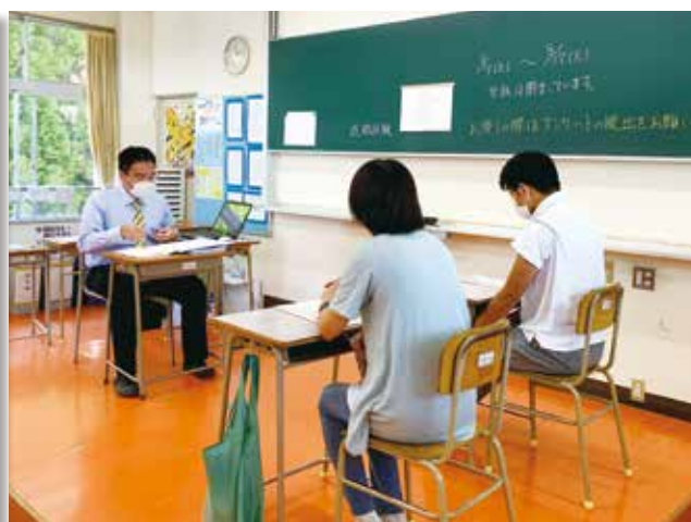
進路実現に向けた三者面談