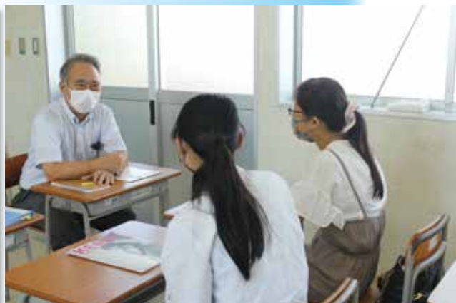
夢を実現するための三者面談