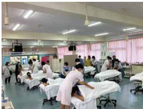
トータルエステティック科