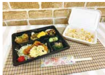
チキン南蛮弁当完成!!

将来、調理師になるために、これからの調理実習を大切に、真剣に取り組む努力していきたいです。