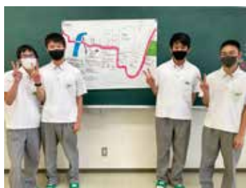
グループ発表その1