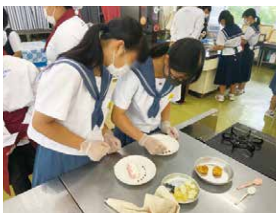
普通科 パティシエコース