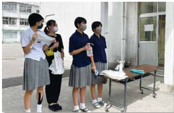
検温と消毒を徹底しました

2学期は多くの行事も計画されています。活動を通して生徒個々の成長を楽しみにしています。