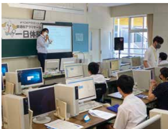
普通科 アプリケーションコース