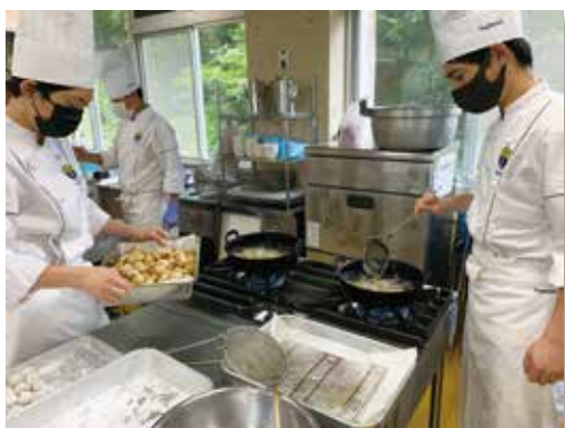
里芋のそぼろあんかけの仕込み中