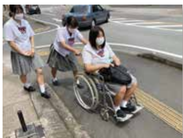
少しの勾配で操作が困難に