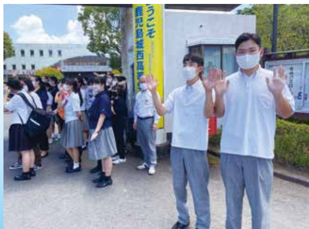
中学生の案内や見送り等を行いました