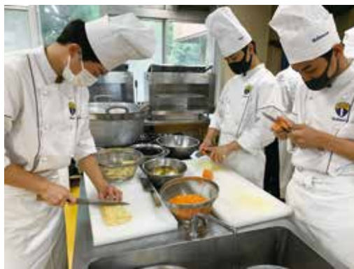
ひじきの炒り煮の仕込み中