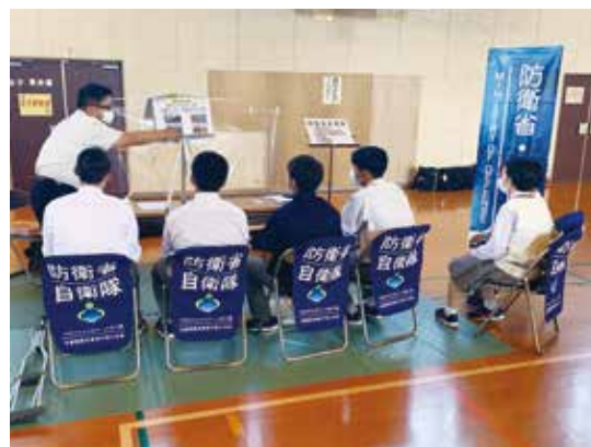
自衛隊のブースで説明を受けています