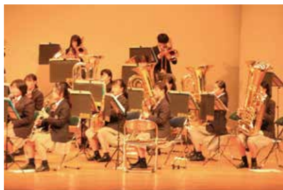
これからは1・2年生ががんばってくれます