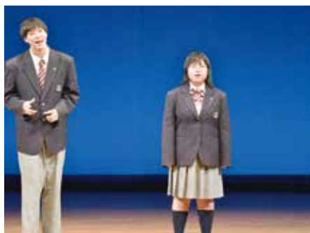
動きをつけて歌いました