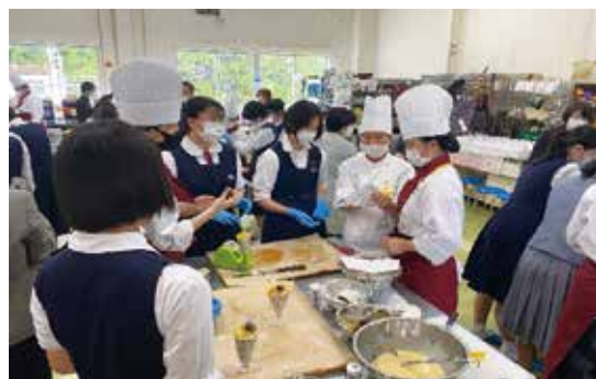
美味しくできました