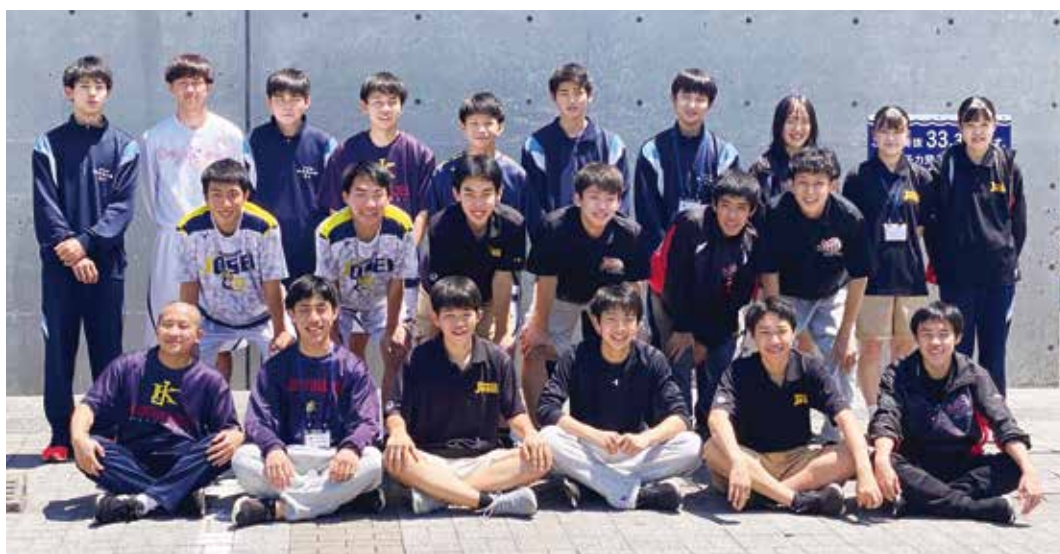
高校総体後の集合写真

今後もバスケットボールのスキル向上及び人としての成長，大会での目標達成をできるように頑張っていきたいと思います。