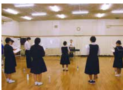
普通科 芸術文化コース