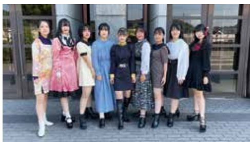
個性が光るワンピース (2年生)