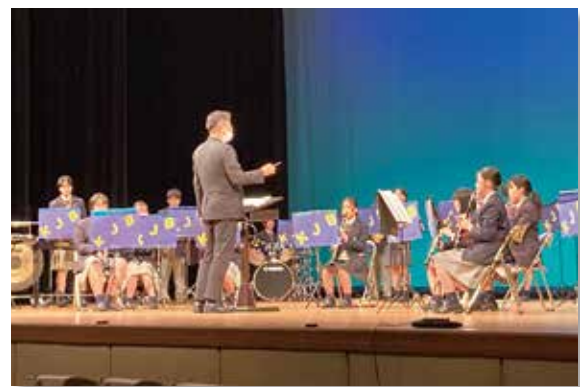
吹奏楽部によるアンサンブル