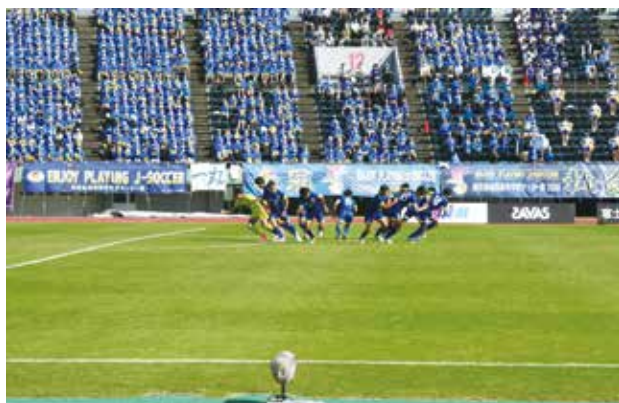
試合が始まります!!

10月31日(日)から行われた第100回全国高校サッカー選手権鹿児島大会に男子サッカー部が出場しました。順調に勝ち上がり、準決勝出水中央高校に2-0で勝ち決勝進出を決めました。決勝戦は、惜しくも神村学園高等部に0-4で敗退いたしました。サッカー部の選手が頑張っている姿に、応援している生徒たちも感動していました。またサッカー部もこの悔しい結果を胸に頑張ります!!