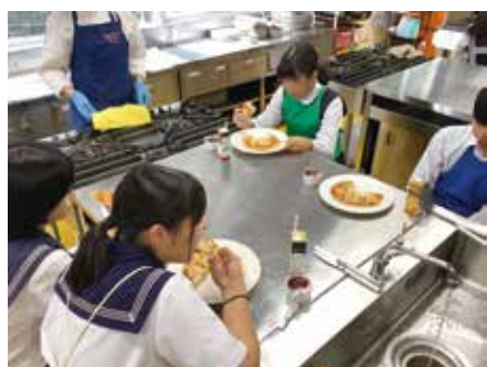
美味しそうに試食してくれています