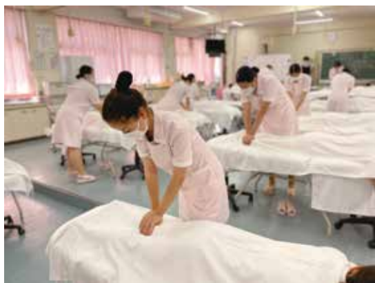
お客様のお悩みに合わせたトリートメント♪

トータルエステティック科の集大成ともいえる認定試験の時期になりました。実技試験と筆記試験を控える3年生の姿はエステティシャンさながらの様子です。合格に向けて頑張ってください♪