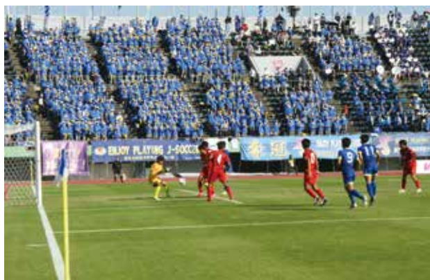
相手ゴールに迫っています!!