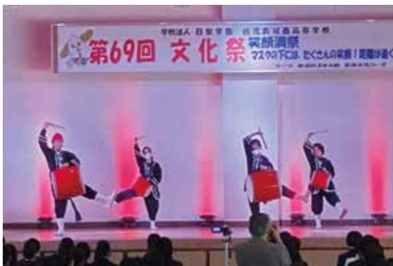
エイサー部の演舞

当日は天候にも恵まれ、生徒たちはそれぞれの場所で発表を楽しんでいました。この日のために一生懸命練習を重ねてきた生徒も「晴れの舞台」を披露できたことは、一生の思い出になったことと思います。