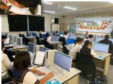
Excelを活用しての現金出納帳の作成