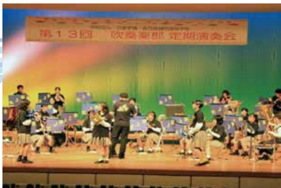
感動するステージとなりました