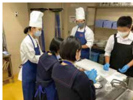
ピザ生地伸ばし方をレクチャー中

また、次の体験入学の際には、先輩から教わったことを生かして、自分から積極的に話しかけたいと思います。