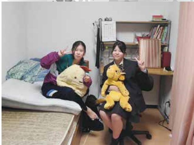
同じ寮で同じクラス♪

サンライズ寮では、学校と家事の両立を行いながら充実した生活を送っています。家族のありがたみを感じつつ、強くたくましく成長していています♪