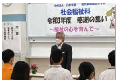
校長先生のあいさつ

今後は、この日を起点に介護福祉士国家試験受験に向け、「やり抜く力」でHR全員が辛苦をともにする覚悟を持ってさらにまとまることを期待します。