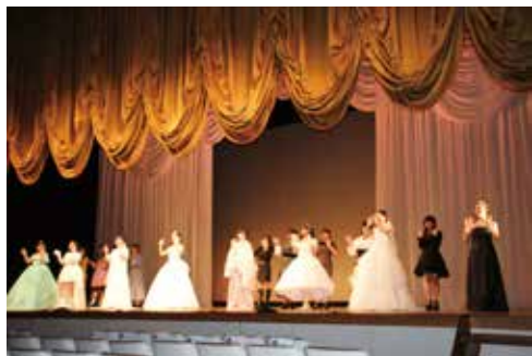
ファッションショーフィナーレ

11月2日(火)、伊集院文化会館で文化祭が行われ、ファッションデザイン科3年生と2年生はファッションショーをしました。12月18日(土)に県民交流センターで開催するファッションショーに向けて作品制作を進めていますが、その一部を披露しました。少ない練習時間でしたが、日頃のウォーキングの練習成果も発揮して、思い出に残るステージとなりました。