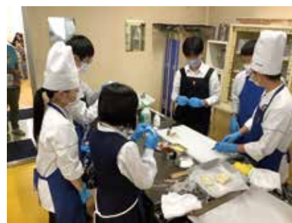
食材の切り方を説明中