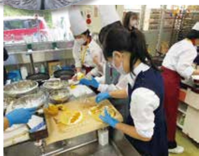
楽しい体験になりました