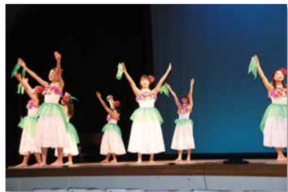
フラダンス部のパフォーマンス