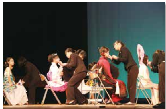
ヘアデザイン科によるヘアメイクショー