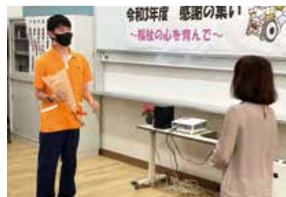
語り尽くせないエピソード