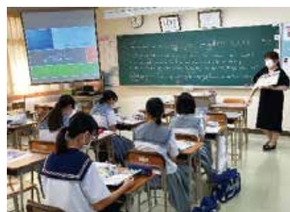
普通科 進学・公務員コース