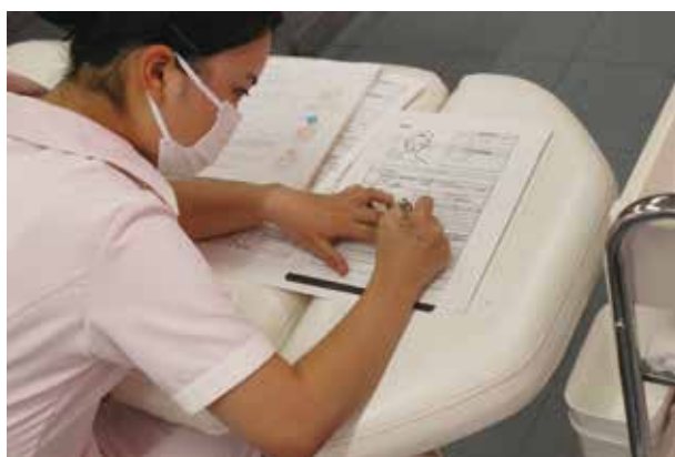
認定試験に向けて3年生が一丸となり真剣な眼差しです!