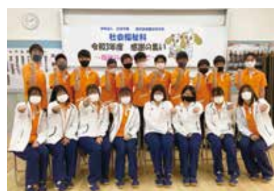
国家試験頑張ります！