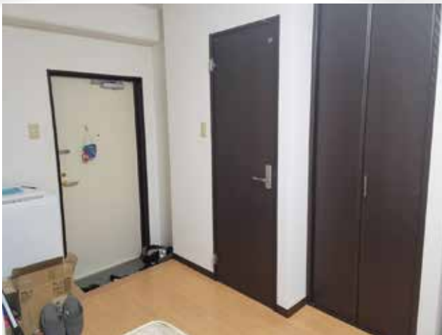
しっかり掃除も自分で行っています!