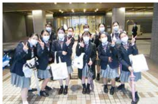
試験が終わり、会場前にて