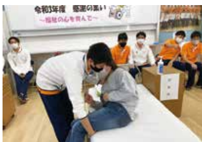
保護者との距離が近く緊張