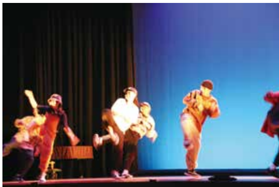
芸術文化コースによる「HIP HOP」