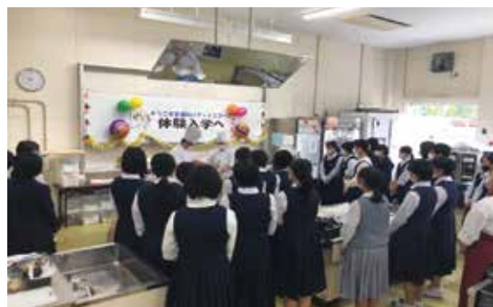
講師による制作披露