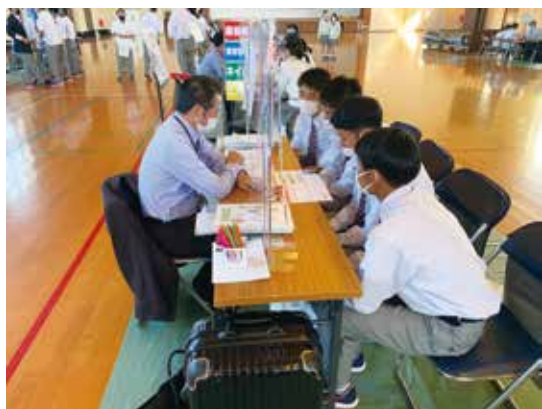
資料を基に真剣に聞いています

私は看護学部がある大学への進学希望を胸に抱いて今回の進学説明会に参加しました。そこで，専門学校でも大学と同じ資格が取得でき，進路も充実していることが分かり，新しい発見をすることができました。また，今後の学校生活でのやるべきことを改めて考えることもでき，今からしっかりと進路実現のための勉強を進めていこうと思いました。