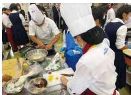
普通科 パティシエコース