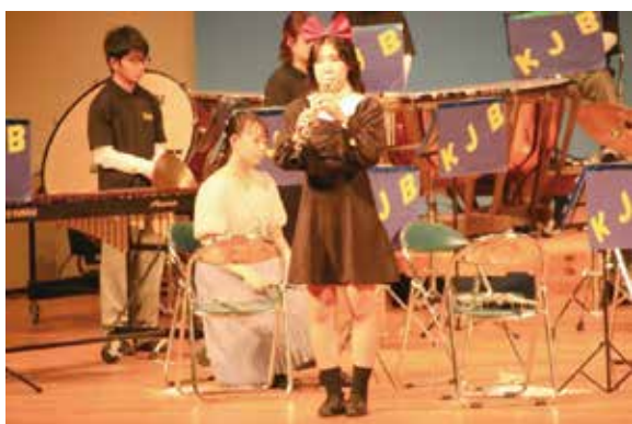
楽しい演奏をありがとう