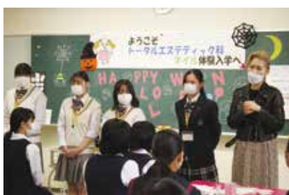
トータルエステティック科