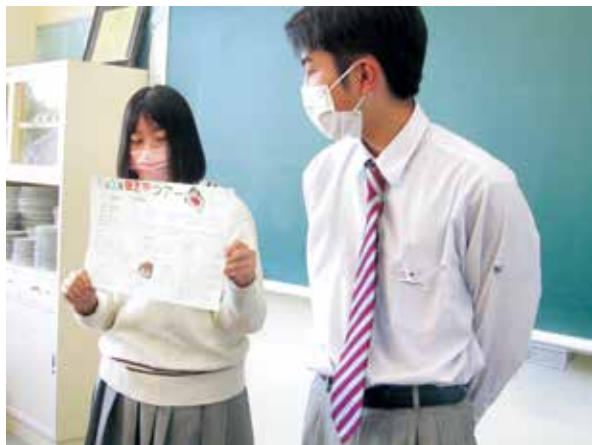
日置市の観光地を発表しました

県内の有名な観光地をはじめ、生徒お勧めのスポットなどを行程に組み込み、オリジナルのツアーを企画し、クラスで発表をしました。