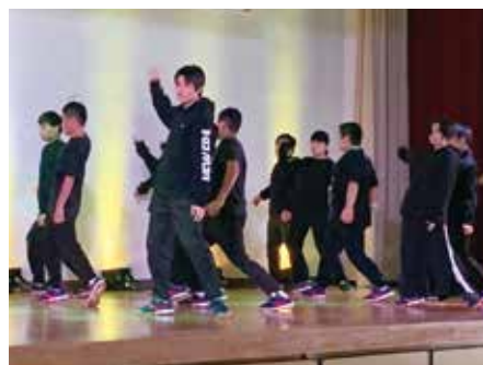
緊張の中でも精一杯