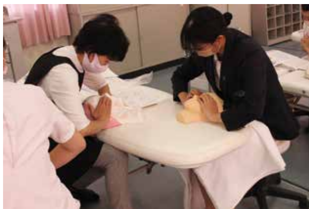
帆足先生と技術確認!!