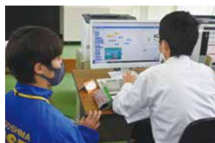
普通科 アプリケーションコース