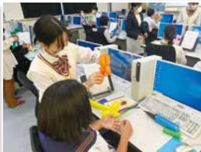
バルーンアートに挑戦