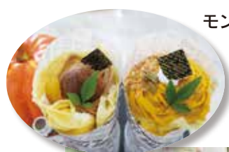
モンブランクレープ