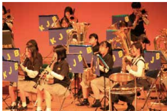
OBも一生懸命手伝ってくれました