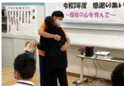
自然と体が動きました