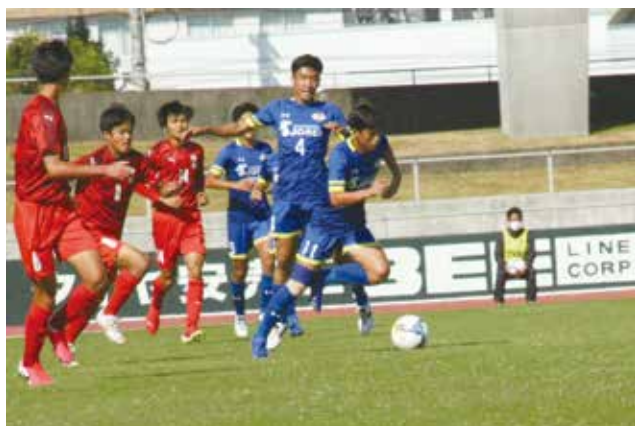
応援ありがとうございました！