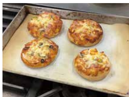
できたて!! チーズがとろーりピザ