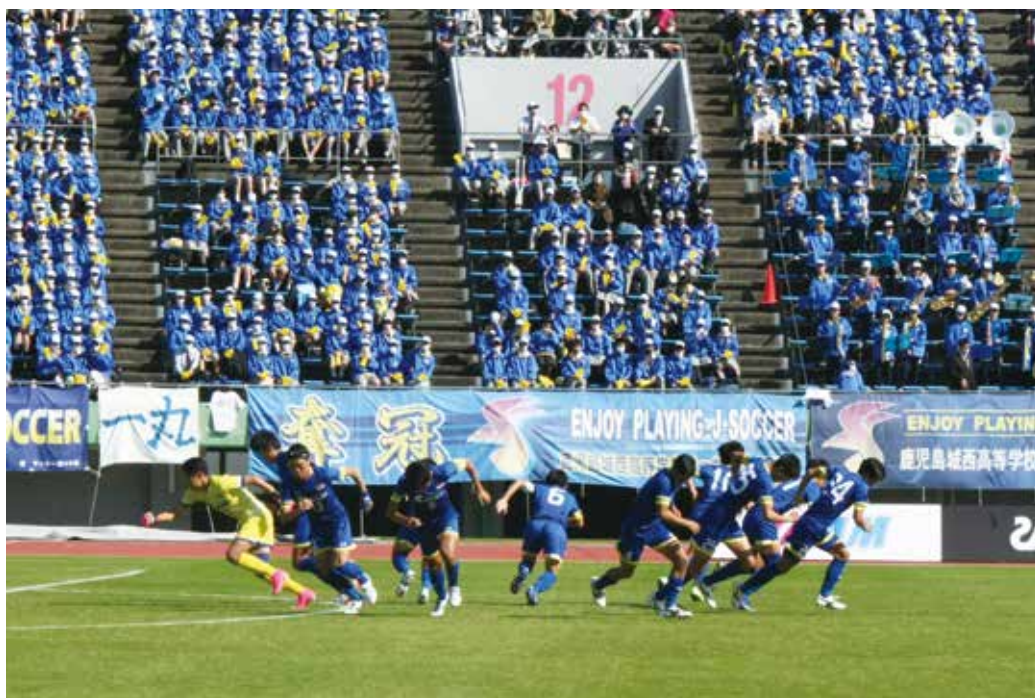
全校生徒の応援を力に全力で戦いました