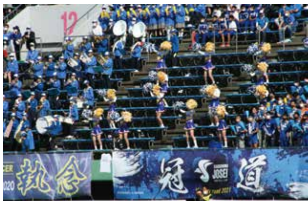
スタンドの生徒も全力で応援しています!!