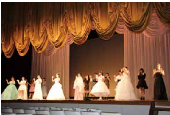
ファッションデザイン科の発表