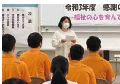
保護者代表あいさつ