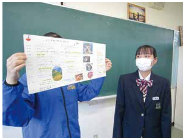
甕島の観光地を発表しました