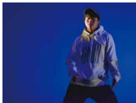
躍動感あふれるダンス