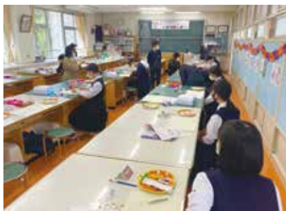
ファッションデザイン科