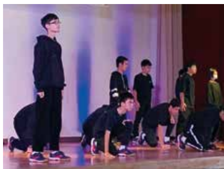
フォーメーションを変えて

今年は新型コロナウイルスの影響で、学校行事が次々と延期・中止となる中、無事に文化祭を実施できたのは、日頃感染対策に努める一人一人の努力の成果だと思います。今年のテーマ「笑顔満祭～マスクの下にはたくさんの笑顔！距離は遠くても心は近くで～」のとおりみんな笑顔の文化祭になったのではないのでしょうか。