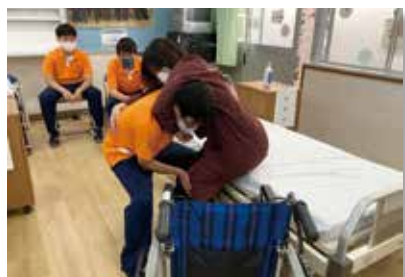
互いに負担をなくすが基本