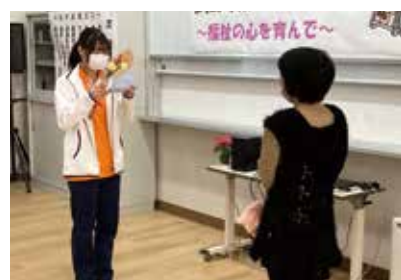
感謝の思いを伝えます