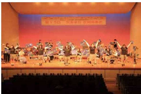
最高の演奏をしてくれました