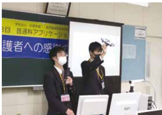
プログラムでドローンの飛行制御する作品の説明

集いの最後には、3年間の高校生活を応援してくれた保護者に向けて、感謝の気持ちを手紙で伝えました。日頃素直に伝えることができなかった感謝の想いを伝える良い機会となりました。