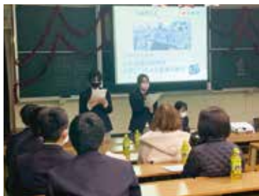
プレゼンテーションでの活動発表

12月17日(金), 3年生の保護者をお招きし, 本校視聴覚室で「保護者への感謝のおもてなし」を開催しました。3年間の授業で学んだことを保護者の前で披露しました。「プレゼンテーションでの活動発表」「電卓早打ちリレー親子対決」「マジックショー」を行い, これまで支えてくださった保護者へ感謝の気持ちを表しました。3年生は, 保護者への感謝の気持ちを込めた手紙と商品開発したスイーツを贈り, 様々な実演や演出を行う子どもたちの成長した姿を見て, 保護者の方々はとても嬉しそうな表情を浮かべていました。心温まる一日となりました。