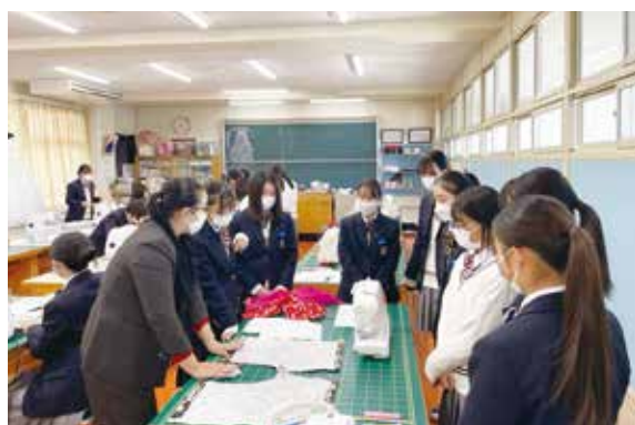
3級のショートパンツは構成を理解することがポイント（1年生）