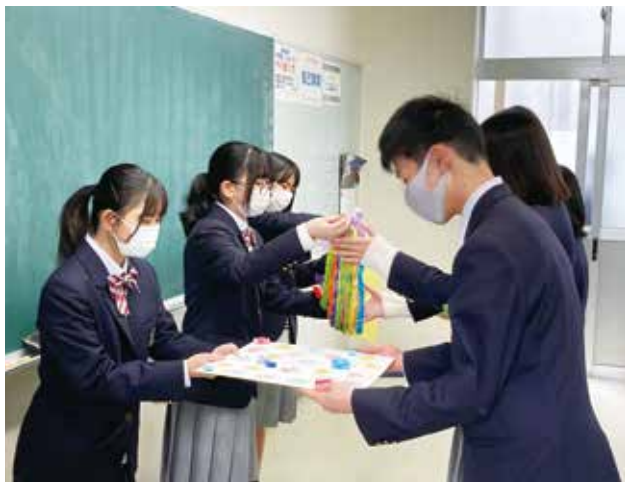
先輩たちの合格を祈念します

現在、介護福祉士国家試験の結果待ちの3年生ですが、後に続く後輩たちにより報告をすることができるよう祈るばかりです。