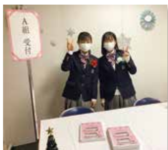
後輩たちもお手伝い!!