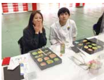
親子で楽しい会食(^_^)v♪