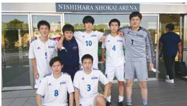
県大会に参加しました

鹿児島城西高等学校フットサル部は、学業との両立を図り、体を動かすことで健全な精神を育むことを目的に日々練習しています。昨今は、新型コロナウイルスの影響で例年開催されている大会が延期や中止となり、練習に対する意欲を保つことが難しい中でも練習に励んでいます。今年の5月には、全日本ユースU-18フットサル大会鹿児島県大会が開催の予定です。実際に開催されるかはまだ分かりませんが、次の大会に向けて今できることを積み重ねていきたいです。