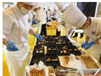
弁当に詰める作業は大変(>_<)