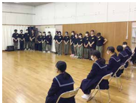
普通科芸術文化コースによる説明