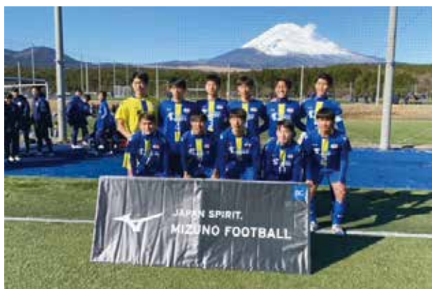
試合に出場した選手たち

以上の結果でリーグ3位となり、残念ながらトーナメント進出を果たすことができませんでした。しかし、1年生で全国大会に出場できたことは、今後の鹿児島城西サッカー部として勢いをつけることにつながったと思います。肌で感じたことを日常のトレーニングに還元し、更に強くなれるよう常勝軍団を目指して頑張ります。