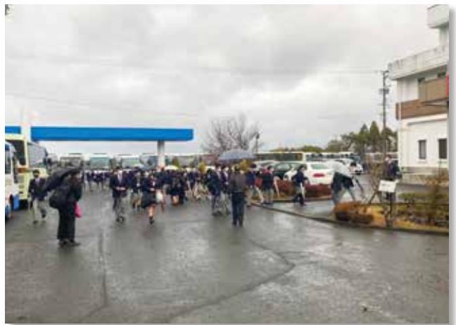
あいさつをして登校しています!!