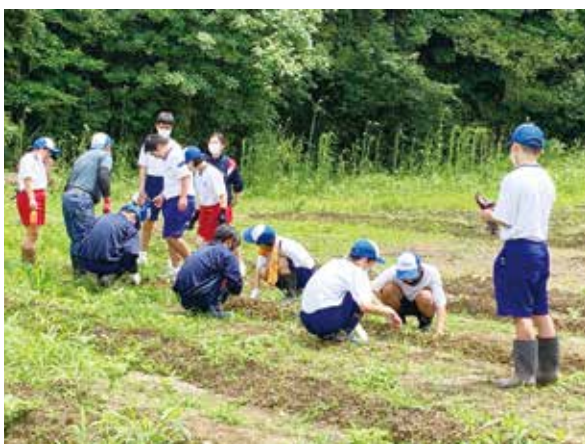
季節の野菜を育てています

普通科共生コースの園芸の授業では、年間を通して、白茄子・かぼちゃ・冬瓜などの季節の野菜を作っています。授業を通して、野菜を育てることの大変さや食べ物のありがたさなどを感じてほしいです。