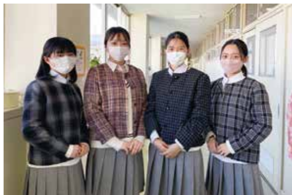
難易度の高い課題が仕上がりました（3年生）