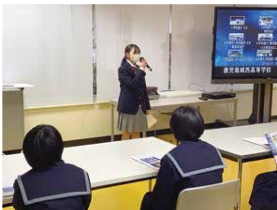
在校生による出身中学校へのあいさつ