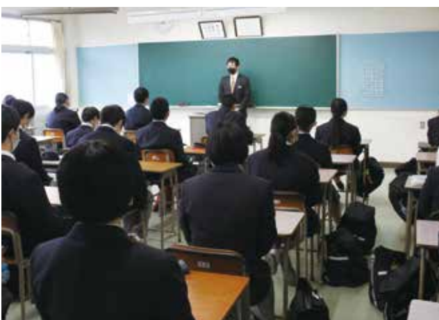
厳粛な雰囲気ではじめ式を迎えています