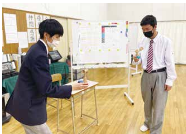
真剣な眼差しで臨む検定の練習