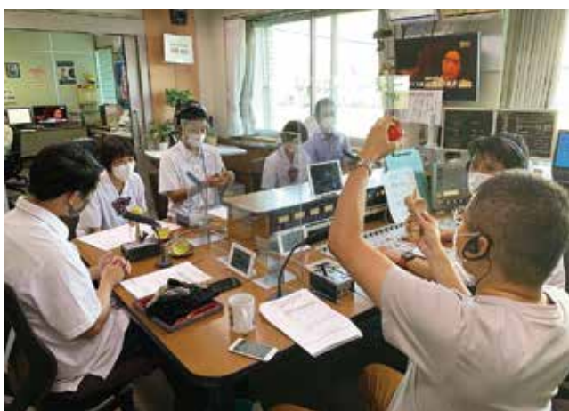
MBCラジオに出演しました