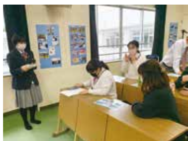
親子で電卓早打ちリレー対決

一人一人マジックやバルーンアートを披露し, 最後はみんなで大作マジックを披露し, 素敵な笑顔の花を咲かせました。