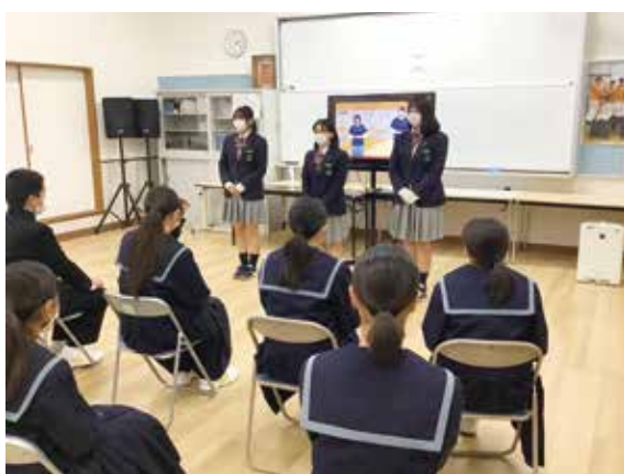
社会福祉科による説明