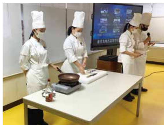
調理科による説明