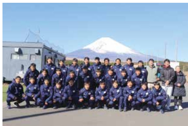
富士山を背景に記念撮影