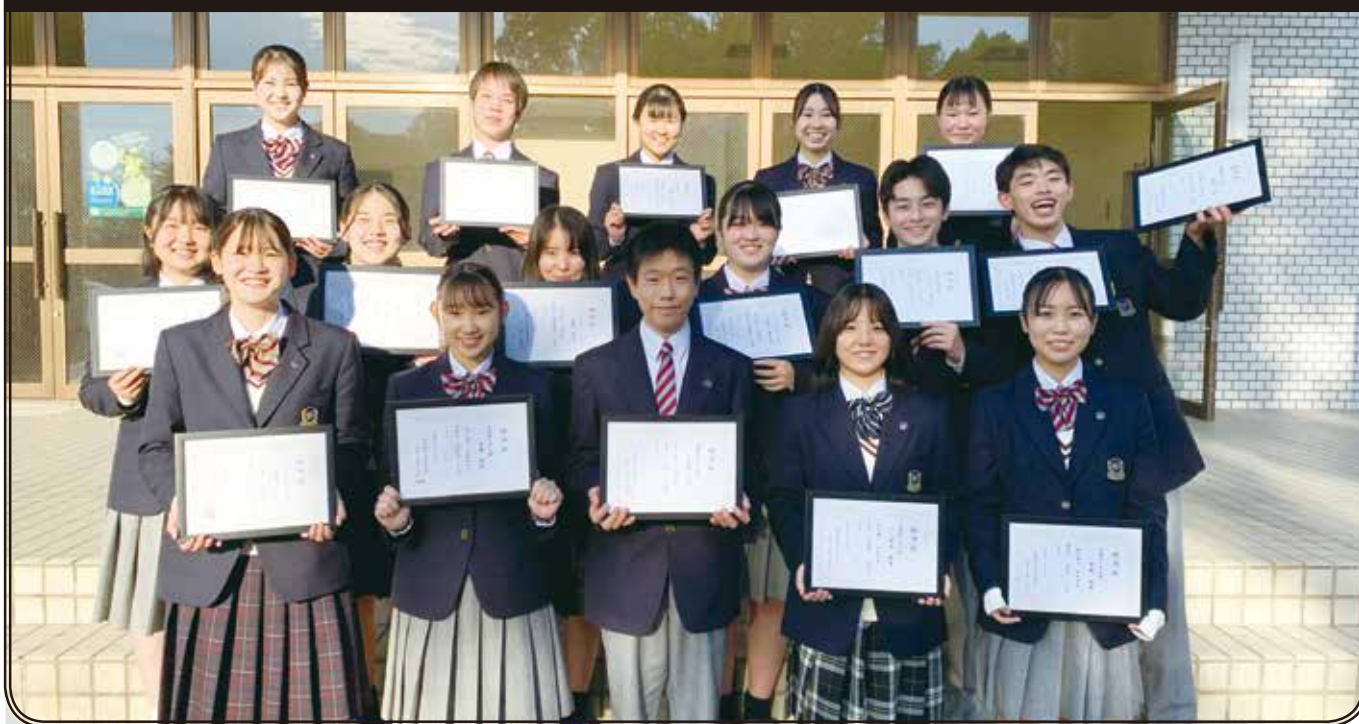
生徒会役員の生徒たち