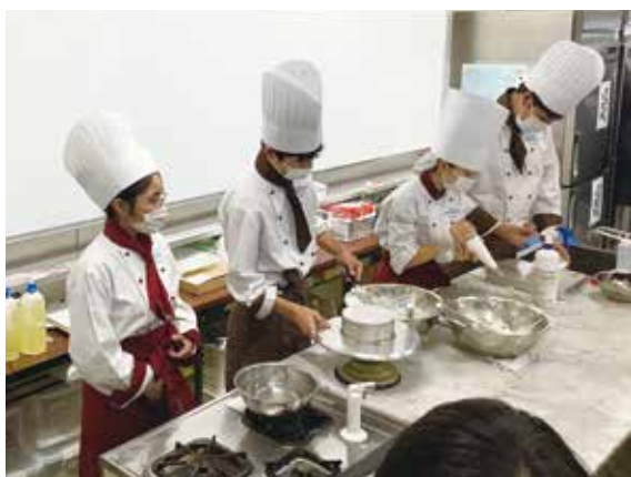
普通科パティエコースによる説明

本校ではより多くの方々に魅力を知っていただくために、中学校の生徒やPTAの方々を対象に視察受け入れを行っています。校内を視察する際は、各学科・コースの説明を生徒が行い、日頃学んでいる専門技術を披露します。令和2年からはコロナ禍の影響もあり、来校者も減少しました。昨年は令和2年度よりも来校者は増えましたが、まだまだコロナ禍前の状況にはほど遠いです。令和4年は少しでも多くの方々に来校いただき、以前のように多くの方々が来校し視察ができる状況になっていることを願います。