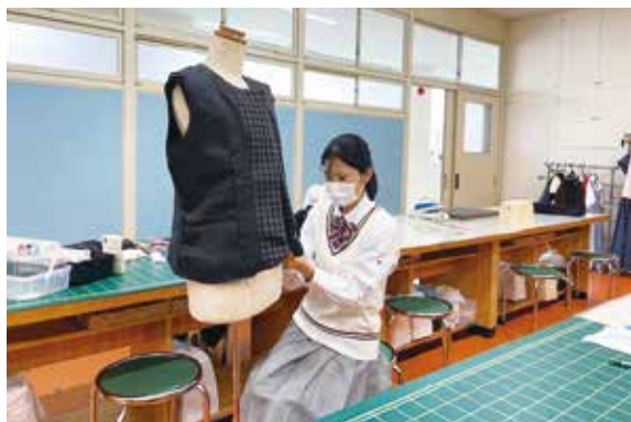
洋服1級の課題は総裏付ジャケット（3年生）

ファッションデザイン科では、1年生から3年生まで、後期の被服製作技術検定の実技試験に挑戦しました。準備期間が短い中、各学年の段階に応じて、1年生は3級のショートパンツ、2年生は洋服2級のブラウス、3年生は高校生活最後の検定、洋服1級のジャケットに、それぞれ練習を重ねて取り組みました。実技試験と作品完成の様子について紹介します。