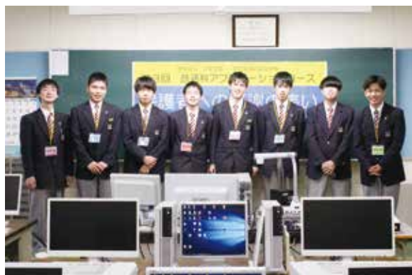
個性あふれる作品を発表してくれた3年生