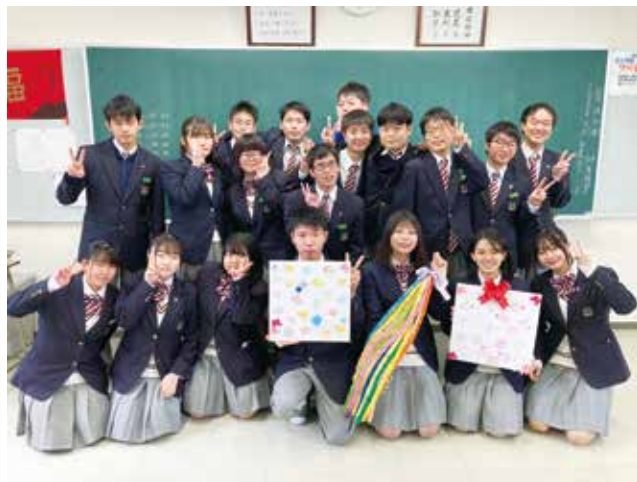
結果後もこの笑顔が見られますように