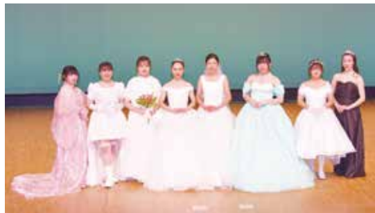
フォーマルドレス 3年生

12月18日(土)かごしま県民交流センターの県民ホールで、ファッションショーを実施しました。ファッションデザイン科の1年生から3年生まで、自分で作った服を自らがモデルとなりステージを歩きました。授業以外にも放課後や自宅でコツコツと作品制作に取り組み、感動溢れるファッションショーになりました。