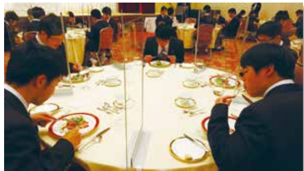
緊張しながらも、マナーを守って食べることができました

令和3年12月22日(水)に普通科共生コースの2年生が「日置市伊集院健康づくり総合施設ゆすいん」でのマンスリープロジェクトに参加しました。今回は、園芸の授業で育てたわさび菜とじゃがいもを販売し、お客さんに大好評でした。参加した生徒たちも、自分たちで接客・販売できたことが非常に嬉しかったようです。