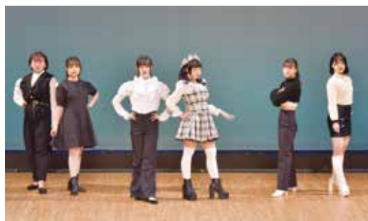
モノトーンのセットアップ 2年生