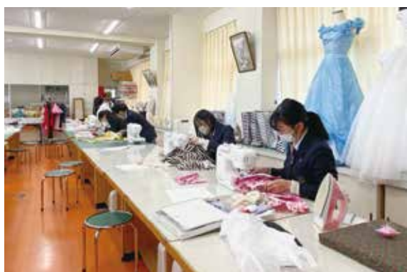
洋服2級のブラウスはえりと袖付けがポイント（2年生）