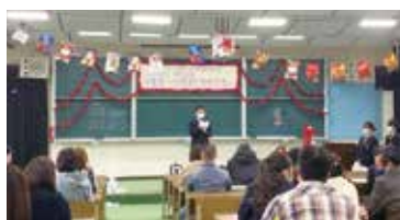
生徒代表感謝のことば