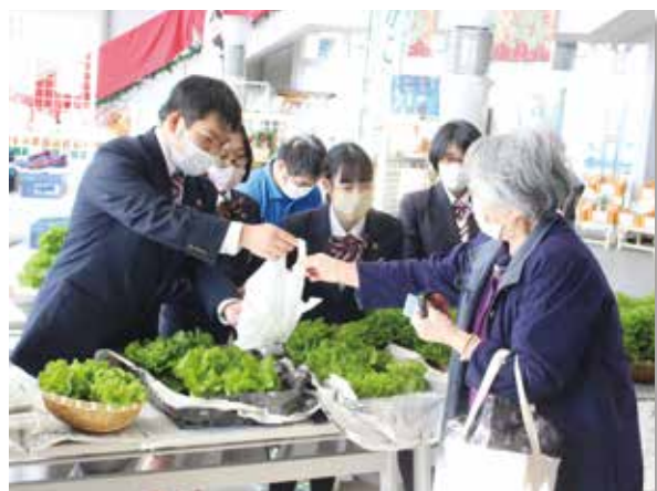
自分たちが育てた野菜が売れると嬉しいです！