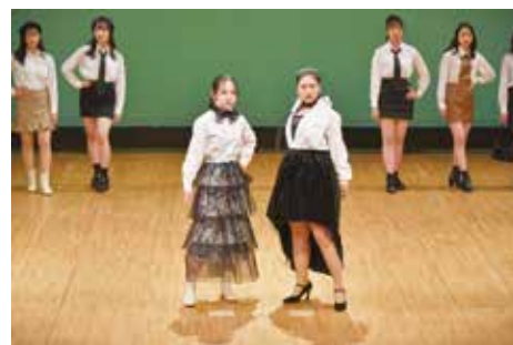
初めての作品 スカート 1年生