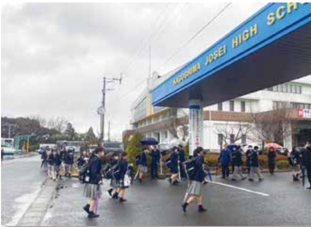
元気に登校しています!!