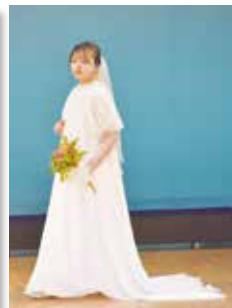
個性が煌めくドレス 3年生