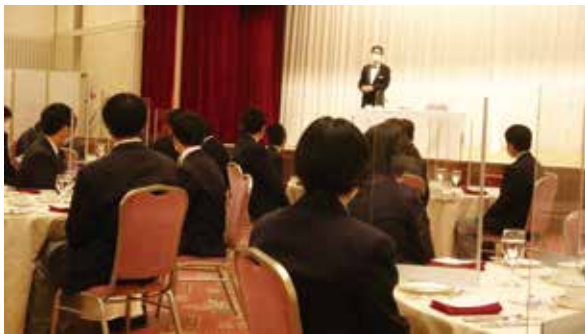
講師の先生からテーブルマナーを学びました

特にテーブルマナー教室では、講師の先生から西洋料理のナイフとフォークの使い方やテーブルマナーの歴史など様々なことを学ぶことができ、生徒にとって非常に良い勉強となりました。今回の社会体験学習で学んだことを今後の生活にも活かしてほしいです。