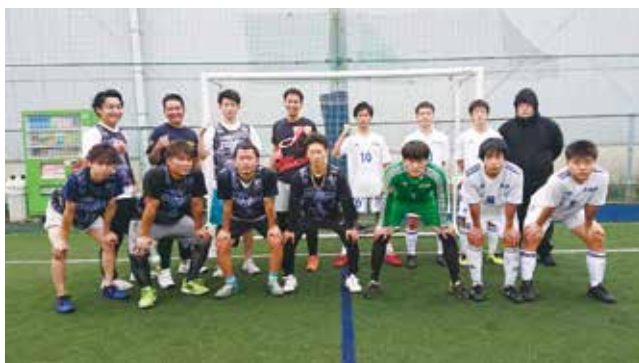
社会人との練習試合