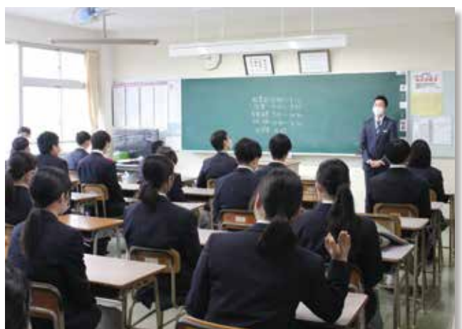
担任の先生に新年のあいさつができました!