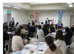
【家庭教育学級で手品教室】