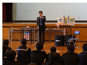
【中学校進路学習で教育手品講話】

最後に、ホームページには 校長だより(毎月発行) と校長の手品を使った楽しい 学校紹介動画 を配信しています。また、楽しい教育手品の講話や手品教室等もボランティア活動で行っています。